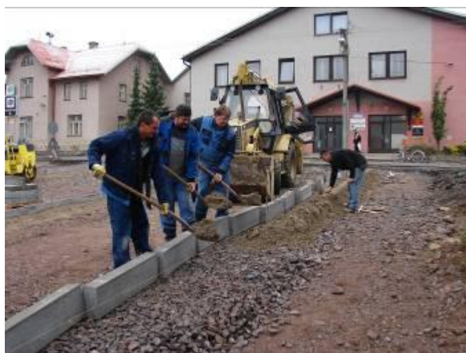
Betonování obrubníků parkoviště.