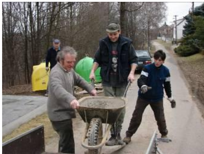
Doprava betonu na výstavbu zpevněné plochy.