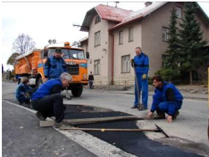
Asfaltování nájezdu na parkoviště.