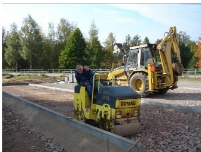
Zhutnění štěrku. podkladu pod parkovací místa.