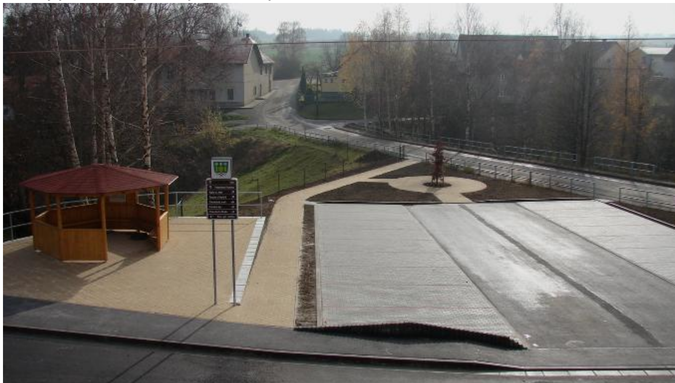
Celkový pohled na upravené prostranství před obecním úřadem.