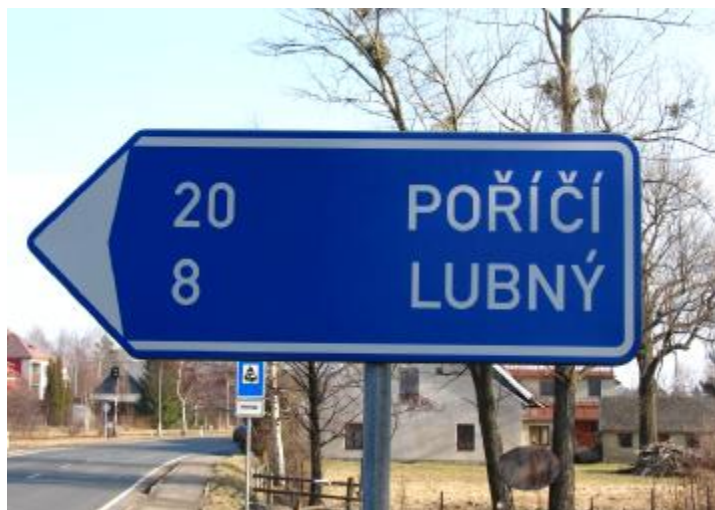
Dopravní značka na „státní silnici“ v Borové.

Pěšiny lesní měnice se v široké cesty vozové spojovaly osadu Lubnou se sídly lidskými v okolí. Po tepnách těchto proudilo zboží vzácné z krajin dalekých, ale i vojska cizácká, ba i choroby zhoubné zavlečeny sem byly. Obec rostla, lid bohatl obdělávaje z generace na generaci děděné grundy. Cesty dávno v silnice formanské se pozměnily a čilý ruch na nich panoval.