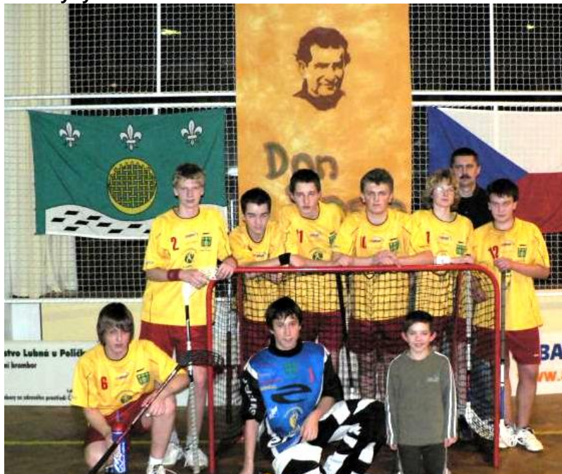
Vítězný tým - starší žáci Vesnická smršť'

Myslím, že rostoucí zájem o turnaj a kladné ohlasy účastníků jsou dobrou propagací obce Lubná v širokém okolí.