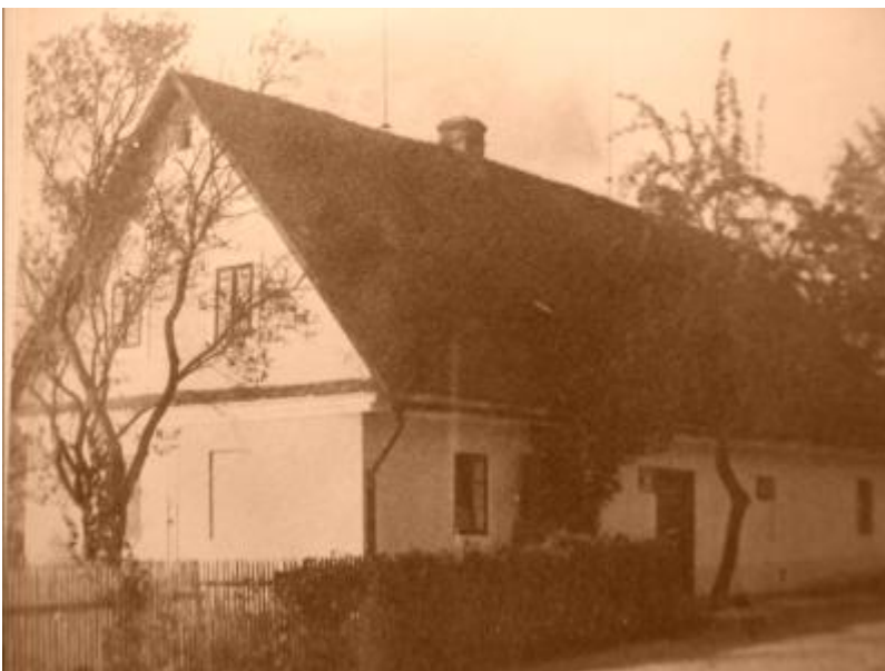
Stará škola čp. 224