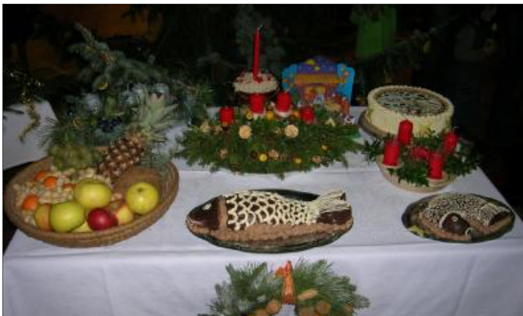
Při konzumaci tohoto kapra Vám určitě kost nezaskočí.

Dne 9. 12. 2006 se konala již tradiční předvánoční výstava na Skalce. Akce se setkala s hojným ohlasem místních občanů i přespolních, což ostatně ukazují následující snímky: