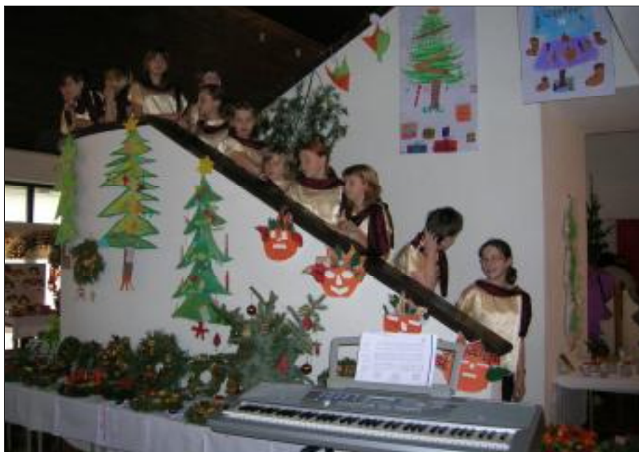
Sbor Lubenika před vystoupením.