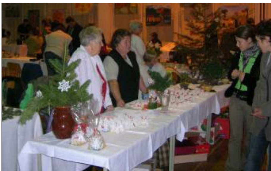
Zaslouženou pozornost budily háčkové ozdoby z rukou našich žen.