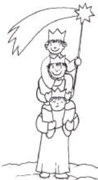
„Tři králové“ před Obecním úřadem Lubná.