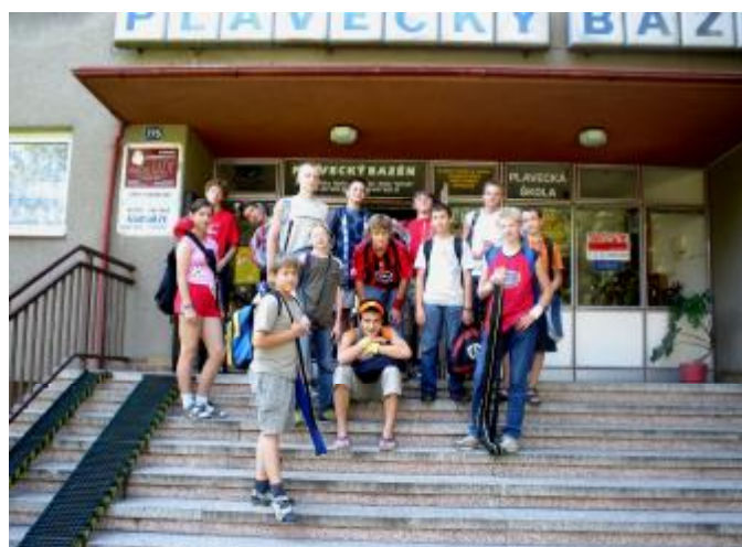
Florbalové soustředění – plavecký bazén Polička