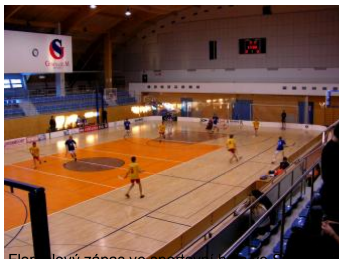
Florbalový zápas ve sportovní hale ve Svitavách