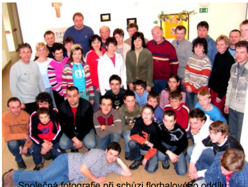
Společná fotografie při schůzi florbalového oddílu

Uzávěrka přihlášek je ve středu 8. března. Na tento turnaj srdečně zveme nejenom naši mládež, ale i Vás rodiče.