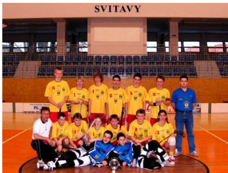
Florbalové družstvo TJ Lubná – starší žáci