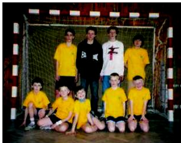
Účastníci krajského kola.

Do krajského kola postupují vždy první čtyři žáci ve své kategorii. I když letos těsně před okresním kolem postihla 6 vybraných závodníků chřipka, dostalo se ze 14 soutěžících do krajského kola 9 závodníků. Ti pak 19. března reprezentovali náš okres v krajském kole v Pardubicích.