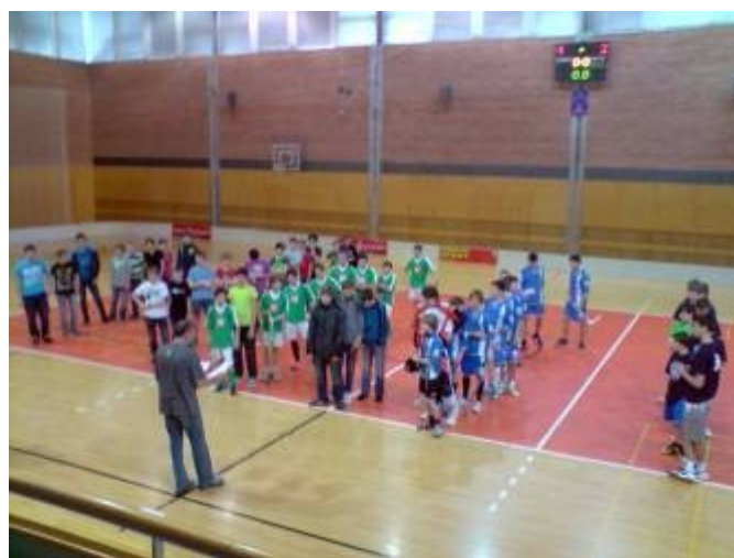
Florbalová liga – mladší a starší žáci