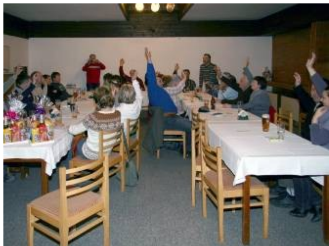
Volba nového výboru