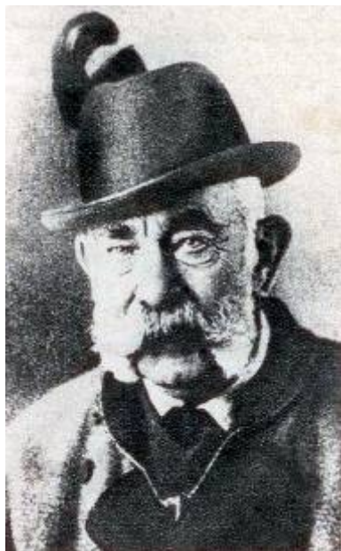
František Josef I.