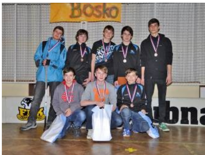
Společné foto bronzového týmu - MAS 3 z Lubné