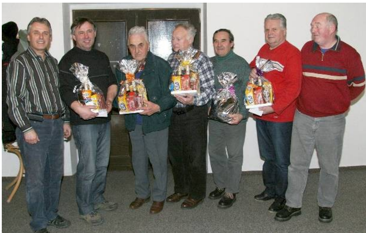
Odstupující členové výboru TJ Lubná