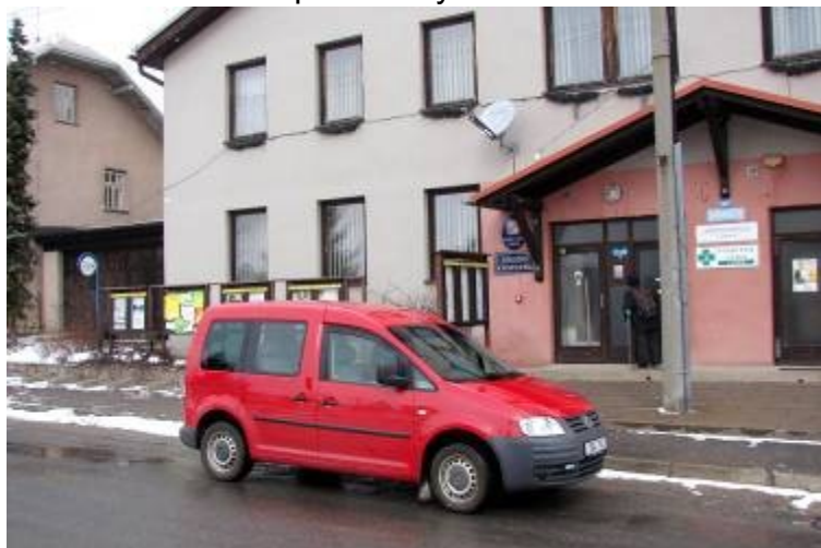
Zakoupený starší automobil

Zastupitelstvo obce na svém posledním zasedání schválilo nákup osobního automobilu. V současné době používaný osobní automobil Forman, který jsme pořídili v červenci 2007, již funkčně dosloužil, proto zastupitelé rozhodli o jeho výměně a zakoupení staršího benzinového automobilu Volkswagen Caddy. Koupili jsme ho v bazaru za 150 000 Kč a bude sloužit pro potřeby zaměstnanců obce.