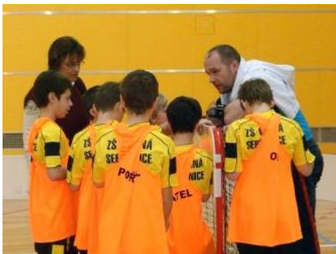
Rady trenéra před zápasem