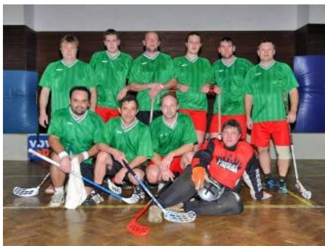
Domácí tým mužů - Kardiaci