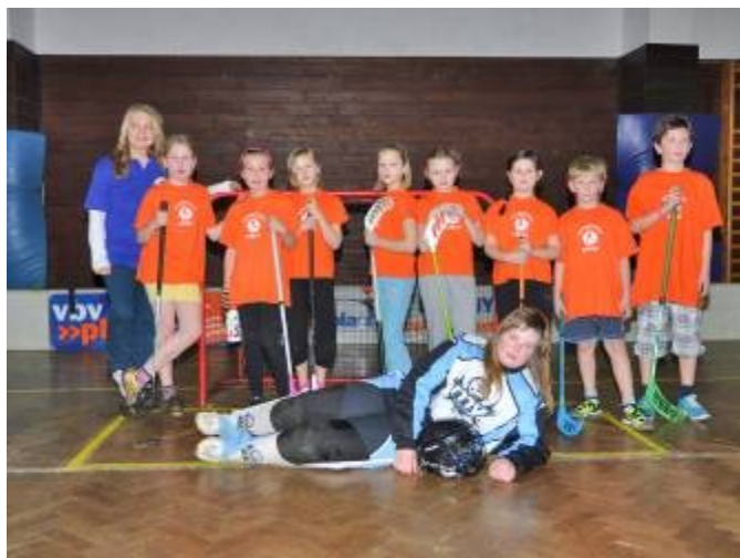
Jediný dívčí tým turnaje