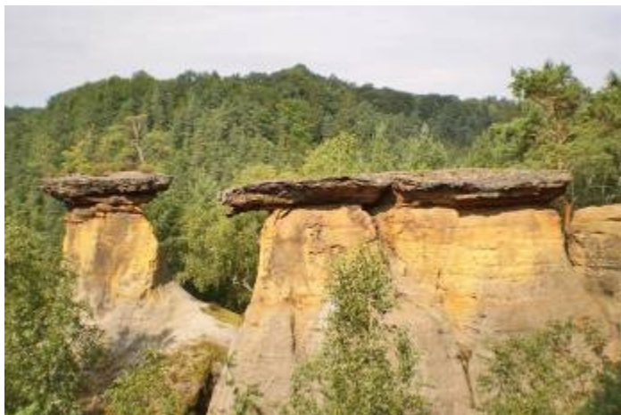
Unikátní krajina kokořínska (pokličky)

Unikátem Kokořínska jsou rozmanité drobné tvary povrchu, jež jsou často formovány do bizarních tvarů. Najdeme tu Obří hlavu, Žábu, Kance, Sněhurku a sedm trpaslíků a širokou škálu voštin, drobných jamek připomínajících včelí plásty. Jsou na skalních stěnách v Kokořínském dole, Kaninském dole, v Bludišti a ve Skalním městě nad Planým dolem. Na každém výše uvedeném místě vypadají voštiny jinak. V CHKO Kokořínsko jsou rozšířené želivce, tedy železité sloučeniny, které zpevňují určitá místa v pískovci. Jsou to ploché desky v pískovcových stěnách (Kamenný vrch u Křenova, Špičák u Střezijovic). Nejnápadnější jsou skalní útvary zvané pokličky při ústí údolí Močidla do Kokořínského dolu. Na protilehlé straně, směrem k obci Jestřebice, se tyčí Jestřebické pokličky. Jsou to zbytky silně železitého pískovce, které svou odolností kryjí podstavce pod nimi. K hlavním Mšenským pokličkám se dostaneme z místa Cikánský plácek (parkoviště). Kokořínsko lze rozdělit na dvě části.