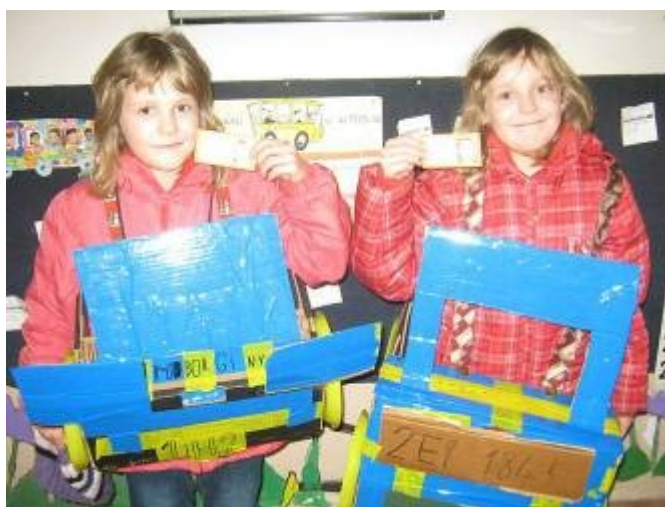
Vyrobená auta a majitelé řidičských průkazů Lamborghini a Porsche