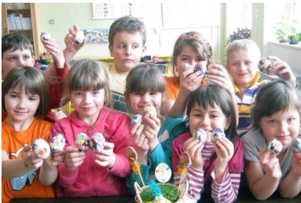
Ozdobené kraslice z knihovny

Asi deset dní před velikonočními svátky navštívily děti z 1. třídy a školní družiny Městskou knihovnu v Litomyšli, kde již tradičně probíhaly velmi pěkné prodejní výstavky výrobků s velikonoční, jarní tematikou. Autorky malých dárečků a knihovnice byly k našim dětem trpělivé