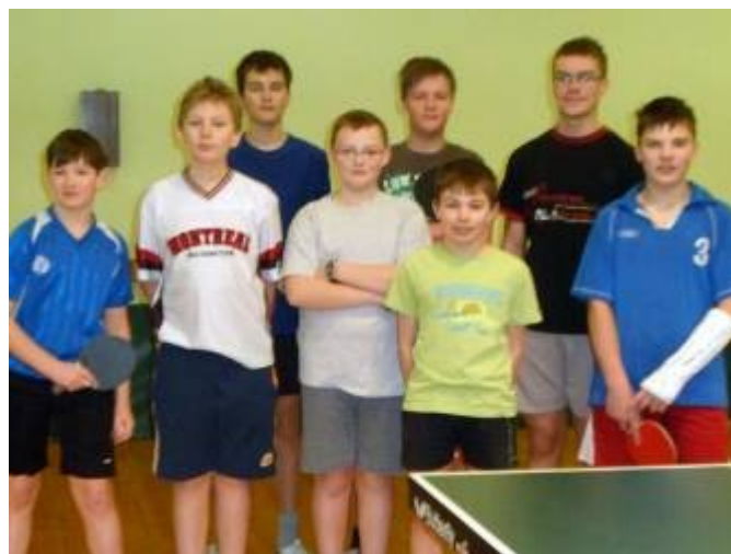
Družstvo žáků naší školy