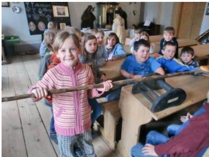
Sázení pečiva do pece