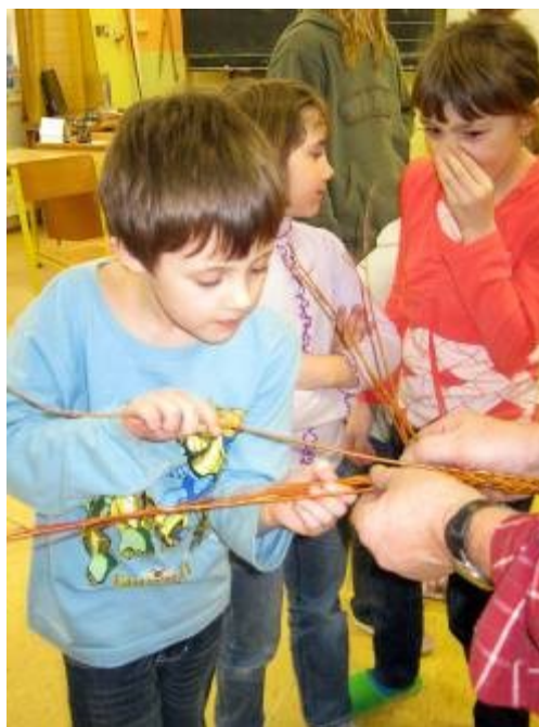
Zkoušíme plést pomlázku