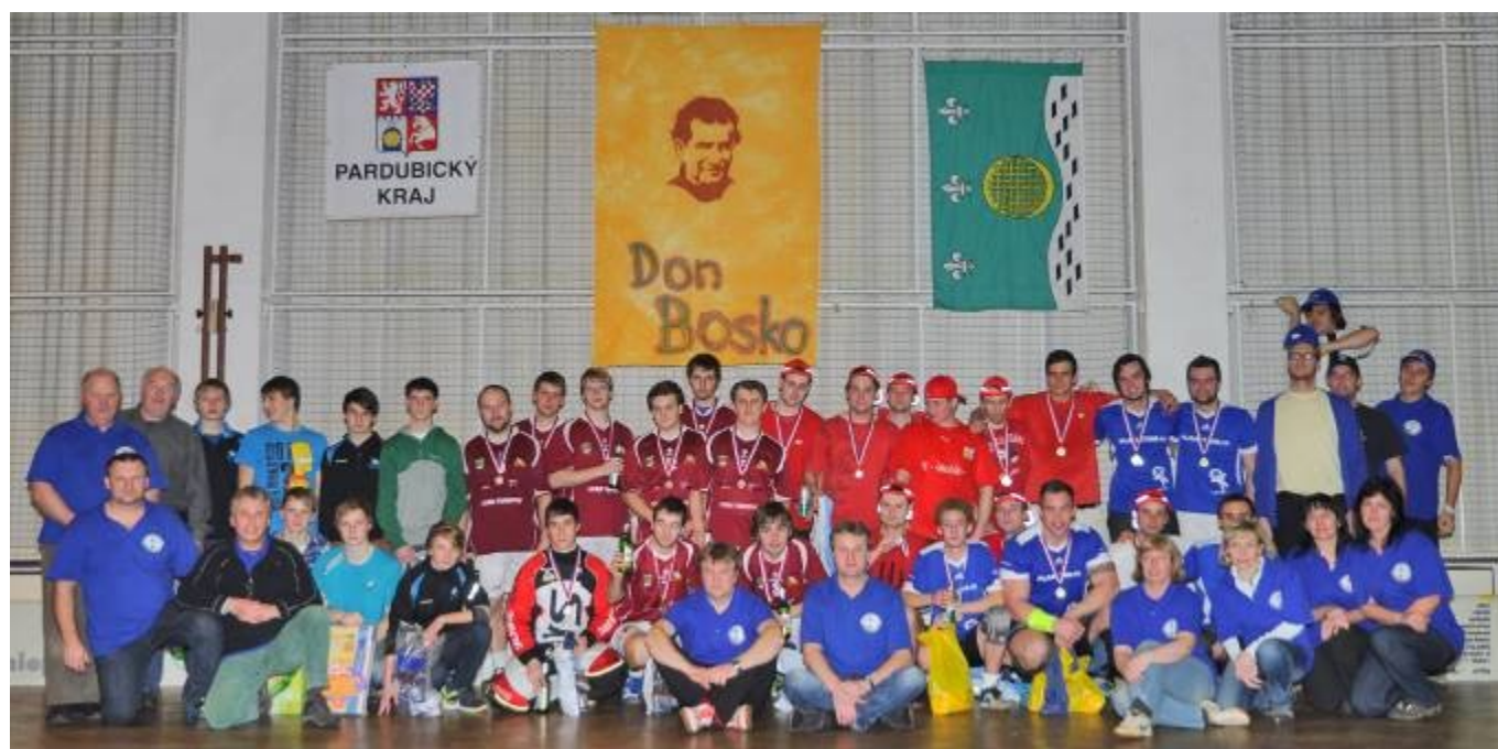
Společná fotografie pořadatelů, hráčů a ostatních účastníků turnaje