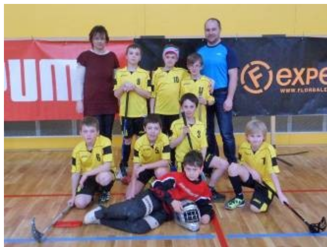
Žáci I. stupně na turnaji TOP 8 VÝCHOD v Olomouci