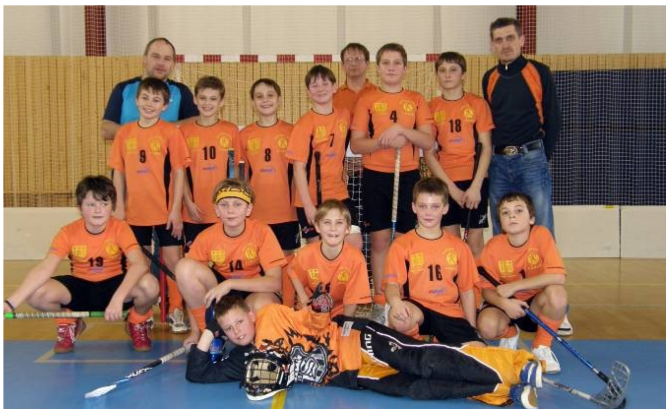
Družstvo mladších žáků TJ Lubná na turnaji v Přelouči