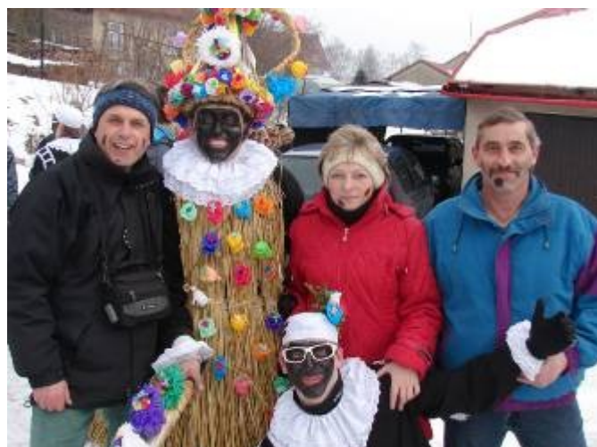
Masopustní veselí ve Studnici u Hlinska