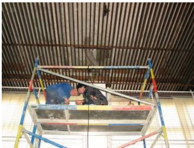
Oprava dešťové kanalizace na Skalce