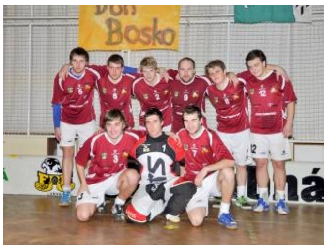
Lubenská smršť - 3. místo, kategorie muži