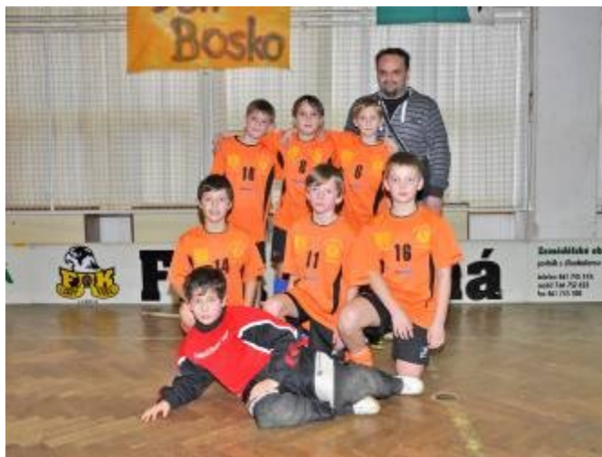
Vítězné družstvo mladších žáků - Lubenští tygři