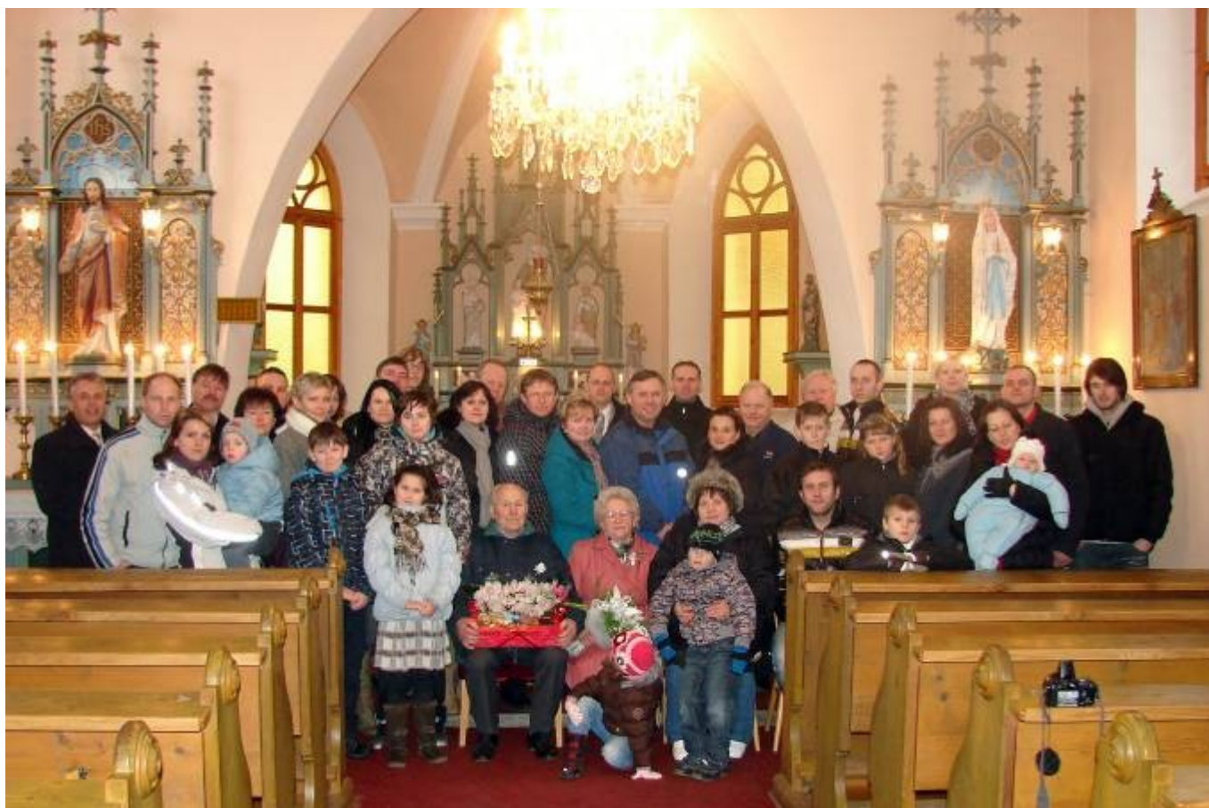
Společná fotografie v kapli sv. Anny