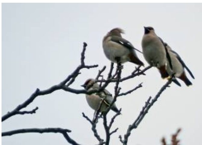
Amatérské záběry brkoslava severního v Lubné

Na konci zimy jsme mohli pozorovat i u nás v Lubné brkoslava severního, který jinak žije na severu Evropy, ve Skandinávii, na Sibiři a Dálném východě. V zimě přelétá v hejnech a stahuje se na jih do střední Evropy, kde vyhledává zbytky jeřabin, šípků, plody jmelí a nesklizená jablka na zahradách.