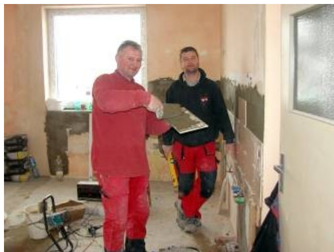
Oprava obecního bytu na Skalce