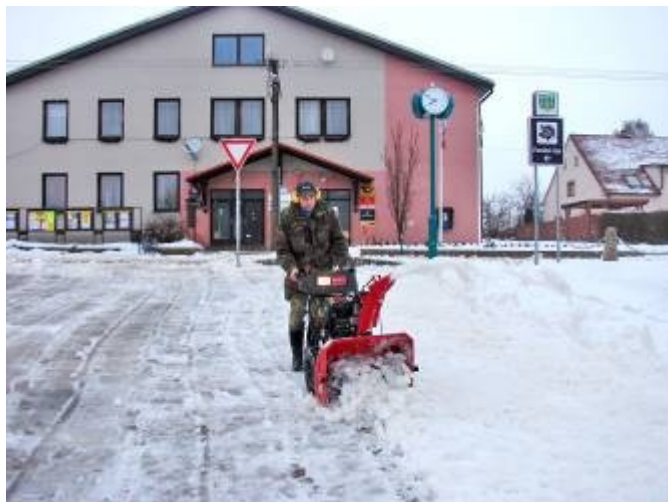
Úklid sněhu na parkovišti před obecním úřadem