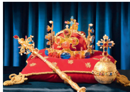
do 1. 9. České korunovační klenoty na dosah