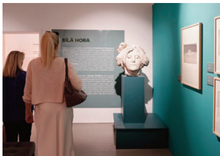
do 15. 9. Stanislav Sucharda: Emoce národa