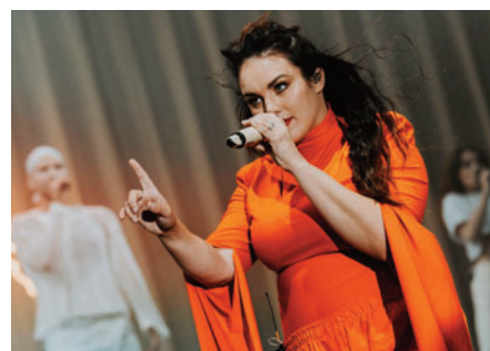
22. 8. Litomyšlská noc – Ewa Farna