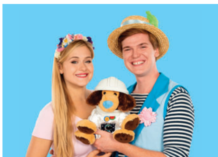
1.9. Štítisko a Poupěnka: Pojď si hrát