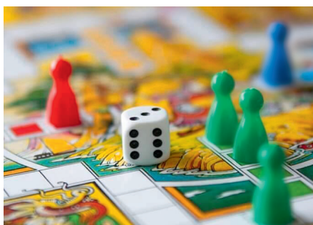
6. a 27. 8. Deskovky pro všechny