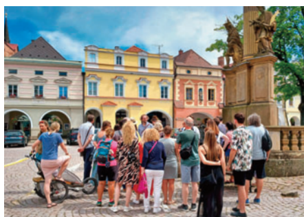
Srpen Pá a So Letní komentované prohlídky