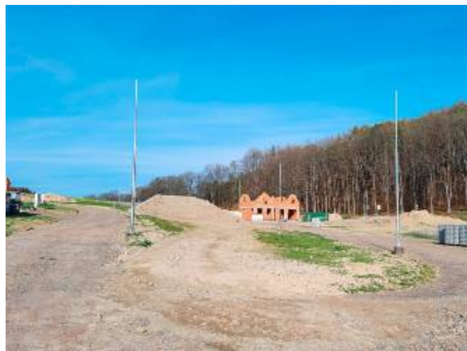
Zasíťované pozemky v lokalitě „Na Zrnětín“

Ve stavební lokalitě „Na Zrnětín“ jsme vstoupili s dodavatelskou firmou PROFISTAV Litomyšl do druhé fáze výstavby. V současné době je dokončena výstavba rozvodu plynovodního potrubí včetně 12 ks domovních přípojek, pokládka kabelového vedení veřejného osvětlení včetně osazení 9 ks stožárů s LED svítidly PHILIPS, výstavba dešťové kanalizace s 5 ks uličních vpustí, dále vodovodní řad s 13 ks domovních přípojek a 3 ks nadzemních hydrantů. U místní komunikace je provedena stabilizace pláňe vápněním a položena štěrkodrt' tloušťky 25 cm. Na odboru výstavby MěÚ Litomyšl bylo požádáno o předčasné užívání stavby před úplným dokončením, které přepokládáme cca do 3 let. Do současné doby je proinvestováno 7.940.000 Kč. Ve druhé fázi výstavby zhotovíme chodníky, které osadíme