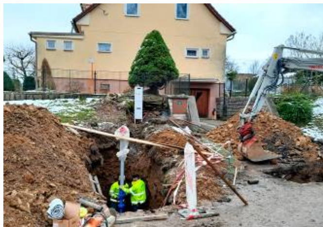
Výměna hydrantů u čp. 146 a Huntovny