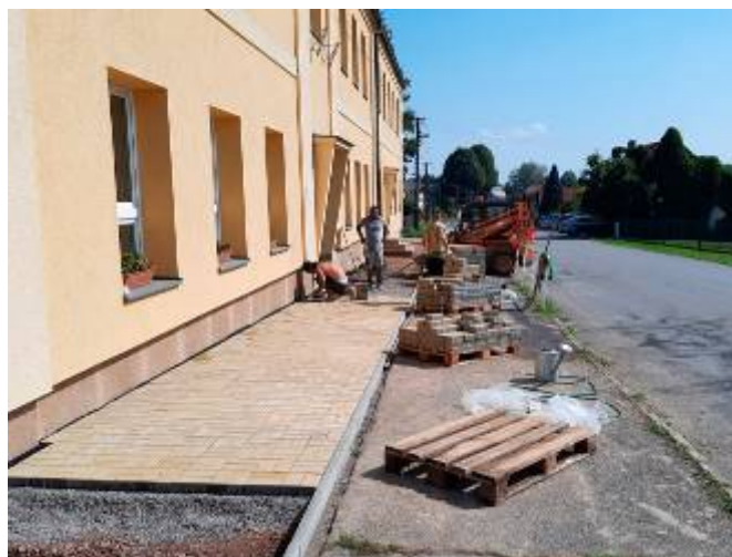
Zámková dlažba před vstupem do základní školy