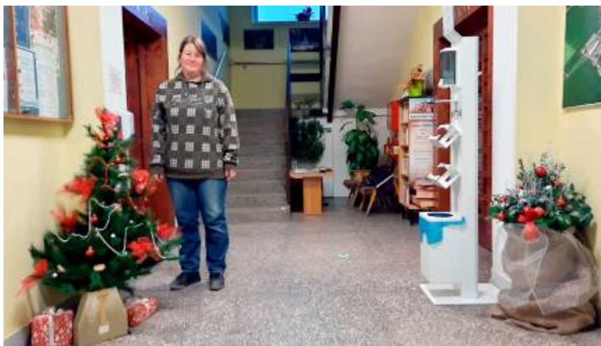
Květinová výzdoba ve vstupní chodbě obecního úřadu