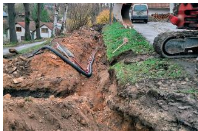
Rekonstrukce sítě NN ve střední části obce