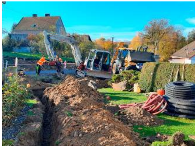
Oprava veřejného osvětlení