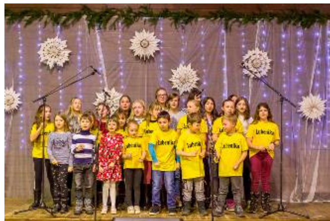
Vystoupení mateřské školy, sboru Lubenika, výtvarná dílna a cimbálové hudby CIMBAL HELLBAND