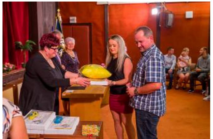
Společný přípitek a předání drobných dáreků