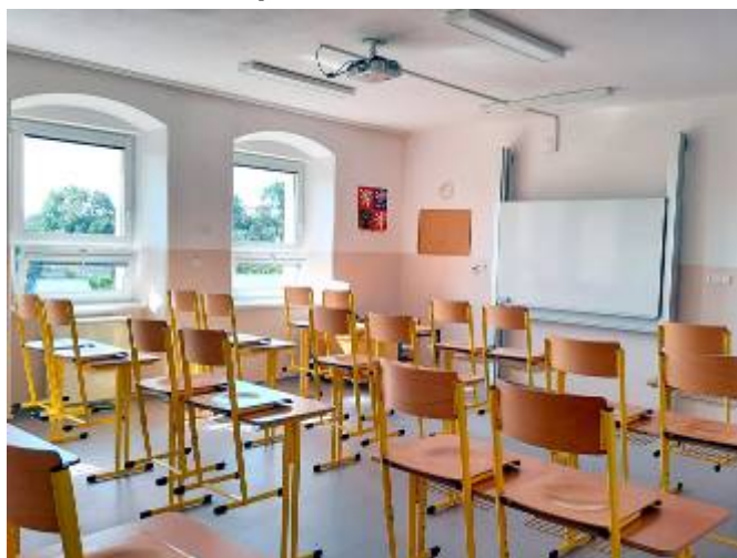
Oprava učebny 9. třídy

Koncem srpna předala firma PROFISTAV Litomyšl opravenou třídu ve druhém podlaží (současná 9. třída) do užívání vedení základní školy. Jednalo se o celkovou rekonstrukci třídy: demontáž dřevěných parket a obložení, oškrábání původních maleb, přeštukování stěn a stropu, zhotovení nového záklopu podlahy, položení nového PVC lina, soklových lišt a parapetů u stávajících oken, zhotovení nových obkladů včetně baterie a umyvadla. Dále byly zhotoveny nové rozvody elektroinstalace, včetně svítidel a akumulčních kamen. Před vstupem do základní školy byla položena nová zámková dlažba včetně zahradních obrub. Celkové náklady dosáhly částky cca 605.000 Kč. Děkuji manažeru výroby Ing. P. Jiráňovi a jeho zaměstnancům za kvalitě odvedenou práci realizovanou v krátkém časovém období během letních prázdnin.