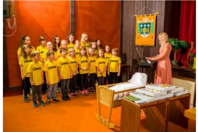
Vystoupení sboru Lubenika