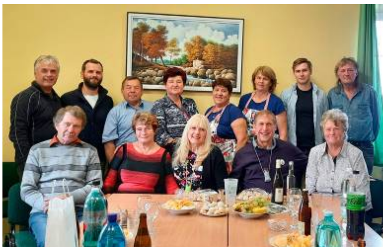
Oběd v DPS