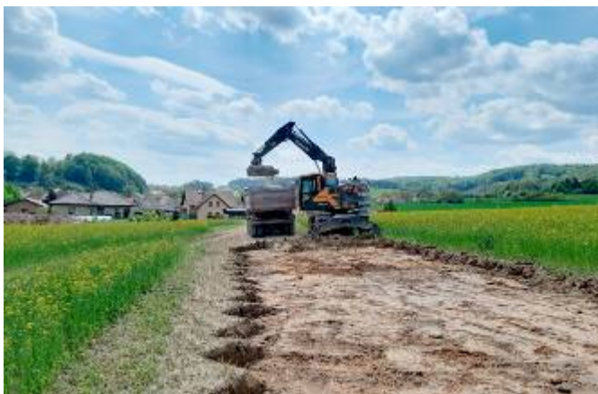
Skrývka zeminy pro budoucí komunikaci