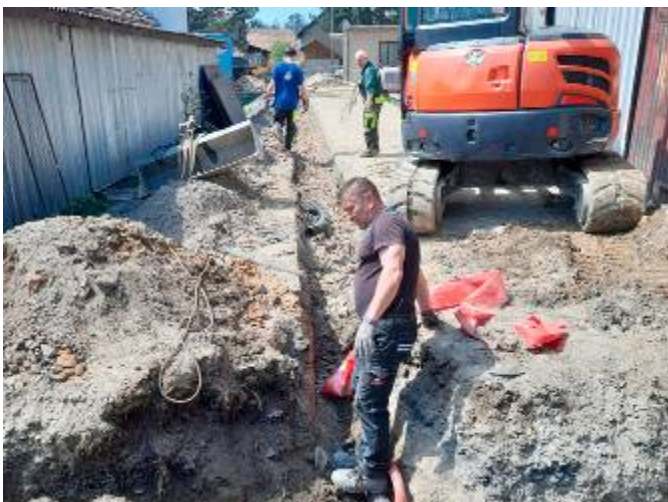
Pracovníci při výkopových pracích a pokládce kabelu