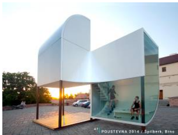
Konstrukce Poustevny, Poustevna, Brno 2014