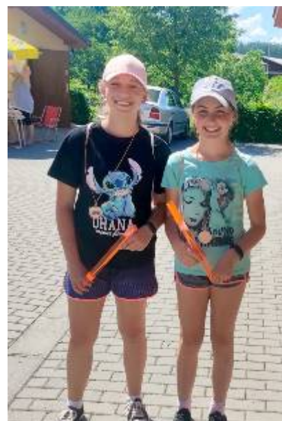
Ocenění účastníci po splnění všech disciplín