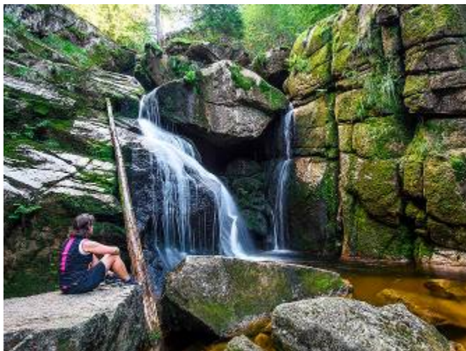
Skalnaté údolí s vodopádem

skaliska, balvany nebo suti. Přestože národní rezervace tvoří celek, jednotlivé úseky mají z části odlišnou podobu.