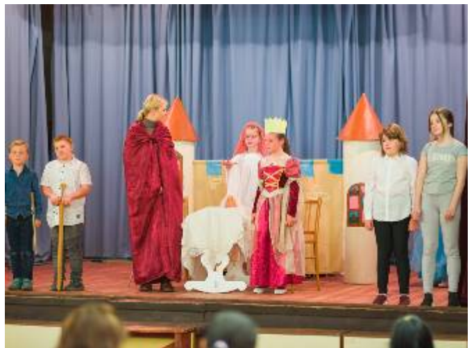
Pohádka Tři bratři v podání pěveckého sboru