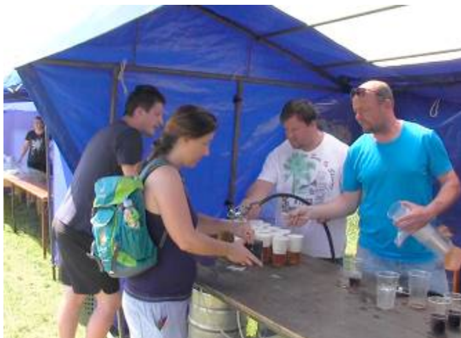
Stánek s občerstvením