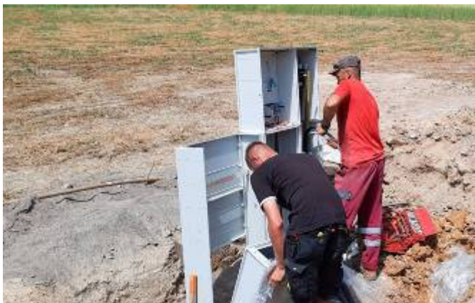
Montáž rozvodů elektrické sítě