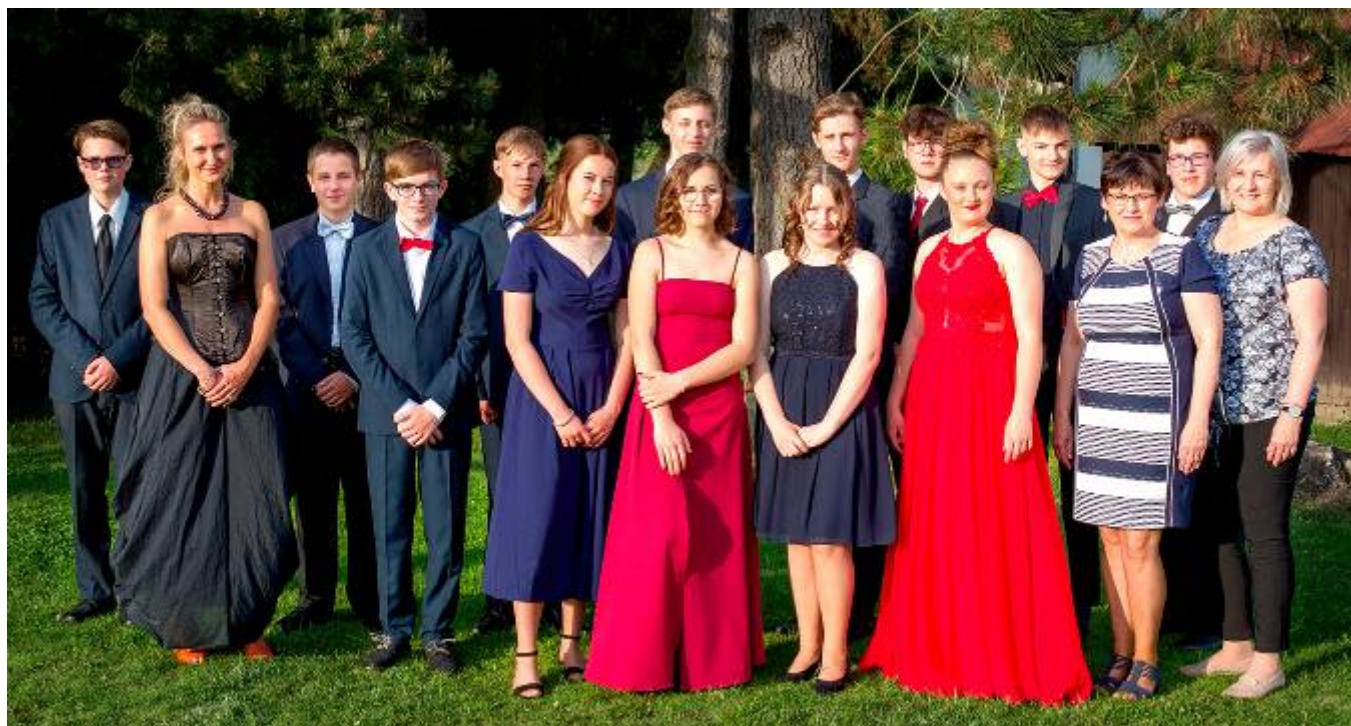
Žákyně a žáci 9. třídy s paní ředitelkou, třídní učitelkou a asistentkou