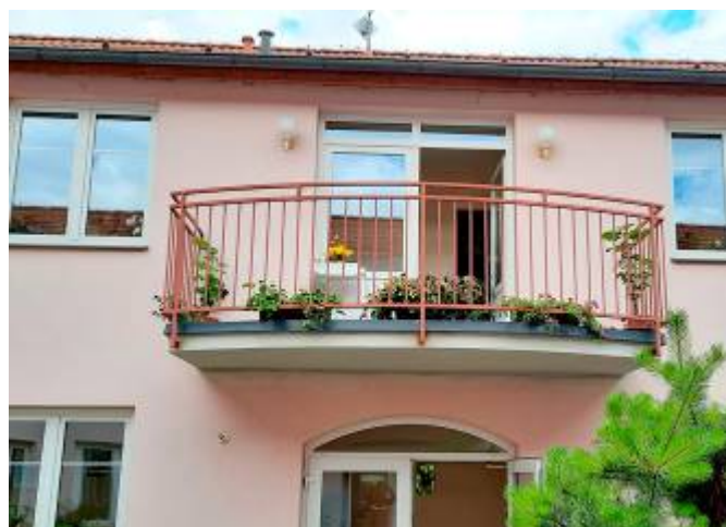
Oprava balkonů v atriu DPS