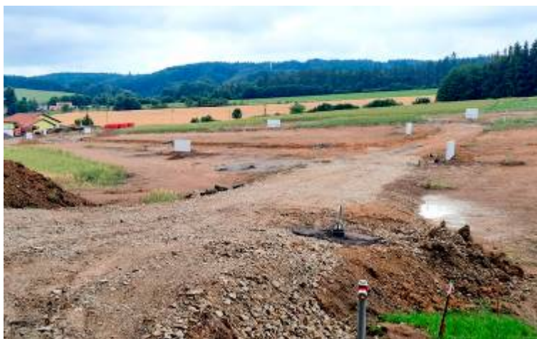
Pohled na zasítovanou lokalitu pro 12 rodinných domů