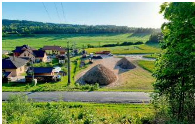
Uložená zemina na staveništi