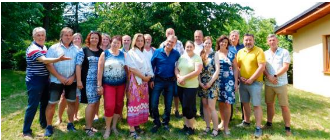
Starostové a zastupitelé Mikroregionu Desinka