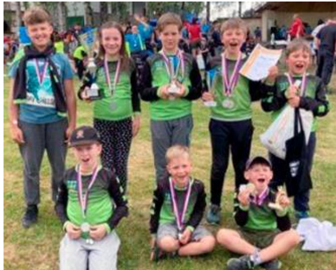
Nadšené děti s medailemi - Okresní kolo hry Plamen 2022 a Poličská pohárová soutěž