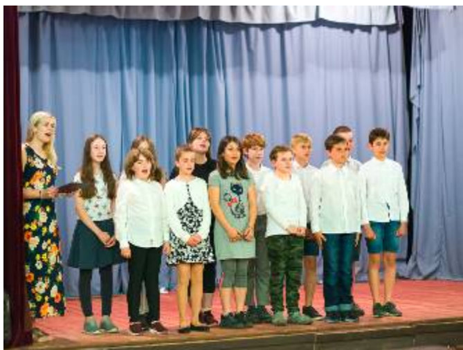
Hudební pásmo žáků 5. třídy