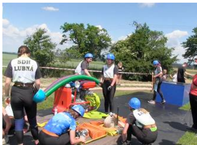
Příprava domácích týmů