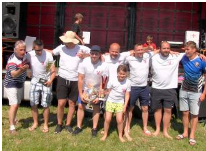
Vítězné družstvo mužů z Oldřiše se starostou obce