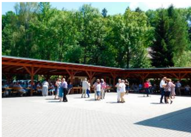
Úvodní slovo předsedy mikroregionu a pohled na taneční parket