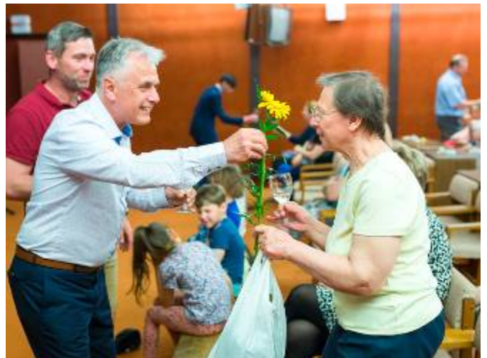
Předání kytiček ukrajinským ženám