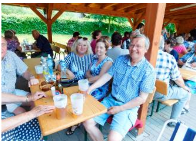
Spokojení návštěvníci akce