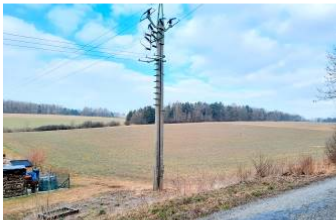
Lokalita „Na Zrnětín“ před zahájením výstavby

První etapa by měla být ukončena v září letošního roku tak, aby stavebníci mohli zahájit práce na výstavbě rodinných domů. Do současné doby je proinvestováno kolem 2.725.000 Kč.