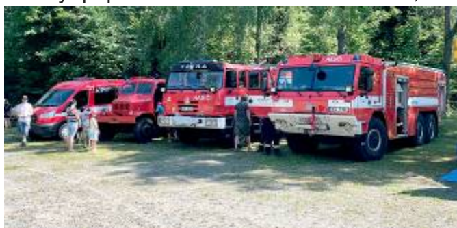
Hasičská technika v letním areálu

Po menší pauze jsme i tento rok v neděli 26. 6. 2022 uspořádali Odpoledne s hasiči. Pro děti byl připraven skákací hrad a soutěže, za které dostali menší odměny a za splnění všech disciplín pak byly oceněny medailí a velkým bublifukem. Děti si mohly prohlédnout hasičskou techniku lubenských hasičů a profesionálních hasičů z Poličky. Jelikož počasí bylo horké, byla připravena pěna na osvěžení pro děti i dospělé. Odpoledne ukončili "profíci" z Poličky proudem vody. Závěrem děkuji pořadatelům za organizaci dne a rodičům s dětmi za účast.