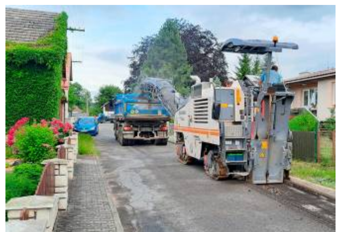
Kabelizace sítě v dolní části obce