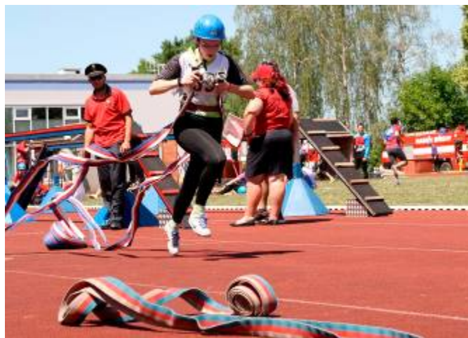
Náš tým dorostenek