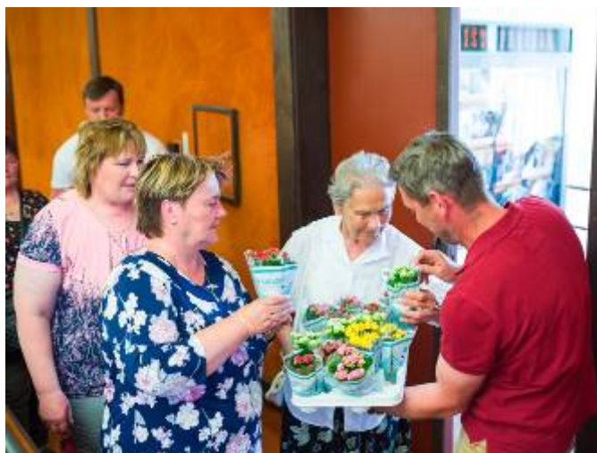
Občerstvení a malá pozornost pro naše maminky