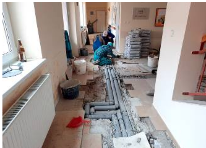
Výměna vodovodního potrubí v DPS