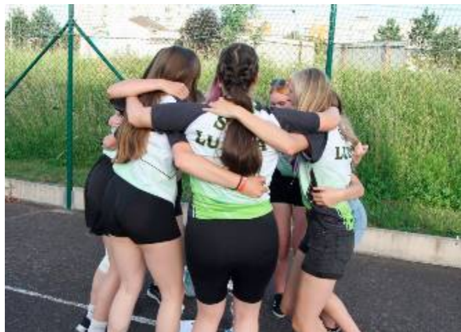
Radost z vítězství v krajském kole