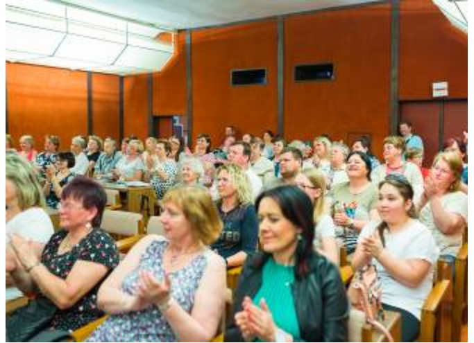
Pohled do zaplněného sálu