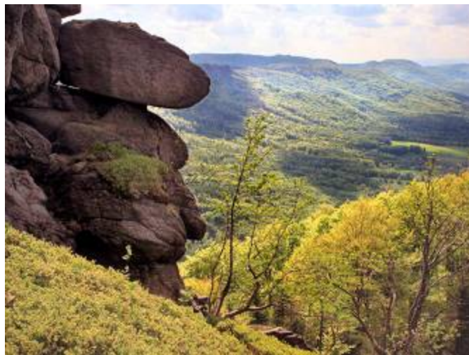
Pohled od Paličnicku na rozsáhlý komplex bučin