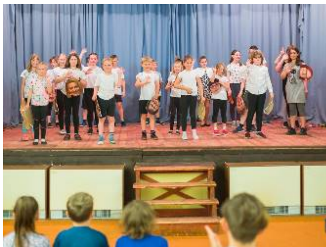
Vystoupení školní družiny se švihadly