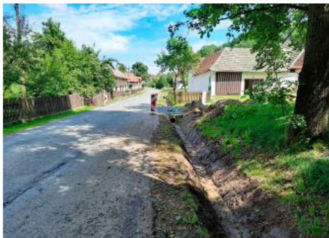
Oprava mostků a příkopu u Vopařilových