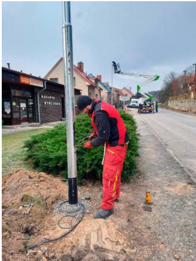
Rekonstrukce veřejného osvětlení v horní části obce