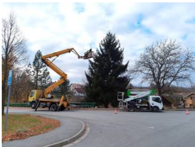
Zdobení smrku a rozsvícení vánočního stromu před obecním úřadem - sobota 27. 11. 2021

V měsíci listopadu jsme prostřednictvím firmy VAY energo, s.r.o., nově ozdobili vánoční strom před obecním úřadem. Nejprve jsme demontovali staré vánoční osvětlení. Na strom jsme instalovali LED řetěz, svítící LED koule, plastové koule a hvězdu na špičku. Náklady na vánoční osvětlení dosáhly částky přibližně 130 000 Kč.