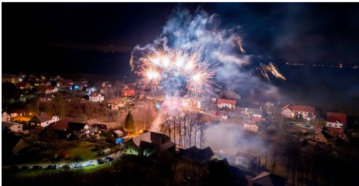
Silvestrovský ohňostroj 31.12.2019