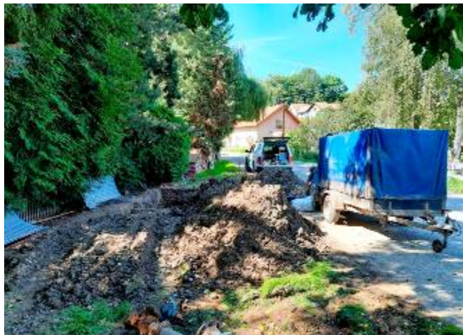
Výměna hydrantů u autobusových garáží