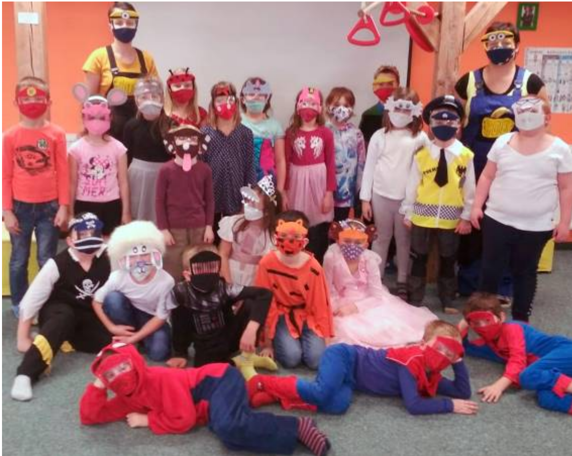
Karneval ve školní družině