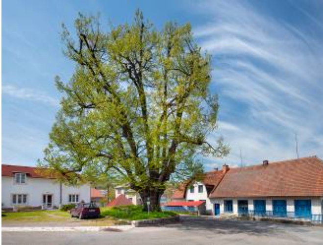
Památná lípa u Pálenice

Mohutná lípa malolistá má rozložitou korunu o šířce 25 m, je vysoká 24 m a obvod kmene v prsní výšce dosahuje 570 cm. Její stáří se odhaduje na 350 - 400 let. Za památný strom byla vyhlášena v roce 1994.