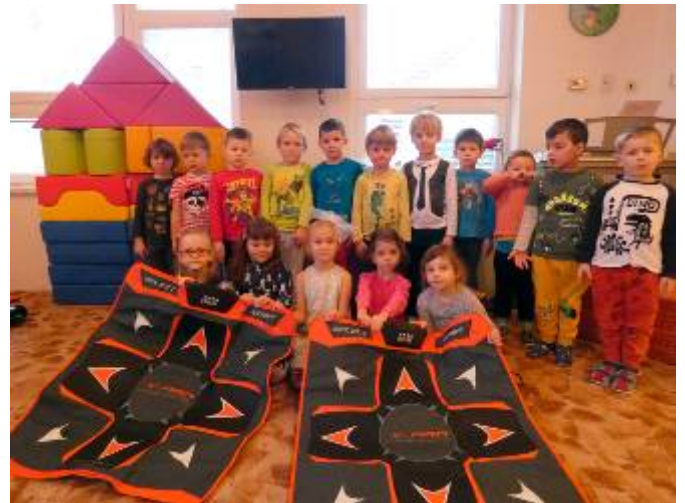
Vánoce v mateřské škole