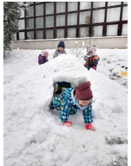
Zimní radovánky v zahradě

si jdeme s kamarády hrát. Ve velkém oddělení můžeme dokonce soutěžit v tancování na speciálních podložkách propojených k telce.