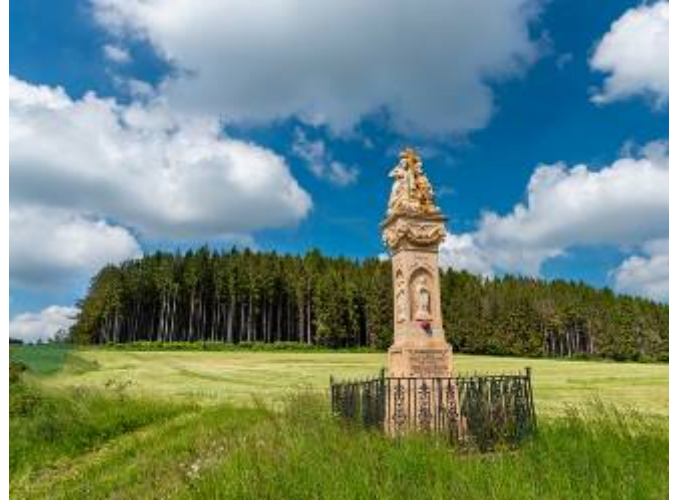
Socha Nejsvětější Trojice