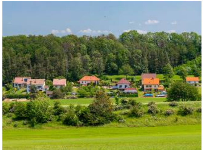
Pohled z turistické stezky a z Klikovce