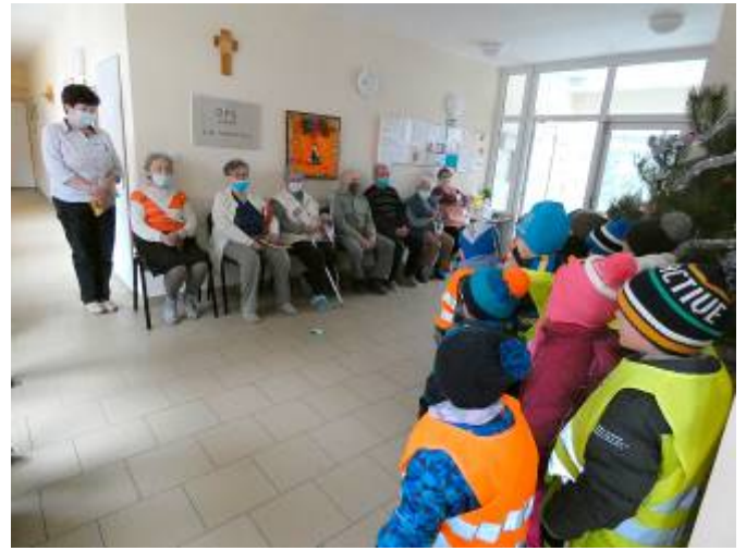
Koleda u pana starosty a v domě s pečovatelskou službou