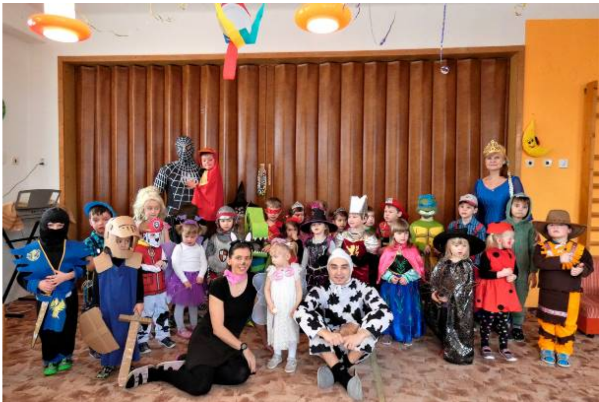
Karneval v mateřské škole