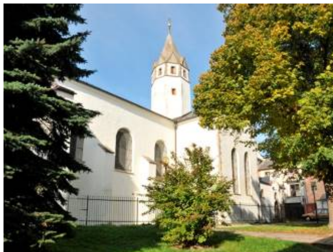
Minoritský kostel Nanebevzetí Panny Marie

Už ve 13. století byly založeny tři církevní stavby. Městský kostel sv. Jakuba byl vysvěcen v roce 1257 a jeho dvě nestejně vysoké věže tvoří jednu z dominant Jihlavy. Minoritský kostel Nanebevzetí Panny Marie (kolem roku 1250) je trojlodní bazilika, jejíž hlavní loď je sklenuta masivními cihlovými žebry. Dominikánský kostel sv. Kříže je síňové trojlodí, jehož stavba byla zahájena ve slohu cisterciácko – burgundském a dokončena ve 14. století ve stylu parlářovské