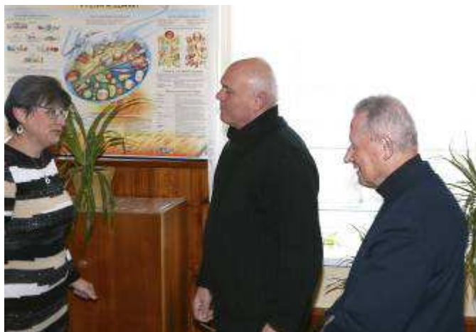
Gratulace paní ředitelce