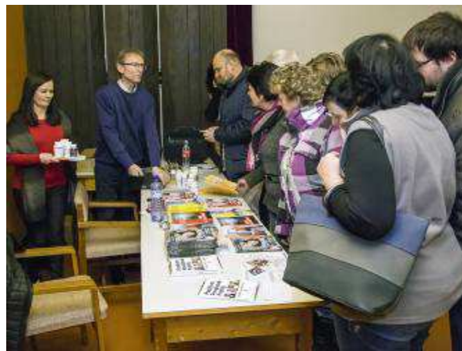
Společná fotografie a prodej knih a produktů