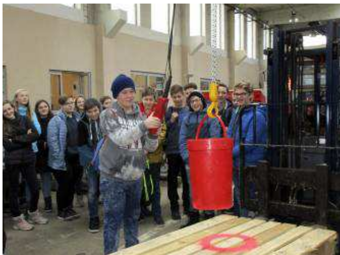
Práce s jeřábem

Ve středu 16. ledna navštívili žáci osmé třídy Střední školu zahradnickou a technickou v Litomyšli. Během exkurze se zajímavou formou seznámili s učebními obory chovatel, zahradník, mechanizace a služby, scénická a výtvarná tvorba. Soutěžili také v aranžování dekorace, návrhu zahrady, výtvarném tvoření, výměně kol osobního automobilu, poznávali cizokrajná zvířata, přesunovali předmět jeřábem.