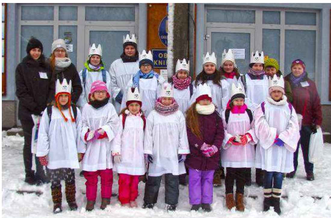
Koledníci před obecním úřadem