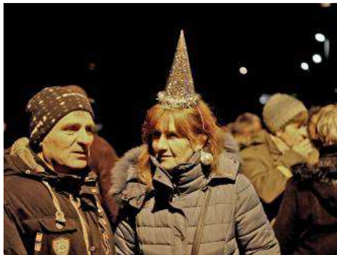
Silvestrovský ohňostroj pohledem H. Schmauze