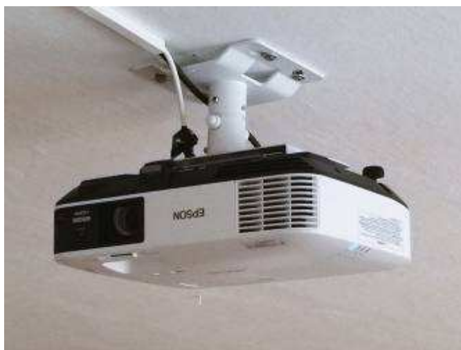
Nová tabule a dataprojektor