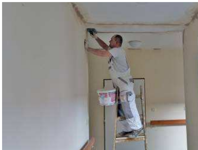
Výmalba chodeb a společných prostor