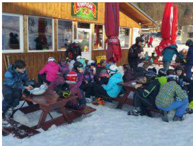
Lyžařský výcvik v Deštném v Orlických horách