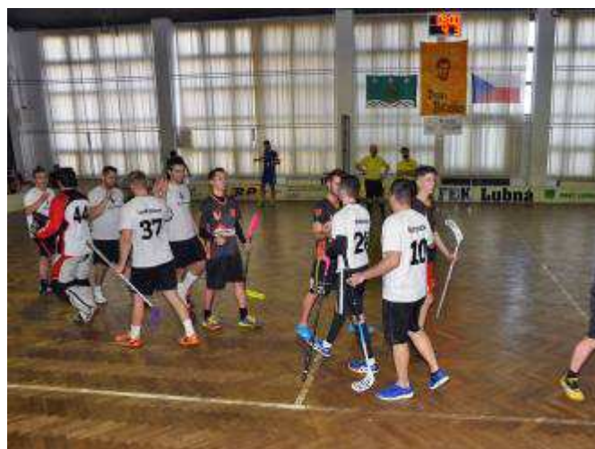
Domácí tým Bílý balet po skončení zápasu