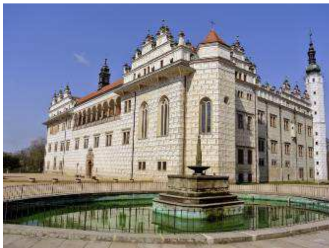
Zámek Litomyšl - památka UNESCO