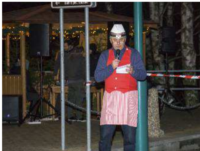
Starosta obce popřál všem přítomným