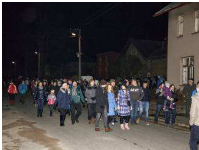
Davy návštěvníku zhlédly silvestrovský ohňostroj