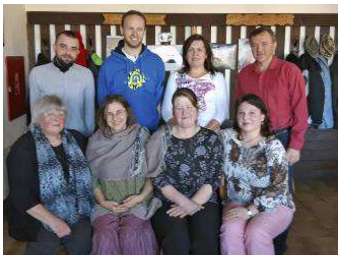
Nově zvolená předsedkyně a výbor ČZS Lubná

vidíme i slušné a poutavé výsledky činů místních zahrádkářů, jako jsou tématické výstavy, výzdoba obecního úřadu, pomoc při kulturních akcích, zájezdy a mnohé další.