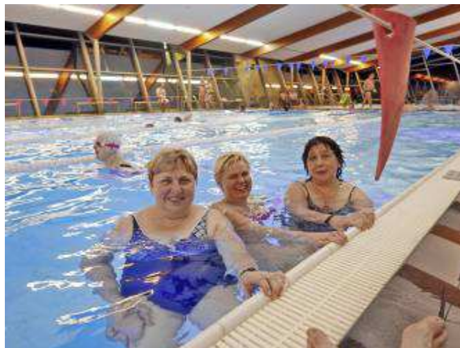
Účastníci koupání v krytém litomyšlském bazénu