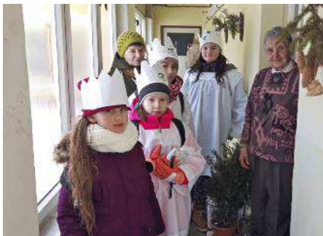
Skupinky koledníků při obchůzce v naší obci