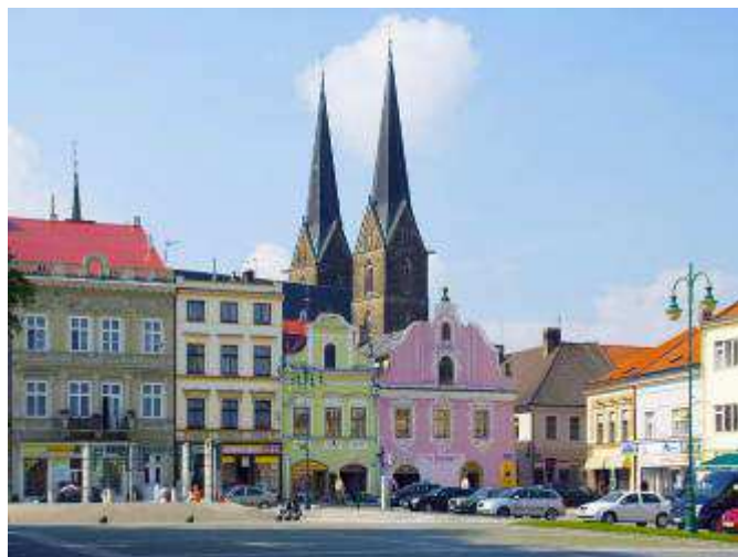
Vysoké Mýto - pohled z náměstí Přemysla Otakara II. k monumentálnímu chrámu sv. Vavřince