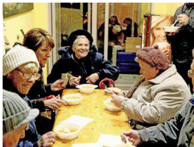
Zastupitelé při výdeji polévky a zázemí na OÚ Lubná