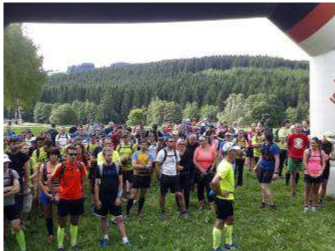
Březinská padesátka v roce 2017