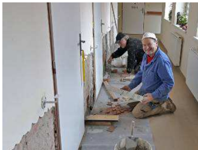
Oprava omítek na chodbě v DPS Lubná