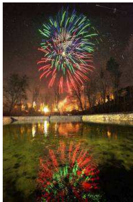
Silvestrovský ohňostroj – pohled od požární nádrže