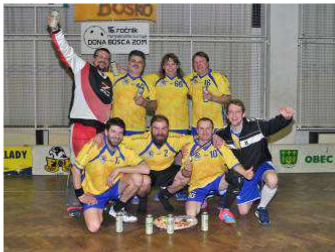
Vítězný tým veteránů- Hydra Svitavy