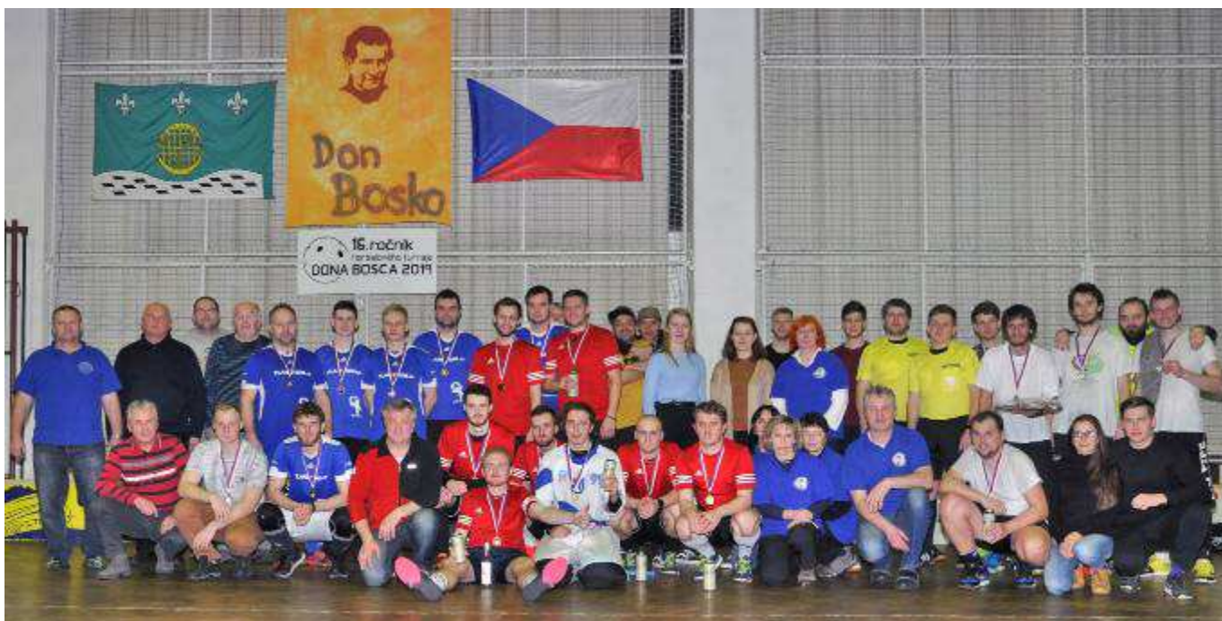
Společná fotka výherců a pořadatelů