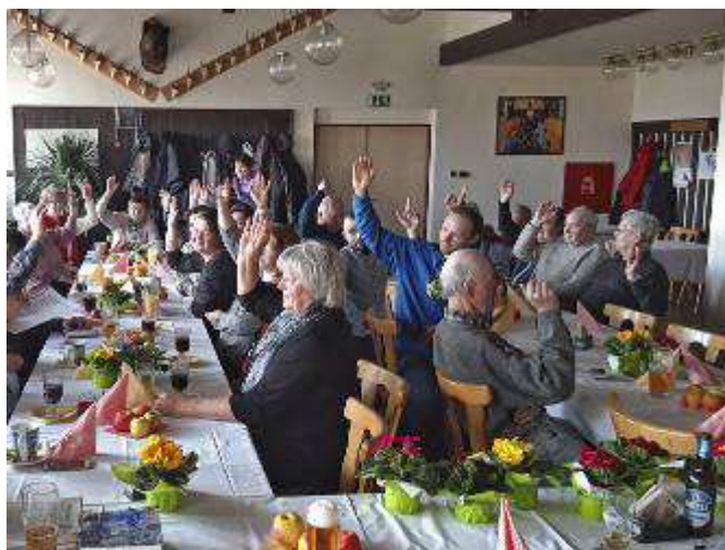
Hlasování při výroční schůzi místních zahrádkářů