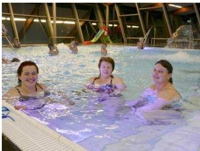
Naše mladé rodiny se svými dětmi v malém bazénu