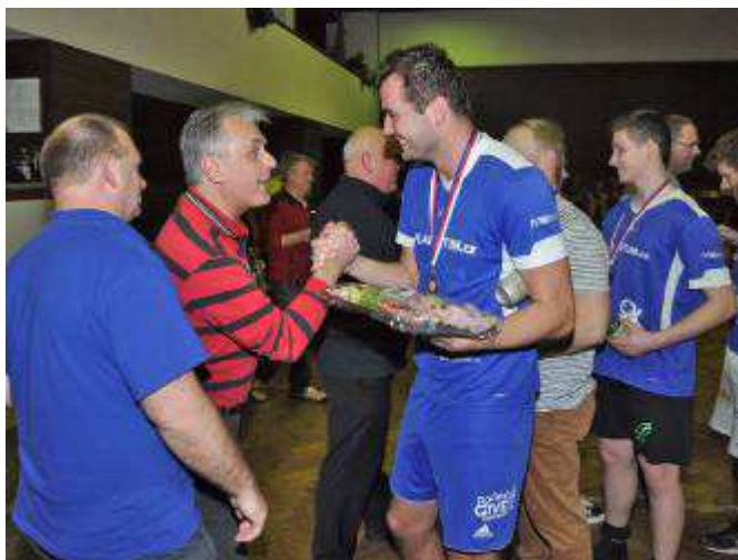
Předání cen bronzovým výhercům