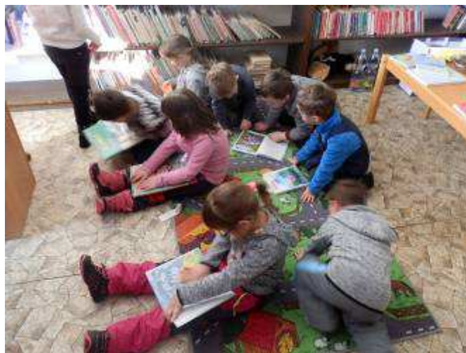
Na návštěvě v lubenské knihovně