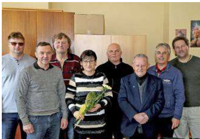
Společná fotografie v místní škole