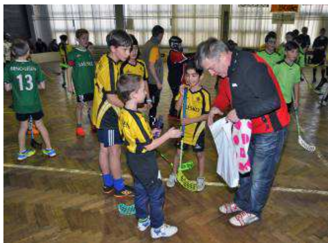
Předání cen hráčům z brněnské Líšně