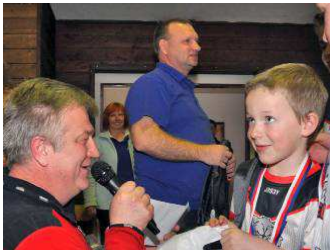
Nejmladší šestiletý hráč turnaje přebírá cenu