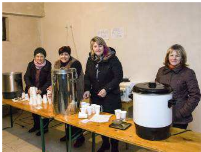
Silvestrovská polévka a svařák zahřály všechny přítomné