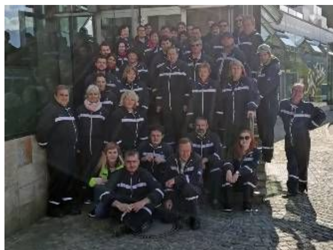
Návštěva solného dolu