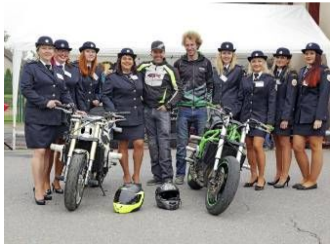
Zahájení 9. ročníku Lubenské šťopičky