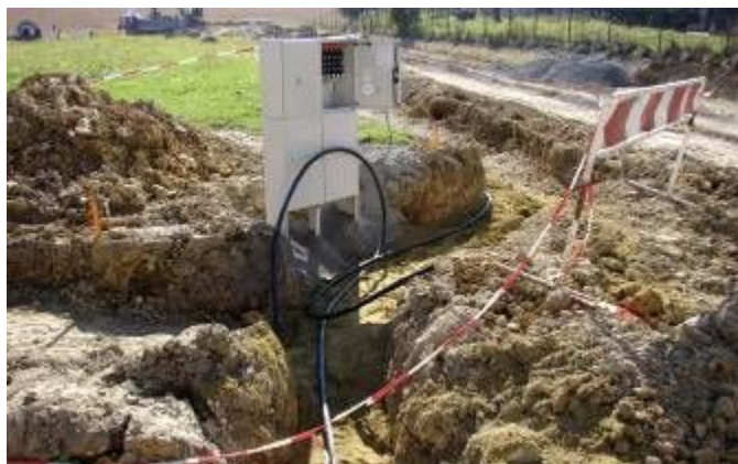
Položení rozvodů plynu a elektřiny