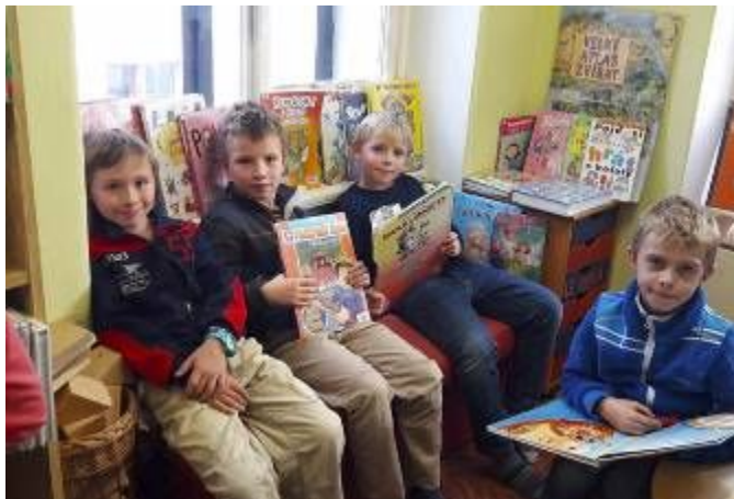
Čtenářský maraton - knihovna Litomyšl