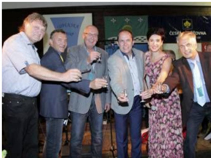
Společný přípitek hostů na Skalce