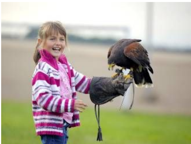
Ukázka dravců na hřišti za ZOD Lubná