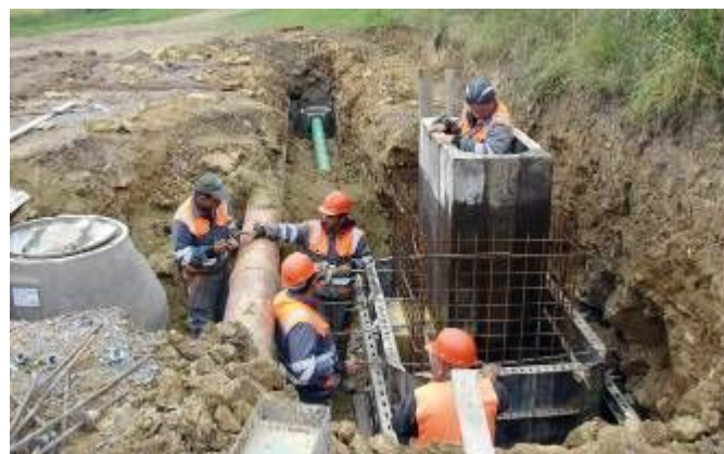
Výstavba horské vpusti