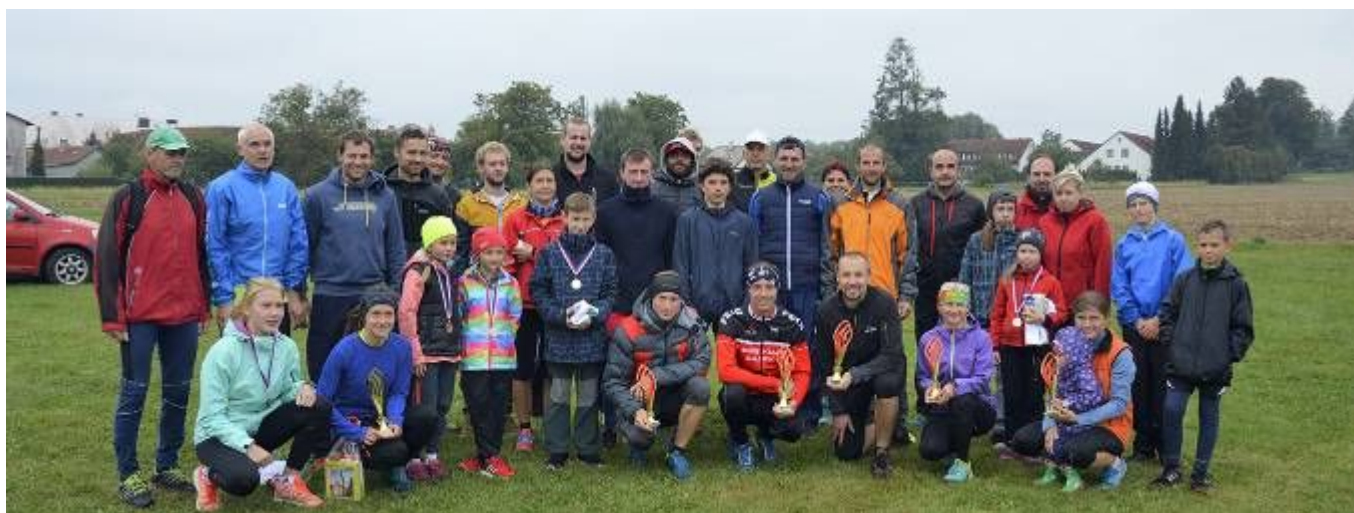
Společné foto účastníků a pořadatelů běžeckého závodu