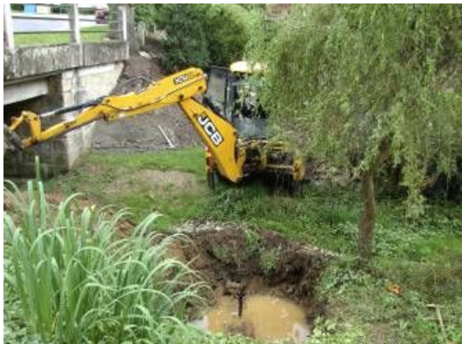
Oprava plynovodu u mostu

Během prázdnin jsme využili zájmu studentů a mládeže o práci v obci. Chlapci a děvčata se podíleli na sečení a úklidu trávy z veřejných prostranství, na pomocných pracích při výměně oken v mateřské škole, úklidu čekáren, altánků a jejich okolí a na dalších pracích ve vsi.