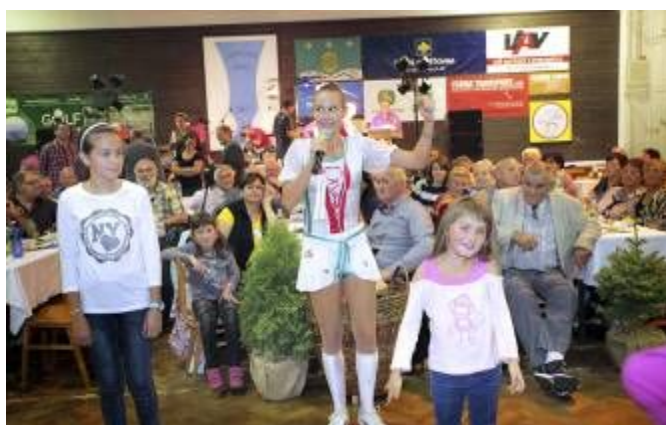
Světová rekordmanka Adrien Banhegyi, která dala švihadlu parametry olympijské disciplíny