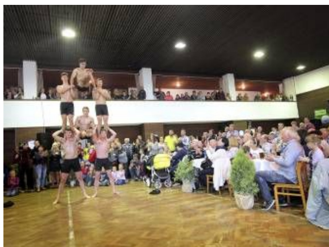
Vystoupení skupiny Five Fellas – silová gymnastika