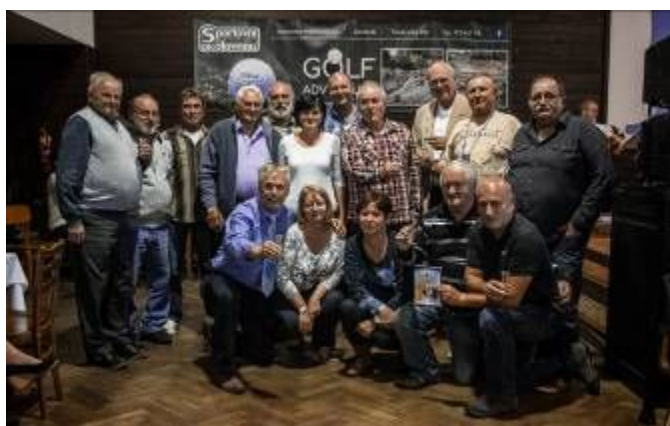
Majitelé nejlepších destilátů při společném přípitku