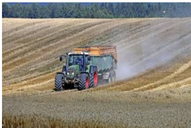
Sklizeň a odvoz obilí

V Evropě se každoročně vyhodí podle odhadu 3 miliony tun chleba. To je takové množství, kterým by se dalo zásobit celé Španělsko. V Německu je to asi 500 tisíc tun. Menší díl neprodaného starého pečiva se zpracuje (např. na strouhanku), nebo se rozdává potřebným. Další možnosti využití jsou například výroba sirupů, droždí a pálenky. Největší část (asi 87 %) jde na výrobu krmných produktů pro zvířata.