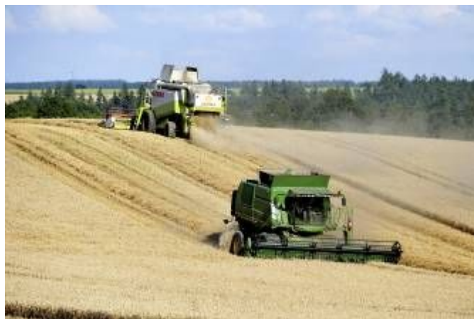
Lubenská úrodná pole