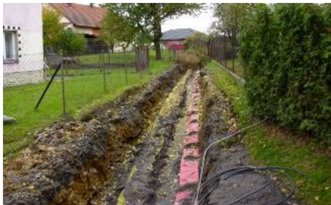
Uložení kabelů veřejného osvětlení, elektřiny, plynovodu a vodovodu