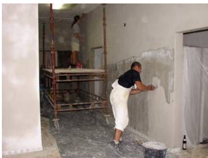
Oprava omítek a výmalba chodeb v ZŠ Lubná