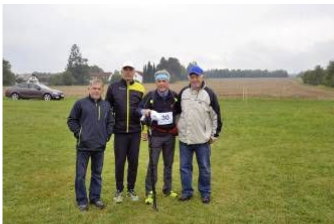
Starosta obce v cíli s pořadateli akce

Současně vyzývám Vás - Lubeňáky a Sebraňáky - pojd'te porazit starostu obce na 2. ročníku Lubenské Desítky Cross. Každý, kdo bude rychlejší, obdrží volnou vstupenku na jubilejní 10. ročník Lubenské šťopičky 2018.