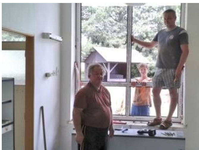
Pracovníci při výměně oken