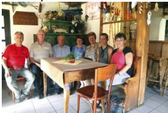
Prohlídka s pohádkovými bytostmi a společná fotografie