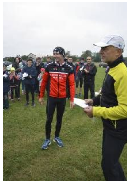
Vítězové v kategorii dětí, žen a mužů