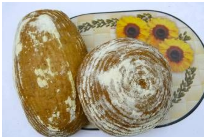
Obilné produkty a chléb náš vezdejší