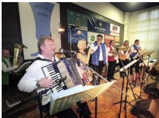
Vystoupení dechové hudby Sedmikráska