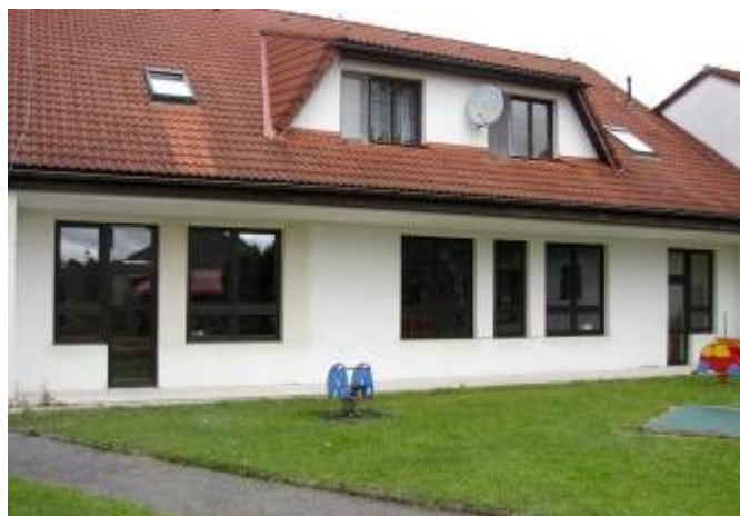
Výměna oken v MŠ Lubná