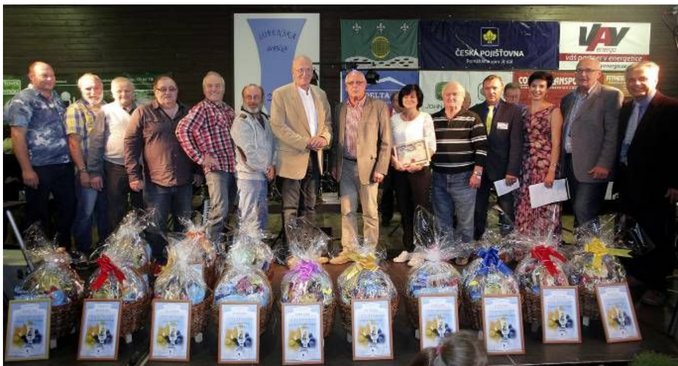
Vyhlášení nejlepších destilátů