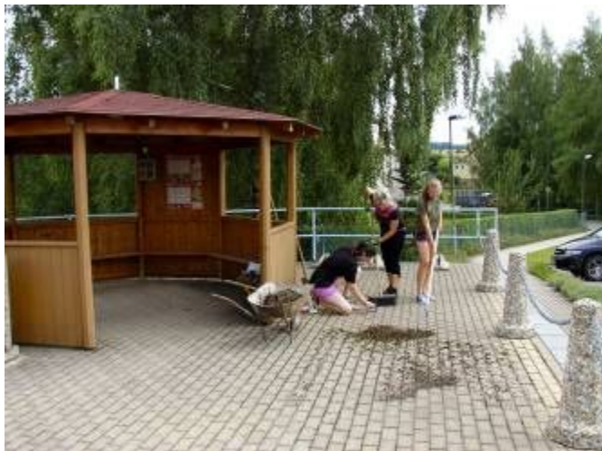
Brigádnice při úklidu prostranství