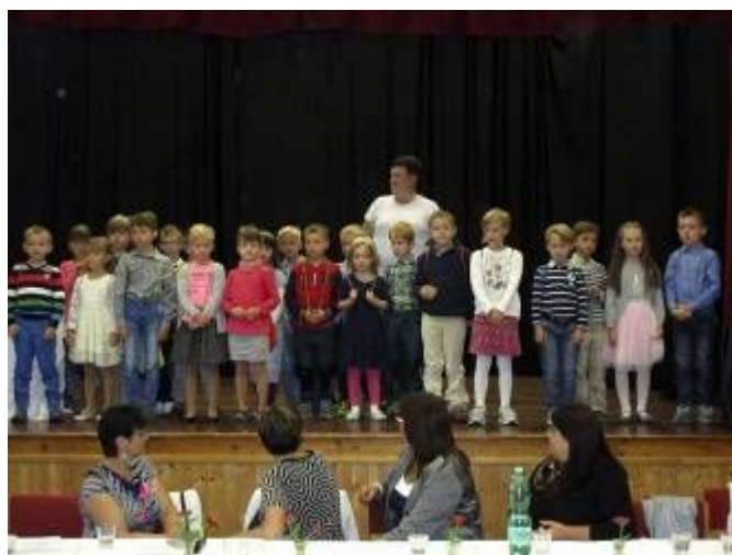
Zahájení školního roku a přivítání prvňáčků