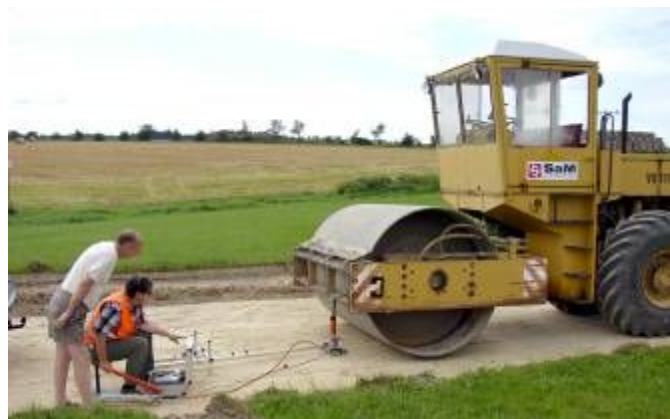
Hutnící zkouška na nové komunikaci