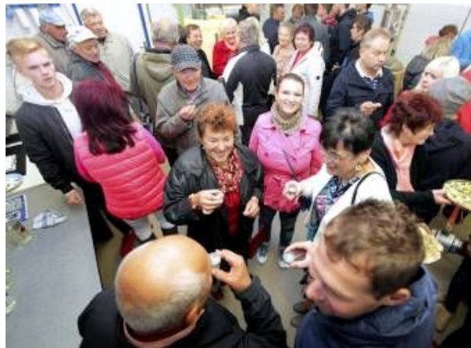
Návštěva lubenské Pálenice