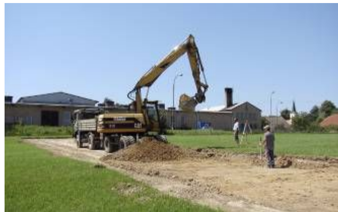
Skrývka zeminy z místní komunikace a chodníku