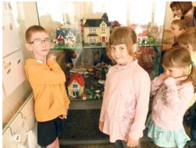
Na návštěvě v poličském muzeu