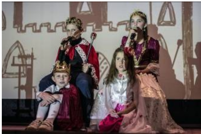
Šípková Růženka - všechno dobře dopadlo