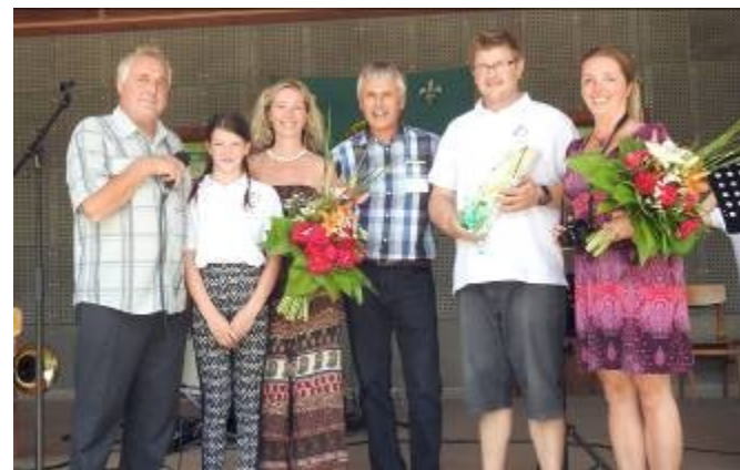
Vystoupení a poděkování ZUŠ Bystře