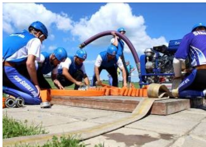
Družstvo Lubné a Širokého Dolu