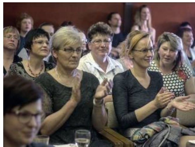
Pohled do hlediště