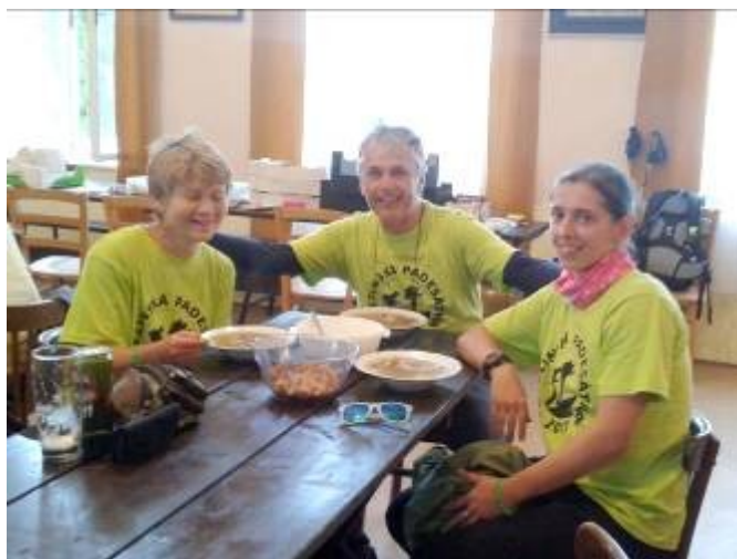
Vytoužený cíl závodu spojený s drobným občerstvením