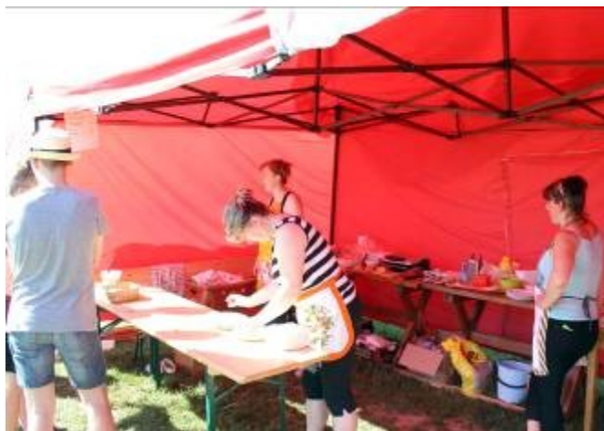
Společná porada a pořadatelé v akci