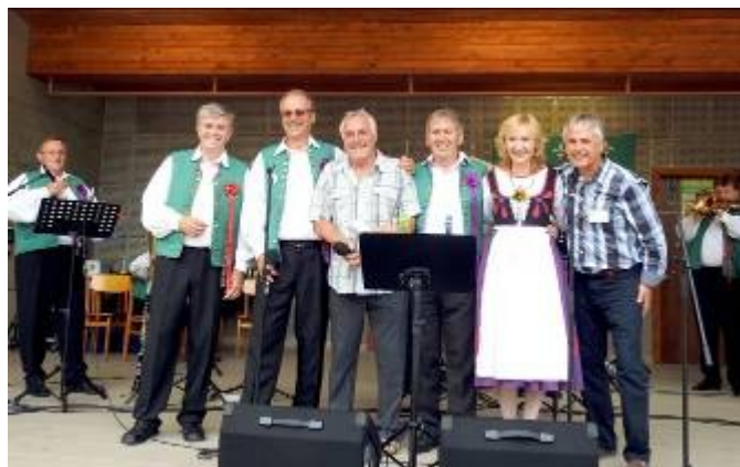
Dechová hudba Krajanka