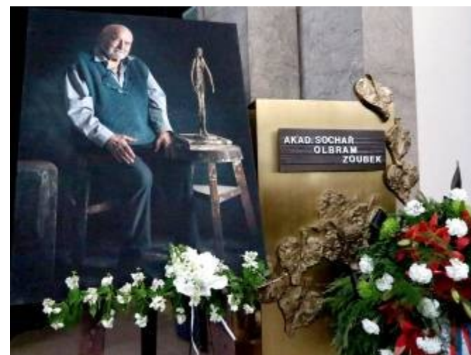
Rozloučení ve strašnickém krematoriu v Praze