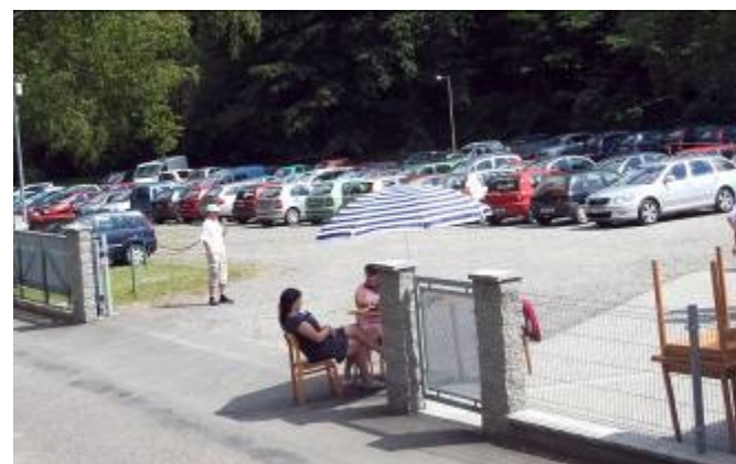
Zázemí občerstvení a parkování automobilů v areálu