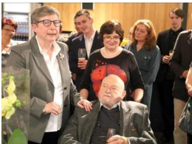
Mistr při oslavě svých kulatin