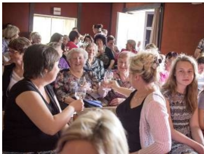
Přivítání maminek v sále kina