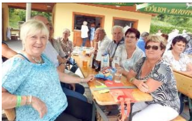
Pohled na posluchače dechovky