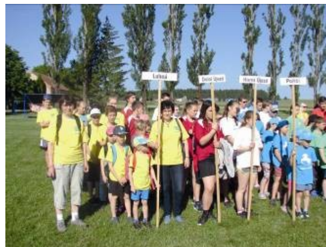
Účastníci a pořadatelé dětského dne v Desné

V pátek 2. června se uskutečnil v obci Desná Den dětí Mikroregionu Litomyšlsko – Desinka. Účastnily se ho děti ze 13 obcí celého mikroregionu. Organizátoři z pořádající obce pro nás připravili zajímavé disciplíny. V kategorii mladších žáků z prvního stupně základní školy vyhrála Vidlatá Seč, druhé místo obsadili žáci z Lubné a na třetím místě skončili školáci z Osíka. V kategorii starších žáků z druhého stupně základní školy zvítězili žáci z pořádající obce