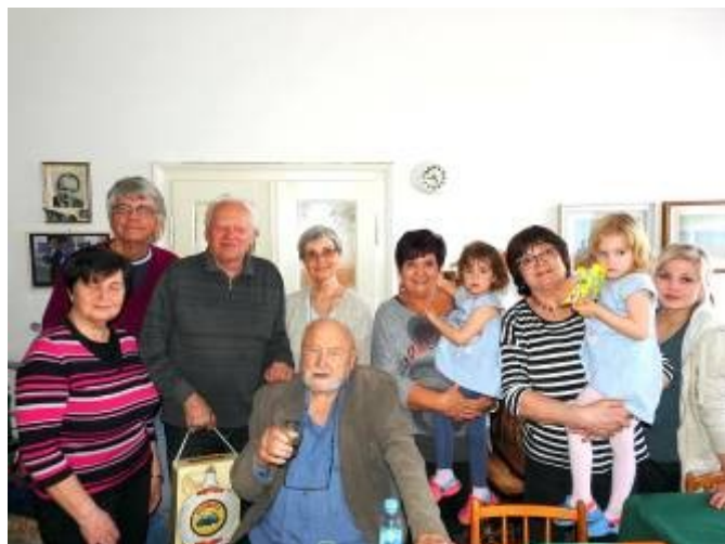
Akad. sochař na setkání rodáků a s rodinou v Lubné