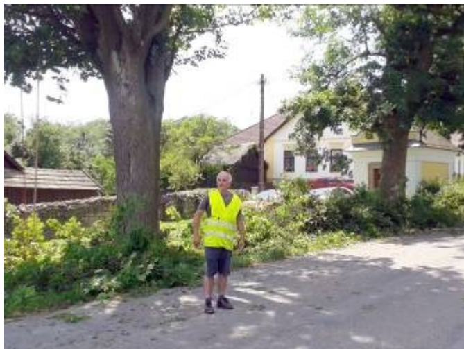
Prořezávka stromů u školy