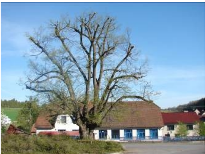
Ošetření památné lípy u Pálenice