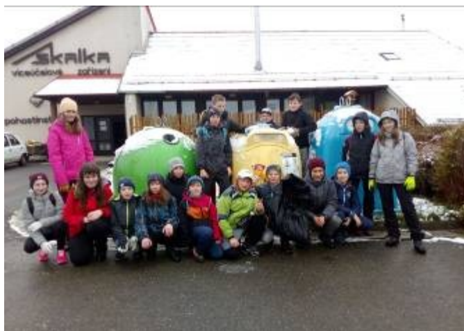
Žáci 2. stupně ZŠ při sběru odpadů