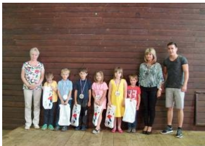
Rozloučení s dětmi z MŠ Lubná