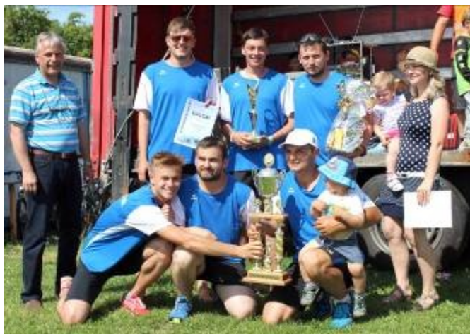
Vítězné družstvo žen z Desné a mužů ze Širokého Dolu