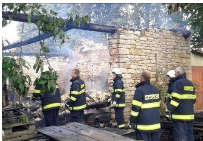
Jednotka SDH Lubná při likvidaci požáru