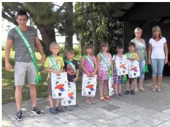
Ukončení školního roku na zahradě mateřské školy