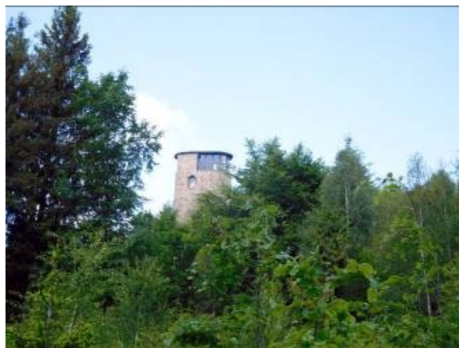
Zámek Buchlovice a rozhledna Brdo