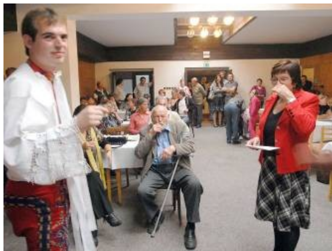
Pan O. Zoubek v Pálenici a na Lubenské št'opičce