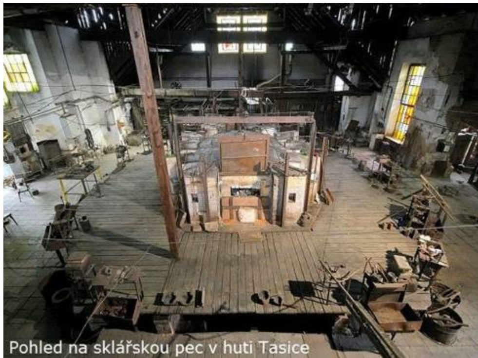
Pohled na sklářskou pec v huti Tasice