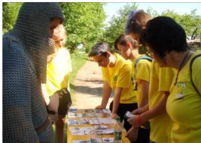
Žáci naší školy při poznávací soutěži