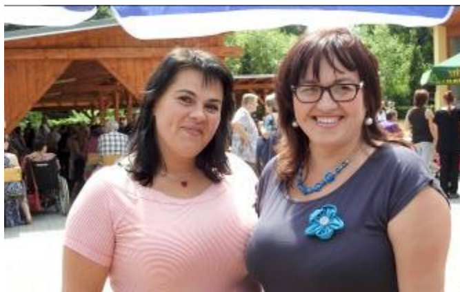
Pořadatelky při prodeji vstupenek