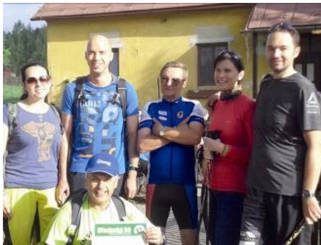
Před startem s kamarády a přáteli