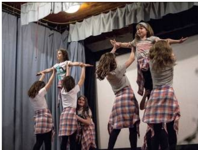
Vystoupení skupiny Hendies