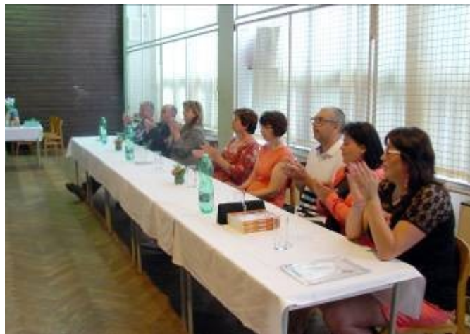
Učitelé a hosté při slavnostním ukončení školního roku