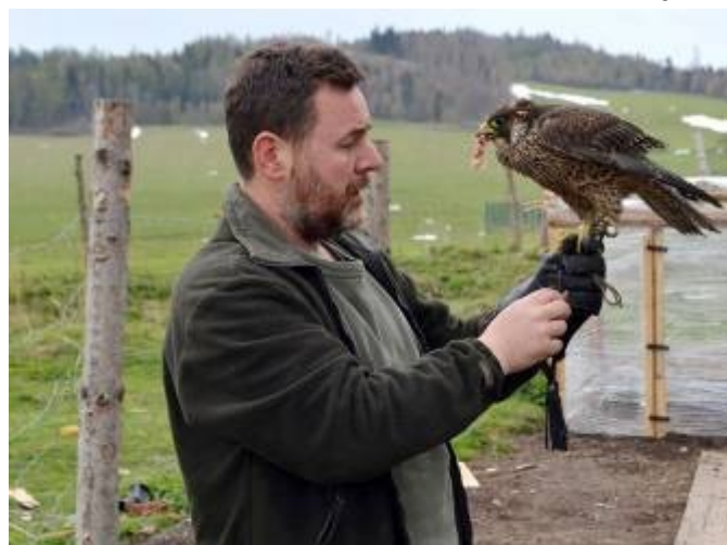
Krmení dravce na pěsti