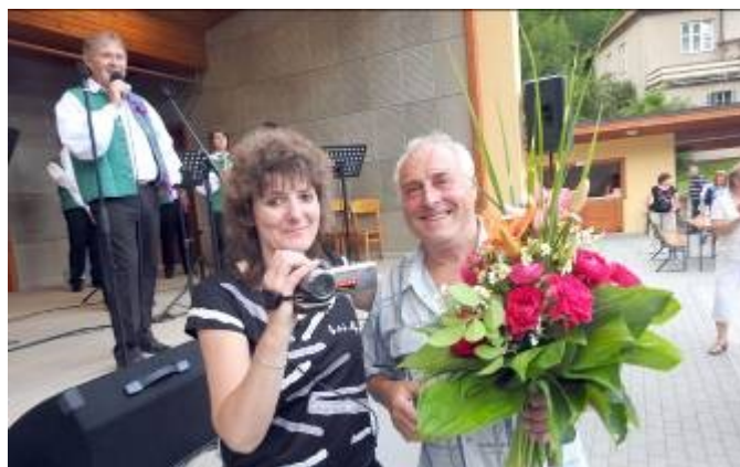
Poděkování pořadatelům a kameramanům akce