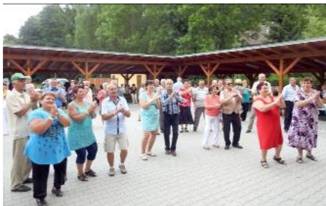
Zaplňený taneční parket