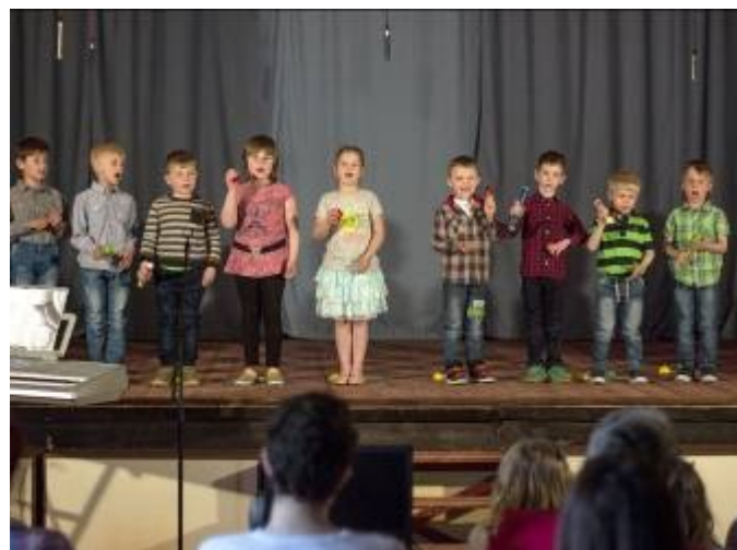
Vystoupení dětí z MŠ Lubná