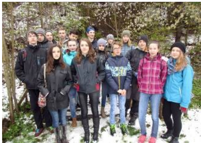
9. a 8. třída při úklidu