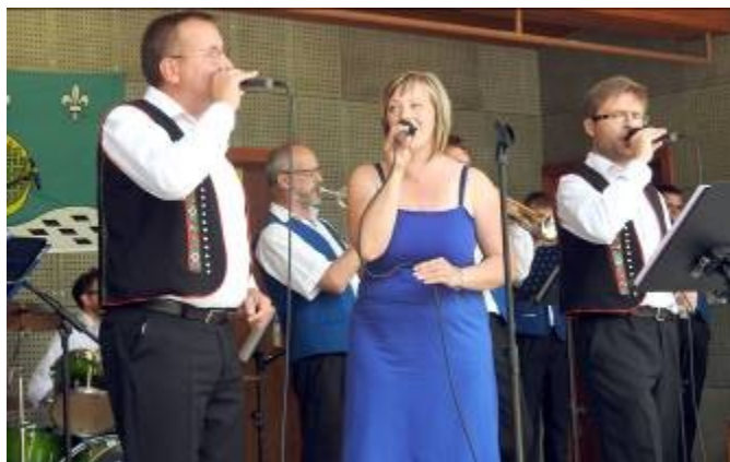
Dechová hudba Šeucovská muzika a Astra Svitavy