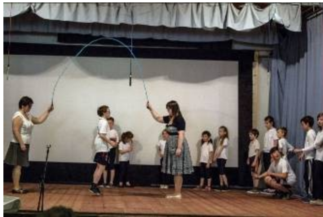
Rope skipping - naši úžasní skokani