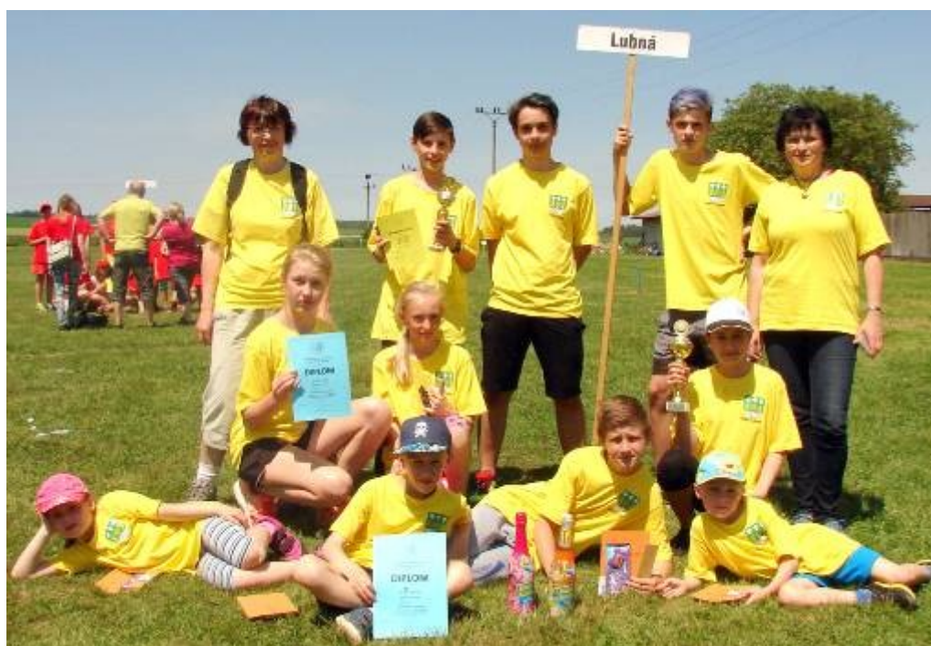
Lubná - starší žáci - 3. místo, mladší žáci - 2. místo