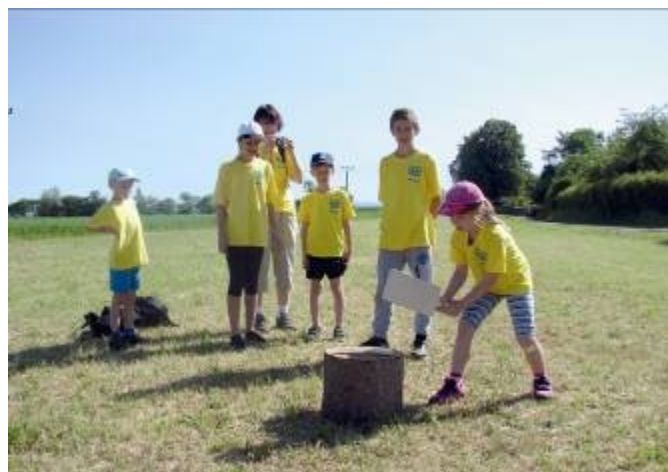
Soutěžila i paní ředitelka naší školy