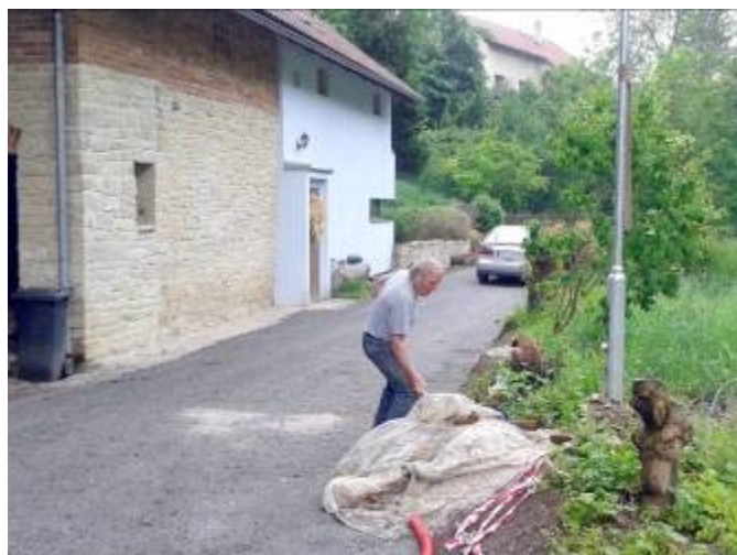
Oprava cesty a osvětlení ve střední části obce