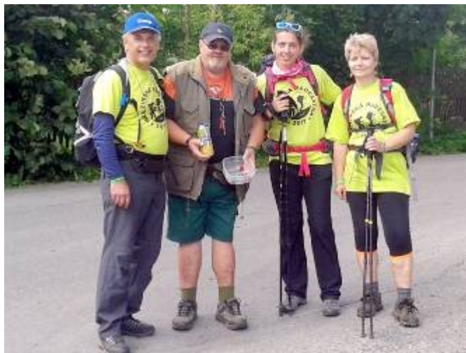
Občerstvení ve Sněžném