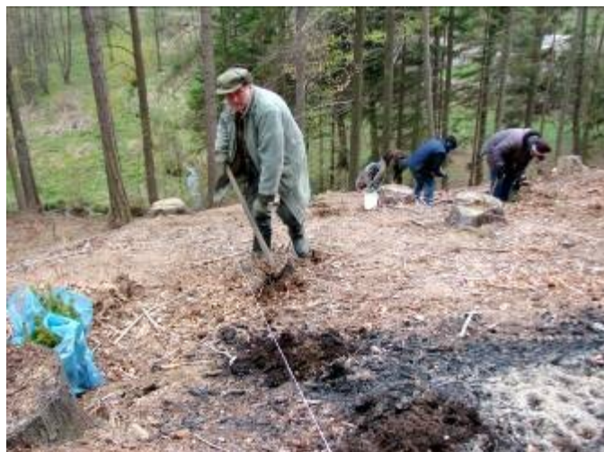
Pracovníci při výsadbě stromků