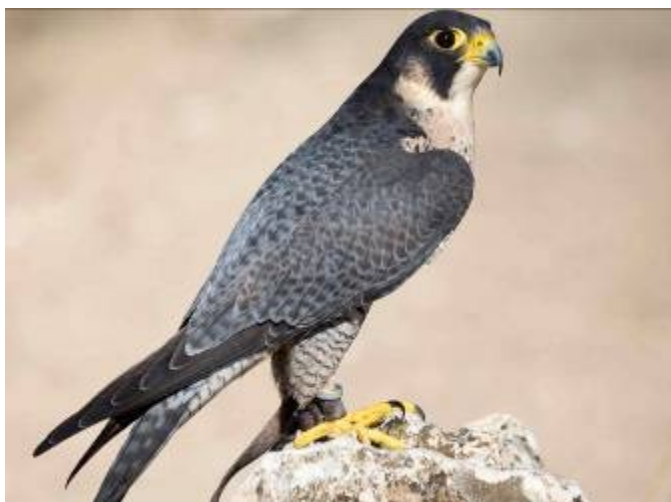
Nejvyužívanější dravec - sokol stěhovavý