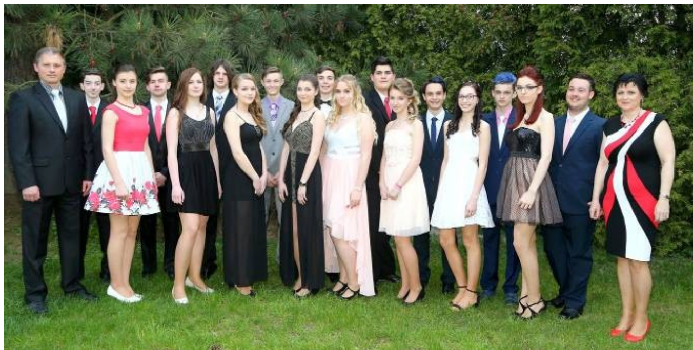
Žáci 9. třídy s třídním učitelem a ředitelkou školy