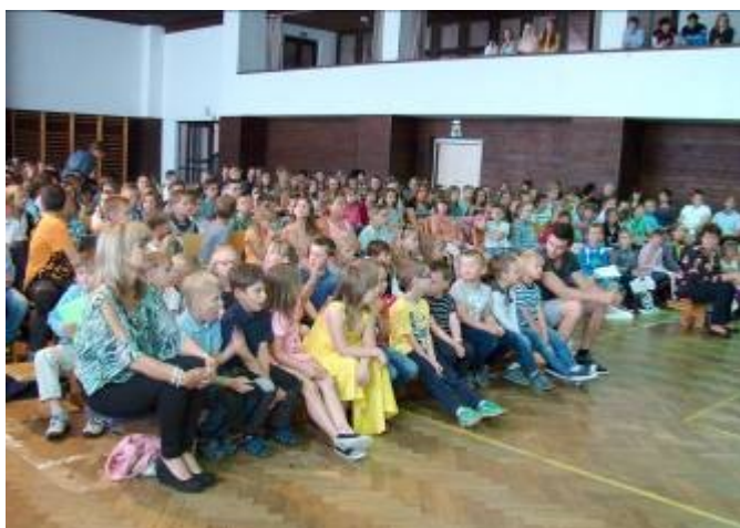
Pohled do sálu