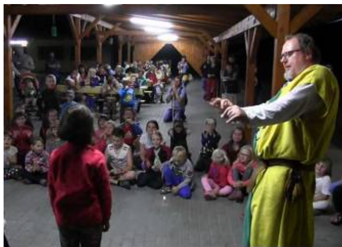
Kočovné divadlo poutníka Hrocha z Prahy

V pátek 16. 9. 2016 se jako každoročně uskutečnil tradiční lampiónový průvod. V letním areálu jsme přivítali KOČOVNÉ DIVADLO POUTNÍKA HROCHA Z PRAHY. Velkým i malým zahráli pohádku a děti si mohly zastřílet na dětské kušové střelnici. Poté, co se sešeřilo, se průvod vydal stezkou k hasičské zbrojnici, potom k OÚ a dále po Malé Straně zpět do areálu. Zde byla připravena ještě jedna pohádka. Pro malé i velké bylo po celou dobu připraveno bohaté občerstvení, které nachystali členové kulturní komise, kterým tímto děkuji. Každý lampión byl odměněn. Přesto, že nám počasí letos opravdu přálo, se dětí sešlo o něco méně než v minulých letech. I tak si myslím, že si všichni páteční podvečer užili, a už teď se těšíme na další průvod.