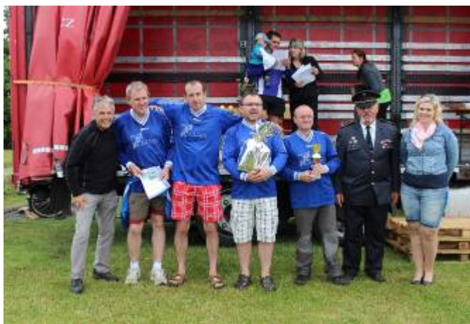
SDH Široký Důl – 1. místo – kategorie veteráni