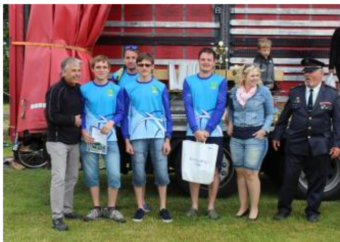
Družstvo děvčat a mužů SDH Lubná