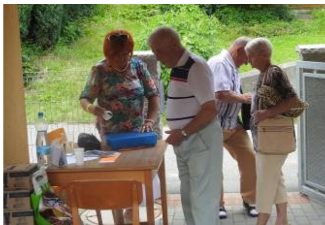
Vstup do letního areálu