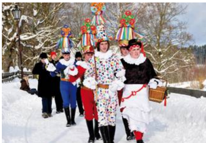
Strakatý a ženuška jdou vždy v čele průvodu

Masopust je období, které začíná po svátku Tří králů (6. ledna) a končí v úterý před Popeleční středou, která je začátkem 40denního půstu před Velikonocemi. Velikonoce jsou pohyblivé svátky a začínají vždy první nedělí po prvním jarním úplňku, to znamená, že mohou být od 21. března do 24. dubna. Tedy i období masopustu je různě dlouhé. Čím byl masopust kratší, tím bývalo na vesnicích veseleji. Konaly se plesy, zábavy, svatby, nejrůznější sousedská a rodinná setkání, dralo se peří se zpíváním a vyprávěním, byly zabíjačky a vše bylo zakončeno o vostatcích veselým a často velmi rozpuštěným průvodem masopustních masek.