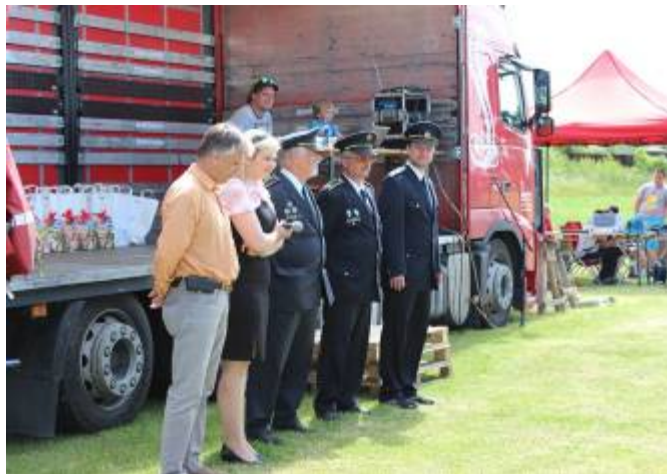
Nástup soutěžních družstev a zahájení soutěže