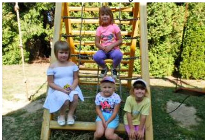
Na zahradě v mateřské škole