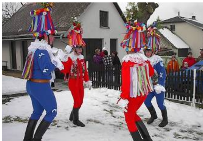
Taneční kolečko turků z Vortové