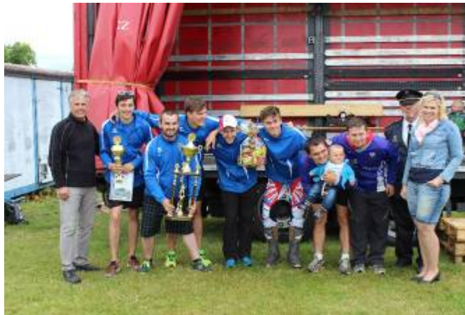
SDH Široký Důl – 1. místo – kategorie muži