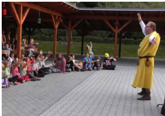
Střelba z kuše a divadelní vystoupení