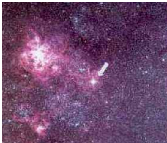
Detail odhozené hvězdné obálky