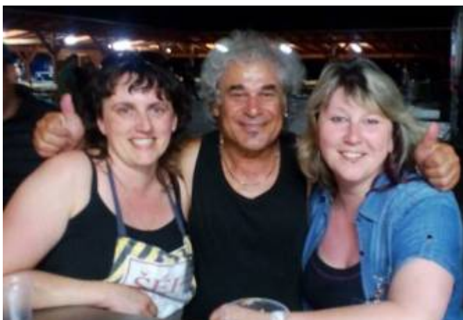
Lubenské hasičky s bubeníkem skupiny Turbo