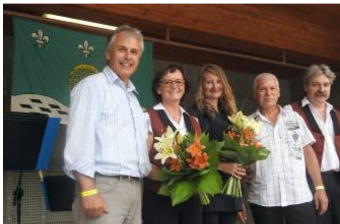
Dechová hudba Poličanka a poděkování