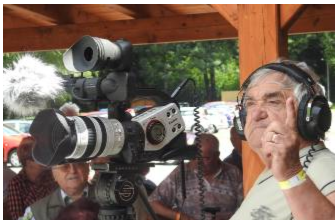
Zvukař a kameraman v akci