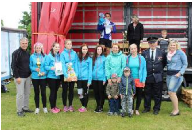
SDH Desná – 1. místo – kategorie ženy