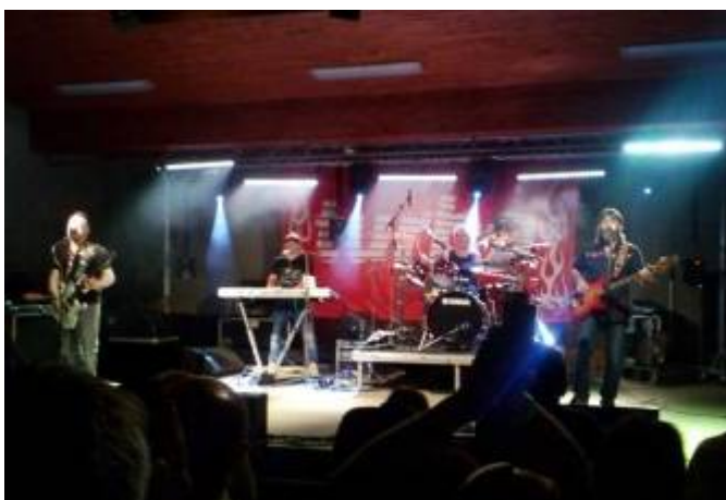
Vystoupení skupiny Galileo a Turbo

Se startovním číslem 1 zahájilo závod družstvo domácích mužů, kteří v konečném pořadí obsadili 15. místo s časem 20,43 s. Putovní pohár, po dvouletém držení mužů z Míchova (okres Blansko), si odvezli muži ze Širokého Dolu, kteří jako jediní dostali svůj čas pod 17 vteřin (16,99 s), a tak se nám pohár vrátil zpět do svitavského okresu. Po mužích následovala kategorie veteránů, kde 1. místo také brali muži ze Širokého Dolu s časem 16,24 s. A co by to bylo za lubenskou soutěž bez pár kapek deště? Tentokrát těch kapek bylo dost a pár blesků k tomu. Po odběhnutí 3 týmů žen se nám pěkně rozpršelo, závod byl na pár minut přerušen a další soutěžní týmy se musely porvat s těmito nepříznivými podmínkami. Kapky deště přinesly štěstí ženám z Desné, které zvítězily s časem 17,98 s. Domácí děvčata se umístila na 8. místě s časem 22,96 s.