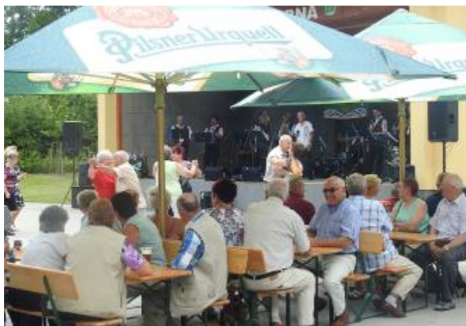
Jako první vystoupila hudba Poličanka