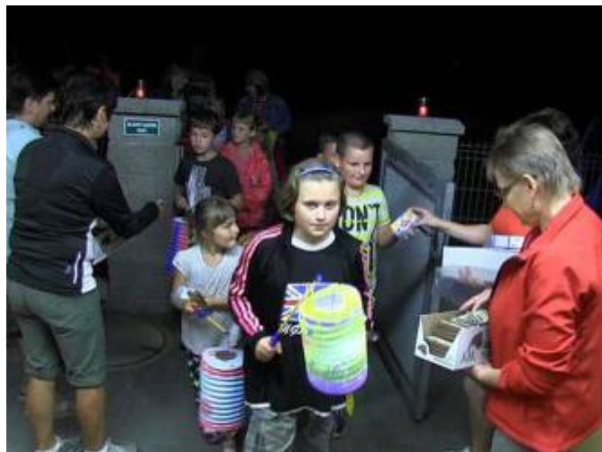
Lampiónový průvod a sladká odměna