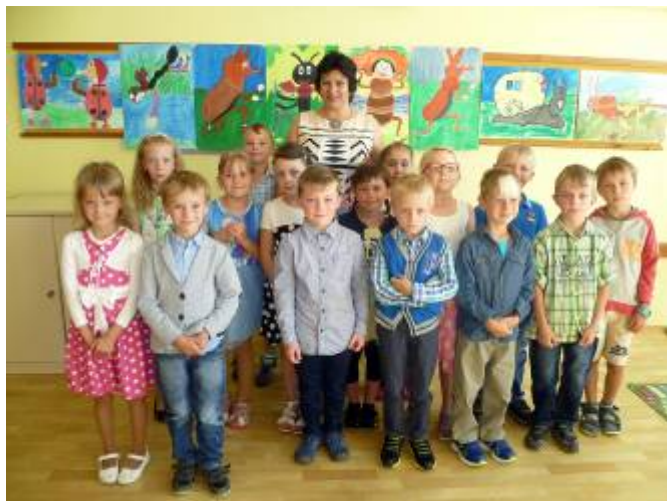
Žáci s třídní učitelkou