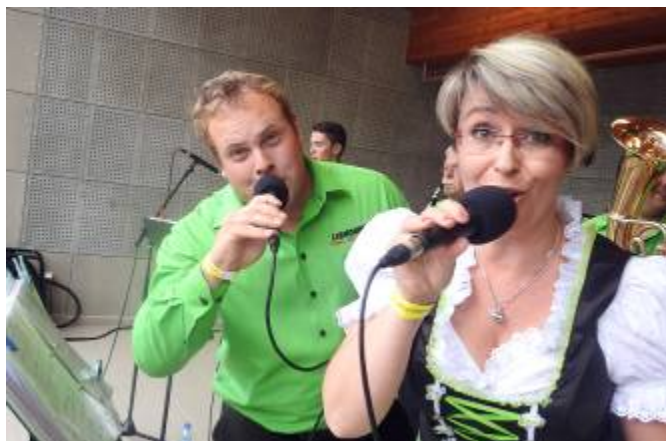
Vystoupení dechové hudby Libkovanka