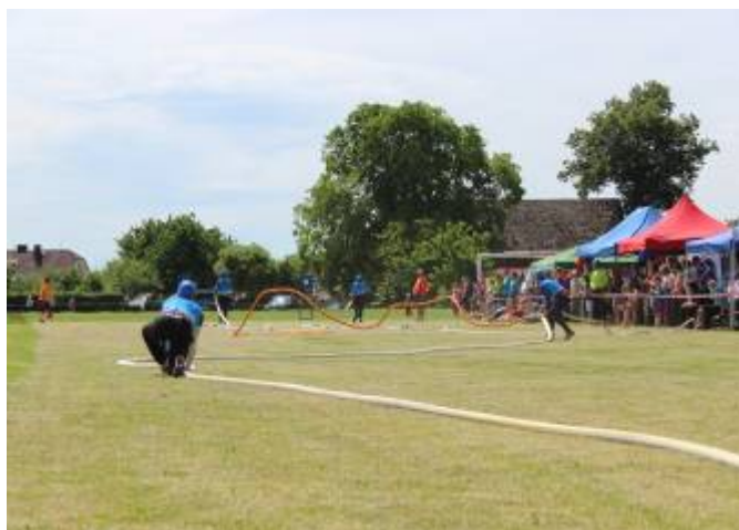
Příprava základny a lubenští muži v akci