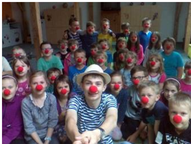
Společné foto v Lubné a v Sebranicích