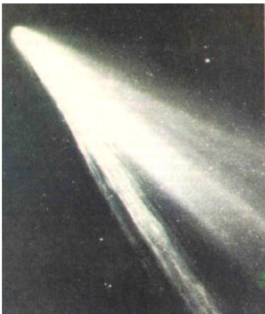
Jedna z nejkrásnějších vlasatic, která nás ve 20. století navštívila - kometa West 1976 VI. Byla ke spatření pouhýma očima mnohem lépe než Halleyova kometa při posledním návratu.

kteřá sahá do vzdálenosti několika set tisíc km. Při každém průletu okolo Slunce ztratí kometa 5 promile své hmotnosti. V naší sluneční soustavě jsou miliardy komet a dostávají jména podle svých objevitelů.