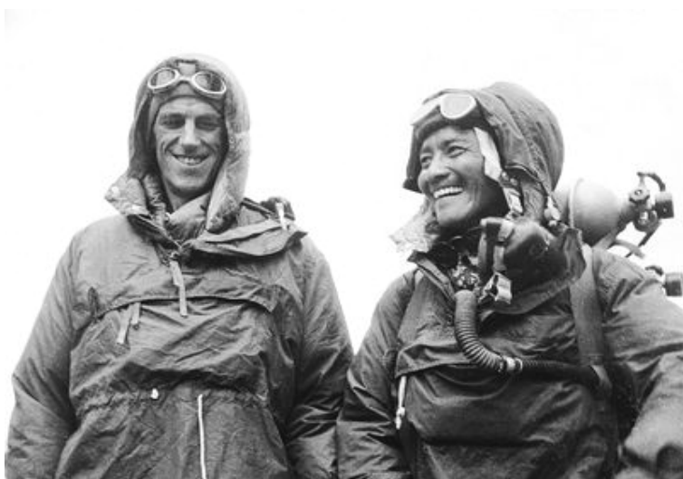
Sardar Tenzing Norkej a Edmund P. Hillary (vlevo) na snímku z června 1953.

nepálsky Sagarmatha) vystoupil jako první pozemšťan na tento nejvyšší štít naší planety, vysoký 8 848 m. Až na vrchol jej doprovázel nepálský šerpa Sardar Tenzing Norkej. Oba stanuli na střeše světa 29. května roku 1953. Hillary vystoupil na mnoho dalších světových hor, z toho deset bylo himalájských.