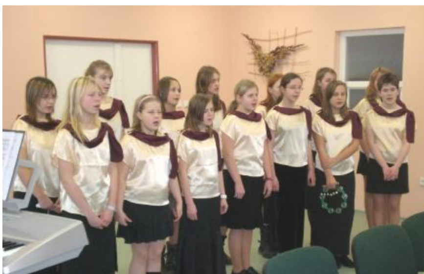
Vystoupení Lubeniky v DPS.