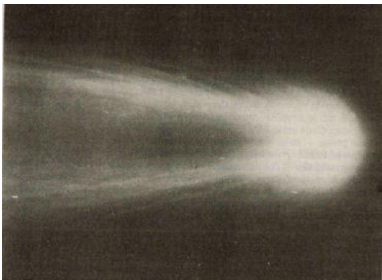
Jeden z nejlepších snímků Halleyovy komety, který byl pořízen při jejím návratu do přísluní v roce 1910. 23. května takto zachytili hlavu komety astrologové v Heluanu v Egyptě.

Nejznámějším vesmírným smetím jsou ale komety. Jejich jádra jsou slepena z prachu a ledu, mají různý tvar, nejvíce se podobají „bramborům“, více či méně protáhlým. Jádra komet mají v průměru okolo 10 km a jejich hmotnost je asi 100 miliard tun. Na jejich povrchu jsou nejrůznější vyvýšeniny, údolí a krátery. Komety se otáčejí kolem své osy. Okolo Slunce obíhají po extrémně dlouhých eliptických drahách, když mu jsou nejbližší, jde o desítky nebo stovky miliónů km, když nejdále, jedná se o několik miliard km. Také rozdíl v rychlosti komety je velmi dramatický, je-li u Slunce, pohybuje se rychlostí okolo 50 km za sekundu, když je na opačné straně elipsy, její rychlost je necelý kilometr za sekundu. Když je kometa blízko Slunce, začnou se působením tepla z jejího povrchu uvolňovat desítky tun prachu a vodní páry a za kometou se rozprostře zářivě jasná a dlouhá vlečka,