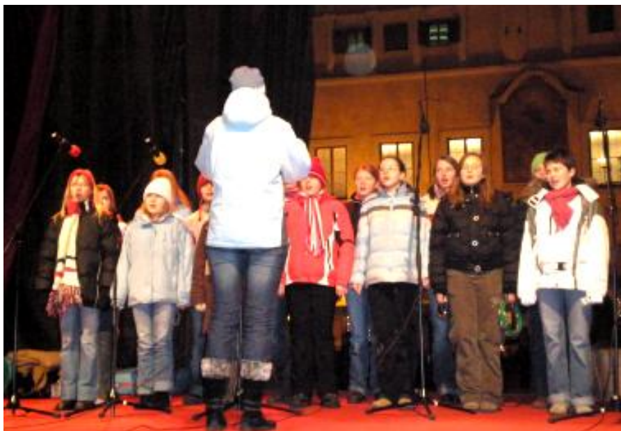
Lubenika zpívala 17. prosince na Staroměstském náměstí v Praze.

DPS v Lubné a toho, že se nám podařilo uspořádat 19. prosince vánoční koncert, spojený s promítáním fotografií z našich vystoupení.