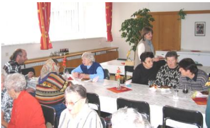
Návštěva DPS v Poličce.

V pátek 30. listopadu jsme se opět jeli podívat do Poličky, tentokrát však na vánoční výstavu