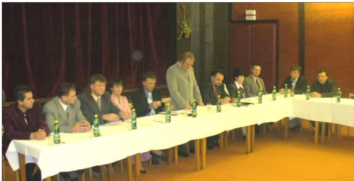
Ustavující zasedání zastupitelstva obce Lubná 7. 11. 2006

Vážení přítomní, dámy a pánové, drazí občané, na závěr dnešního zasedání děkuji členům zastupitelstva za důvěru, kterou mi dali tím, že mě