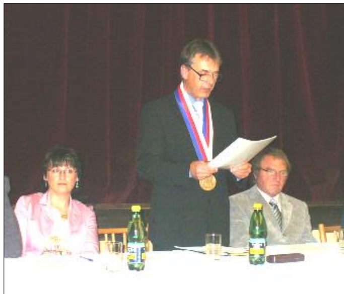
Projev starosty obce.

Vážení přítomní, drazí občané, v posledních dnech či týdnech při setkání s vámi se mi často stává, že mi sdělujete nápady, náměty, poznatky, co by se dalo v naší obci ještě vyřešit. Váš přístup a důvěra k mé osobě mě upřímně těší a povzbuzuje do další práce. Ale současně musím konstatovat, že tak jako zastupitel má při hlasování jeden hlas, tak je to i se starostou obce. Tím vám chci říci, že o věcech týkajících se naší obce a našich občanů bude rozhodovat celé zastupitelstvo a ne jenom já, jako starosta obce. A tak by to mělo být i v rozvoji naší vesnice.