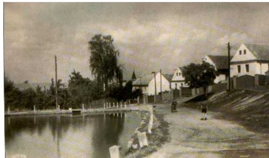
Lubná: první zmínka r. 1057, pohlednice z r. 1949.

Na katastru obce se těží lupek (jíl s 30% obsahem uhlí), jehož vypálením vznikne šamot. Několik set metrů od obce je jedna z největších firem u nás na výrobu obkladaček RAKO III. (produkce několik milionů m 2 ročně). Na zemědělské půdě hospodaří družstvo vlastníků (pěstují také chmel). Lubná má všechny sítě – voda, plyn atd. Rovněž všechny objekty jsou napojeny na kanalizaci, která je zavedena až do rakovnické čistírny odpadních vod. Po roce 1980 byla postavena nová škola s kompletním zázemím (ročník 1 - 9) a kulturní dům s pohostinstvím. V místě je mateřská škola, dětský doktor, pošta, knihovna, tělocvična (u školy), hřiště, obchod a hřbitov. Působí zde několik spolků. V hoblíkárně se vyrábí nejvíce dřevěných hoblíků u nás – jsou vyváženy do celého světa. Městská doprava z Rakovníka do Lubné jezdí každou hodinu. V roce 2007 oslaví Lubná 950 let d svého založení sjezdem rodáků.