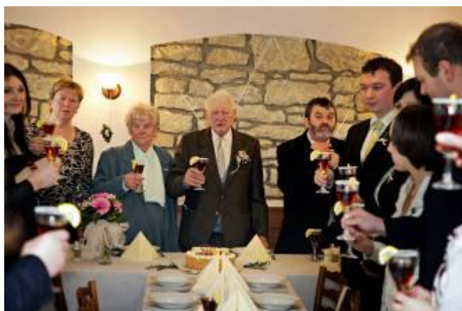
V penzionu U Roušarových

Zastupitelé obce, obecní úřad, zemědělské družstvo, Lubenské ženy, místní zahrádkáři a hasiči