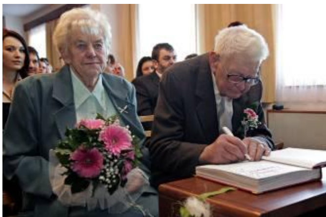
Podpis manželů do kroniky