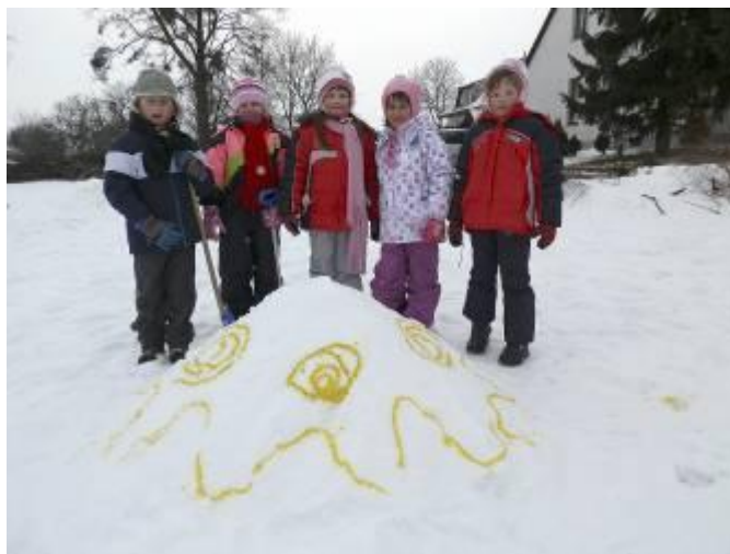
Hry se sněhem