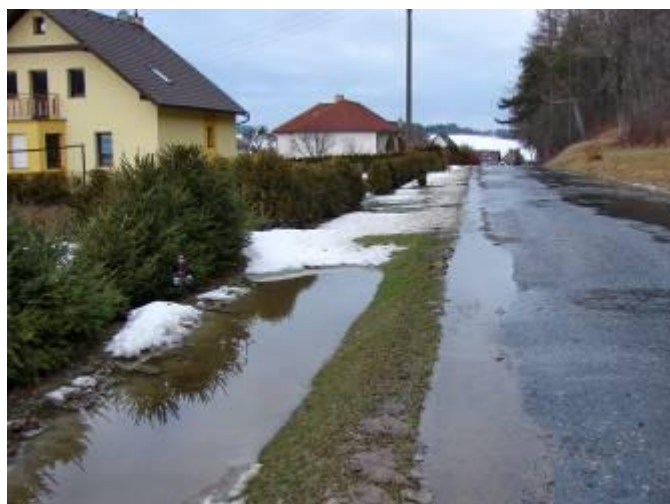
Povrchová voda na komunikaci od Širokého Dolu