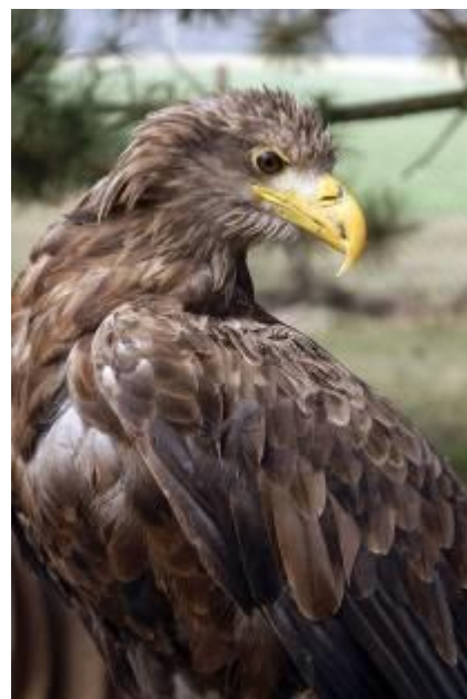
Ukázka dravých ptáků v MŠ