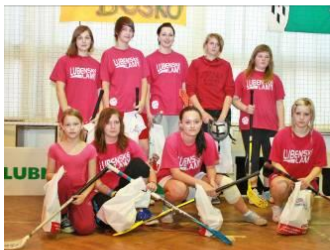
Dívčí družstvo - Lubenské lamy