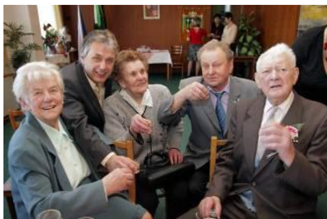
Společná beseda v salonku na Skalce