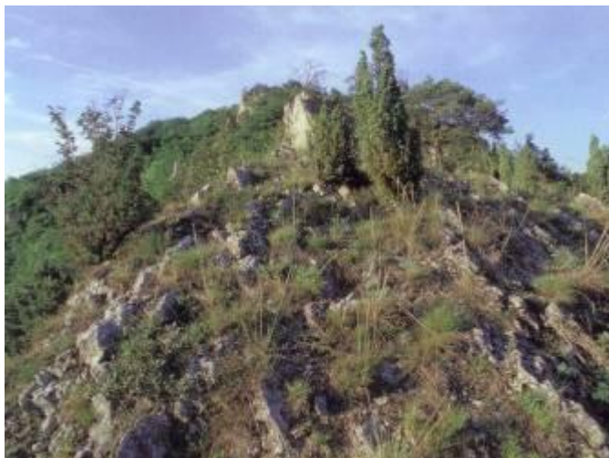
Skalní step Třesina

k nejvýznamnějším geologickým lokalitám. Geologické složení a význam staropravohorní pánve objevil pro vědu v 19. století francouzský inženýr Joachim Barrande, po kterém je pánev pojmenována. Vápence Českého krasu netvoří souvislé krasové území, ale jakési ostrovy, kde především ve vápencích devonu vznikly krasové útvary jako rokle, škrapy, závrtý, vyvěračky a jeskyně, které jsou méně časté v čistých silurských vápencích. V jeskyních se dochovaly pozůstatky zvířat, žijících ve středních Čechách od konce třetihor do současnosti. Jeskyně využívali také lidé jako obydlí, a to od starší doby kamenné, což dokládají četné archeologické nálezy. Unikátní a pozoruhodné jeskyně jsou v kaňonu Berounky u Srbska (Krápňíková, Ementál, Barrandova, Tomášková propast), v údolí Kačáku (Nad Kačákem, Skalní kostel),