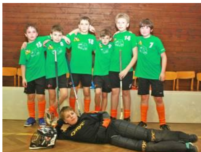
Lubenští hoši – 2. místo – mladší žáci