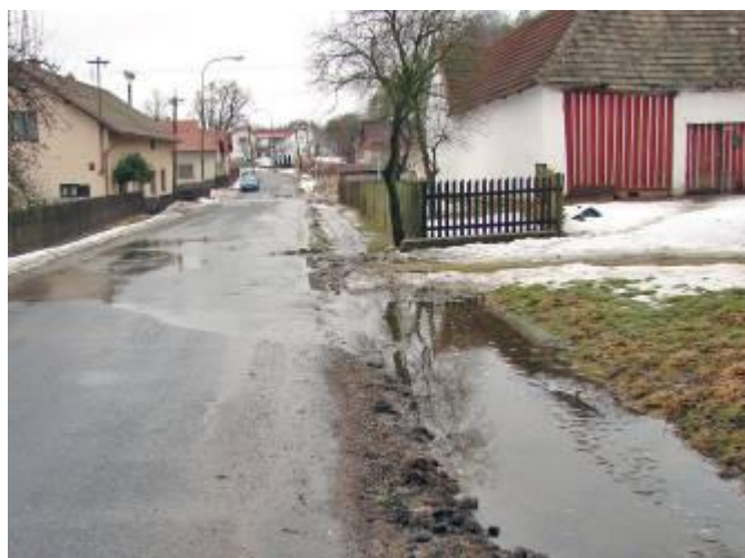
Rozlití vody u Kovářových