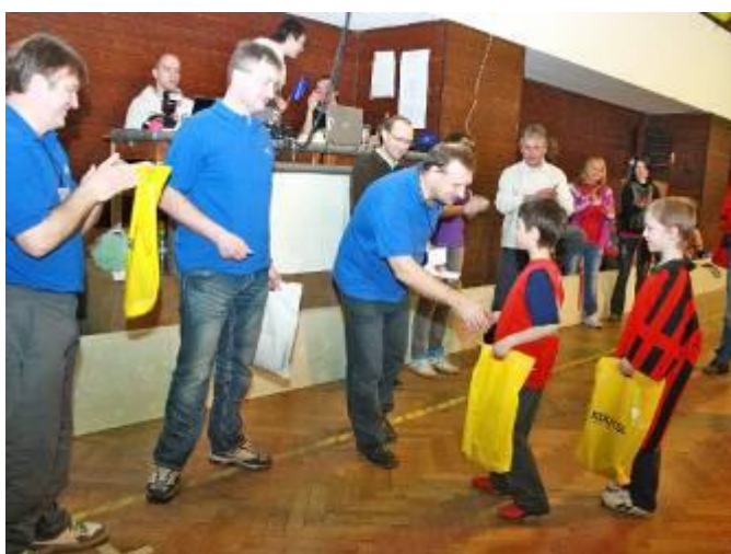
Pořadatelé předávají odměny nejmladší kategorii