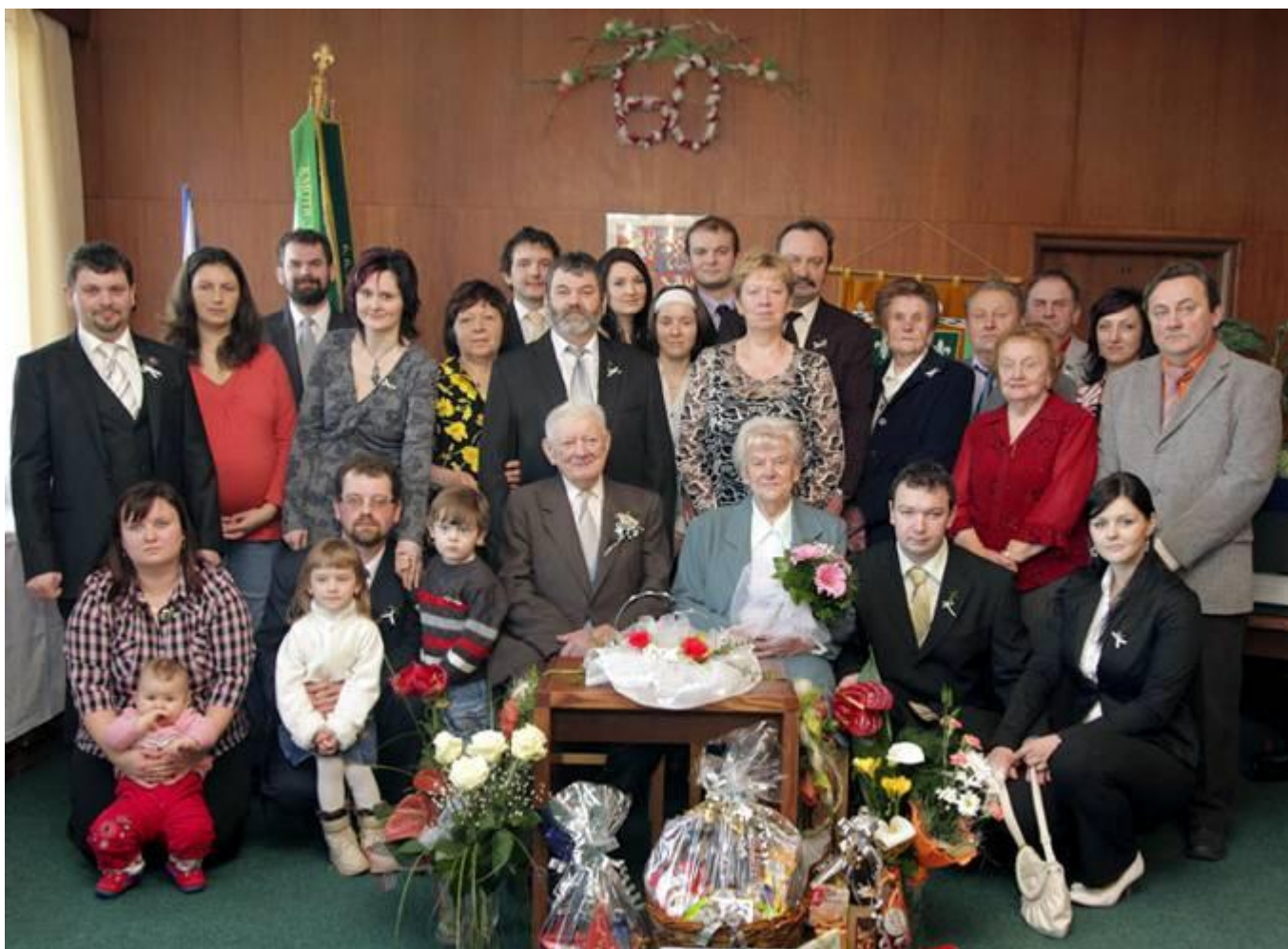
Manželé Kovářovi s rodinou