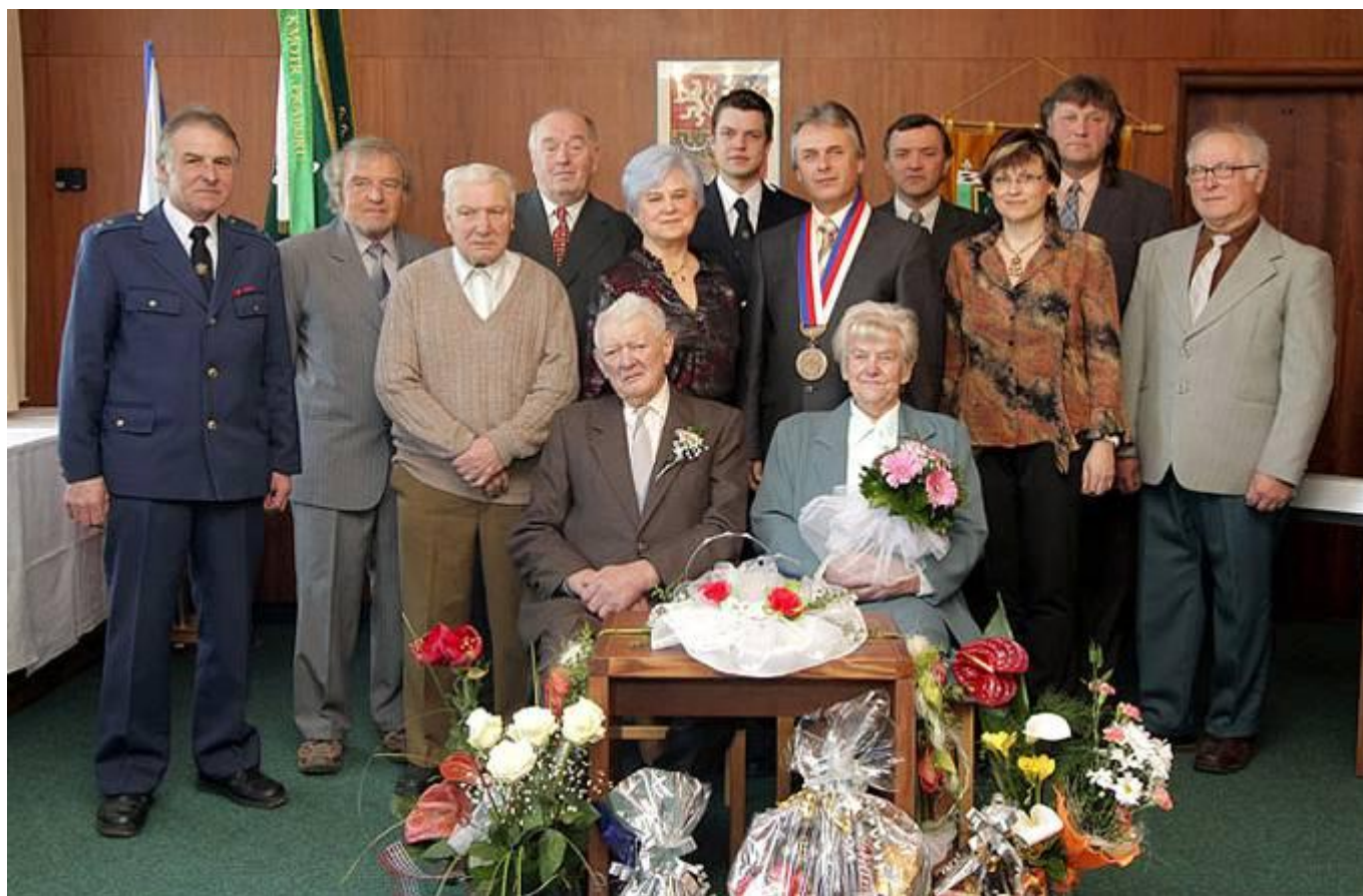
Manželé Kovářovi se zastupiteli, složkami obce a zástupci zemědělského družstva