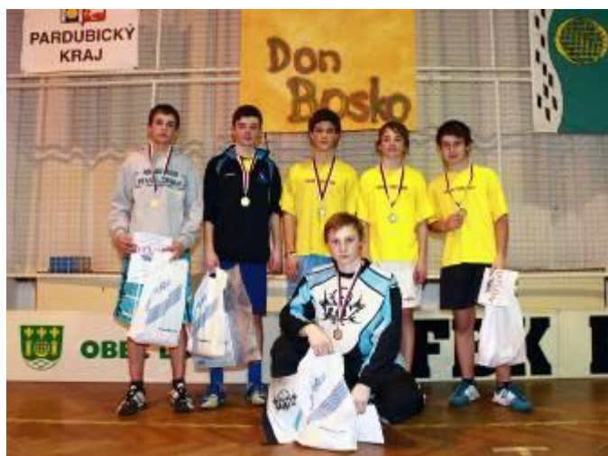
Kardiaci Juniors Lubná – 1. místo – starší žáci