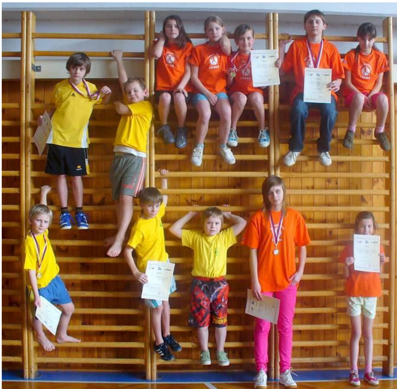
Účastníci okresního kola

Tyto čtyřboje proběhly 20. 2. 2012 ve Svitavách a zúčastnilo se 13 našich závodníků. Výsledky měli výborné, a tak se dostalo 11 dětí do kola krajského, které bylo 25. 2. 2012 v Pardubicích. Otazník byl však v tom, že někteří chlapci v tuto sobotu jeli na florbalový turnaj a někdo onemocněl. Nakonec se krajského kola zúčastnilo pouze 6 dětí. Ale svými výsledky nám udělaly radost.