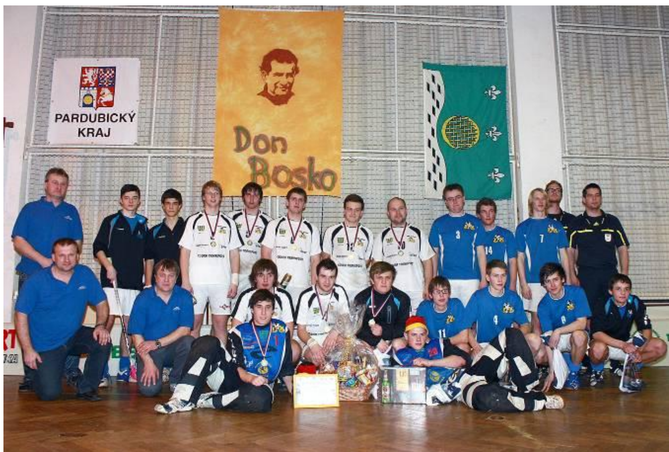
Společná fotografie pořadatelů, lubenských týmů a rozhodčích