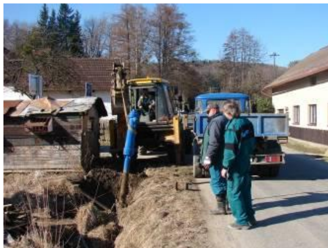
Oprava vodovodu u DPS a za Pálenicí