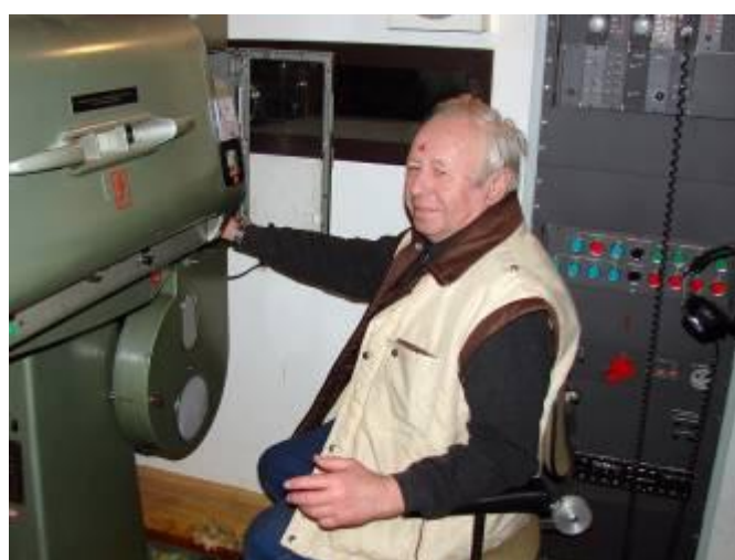
Promítání v místním kině