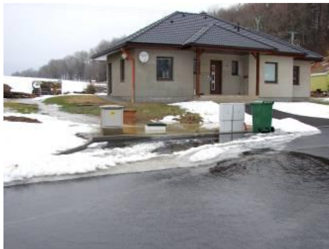
Za prodejnou Jednota a na sídlišti k Zrnětinu