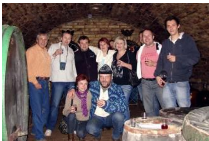
Účastníci zájezdu ve sklípku