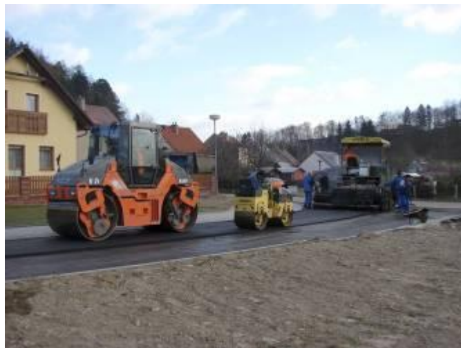
Položení živičného koberce