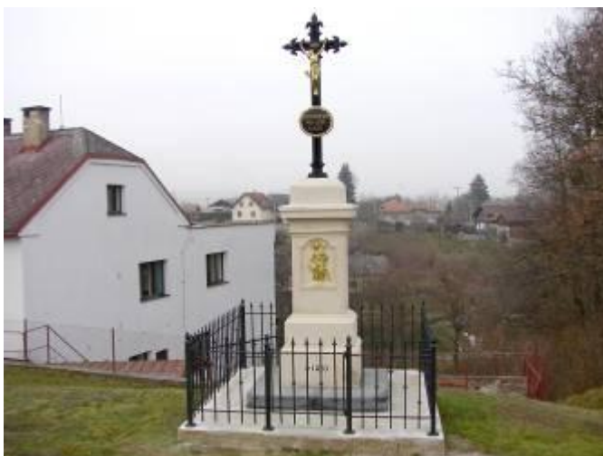
Nově opravený křížek u č. p. 162