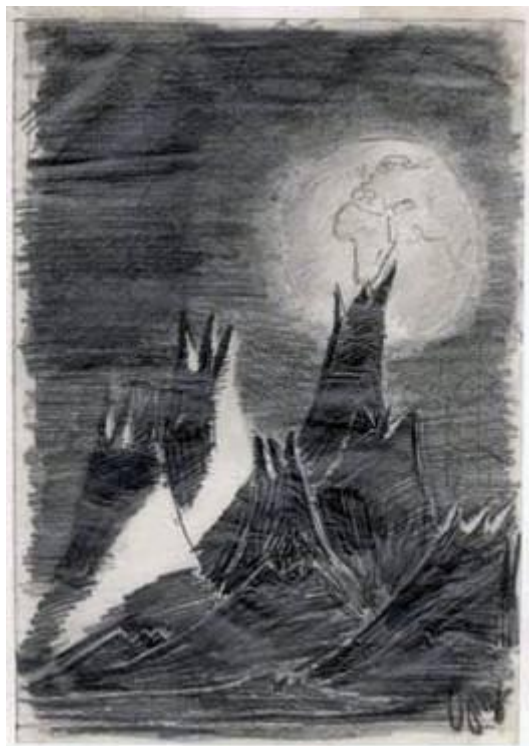
Měsíční krajina Petra Ginze