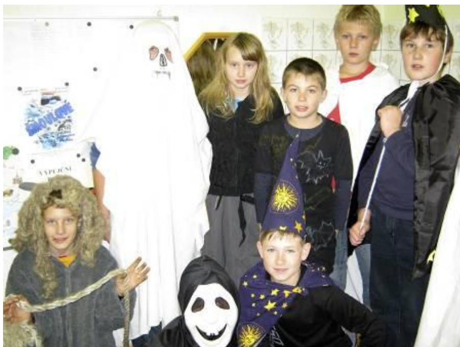
Halloween v 1. a 5. třídě