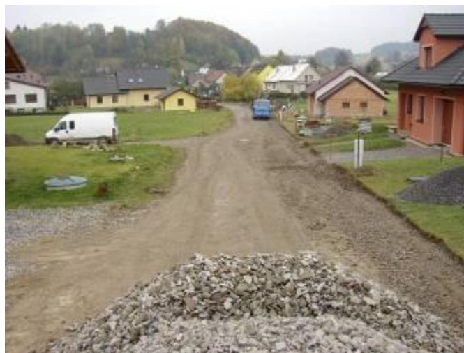
Původní stav komunikace