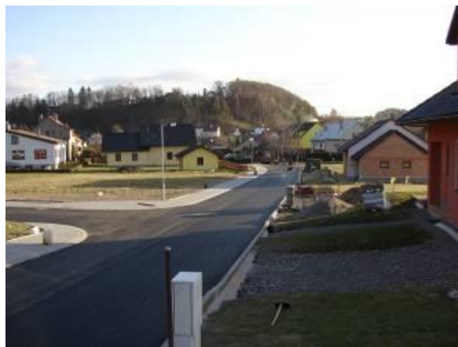
Pohled na nově zhotovenou místní komunikaci

Touto cestou děkuji všem pracovníkům firmy za nadstandardní přístup k realizaci celé zakázky a za precizně odvedenou práci.