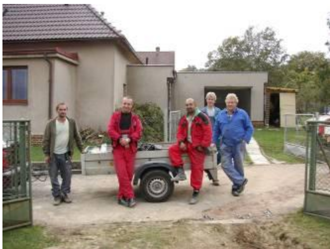
Zaměstnanci firmy VHOS, a.s. a lubeňští občané