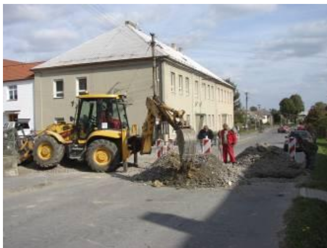
Překop silnice III. třídy u školy