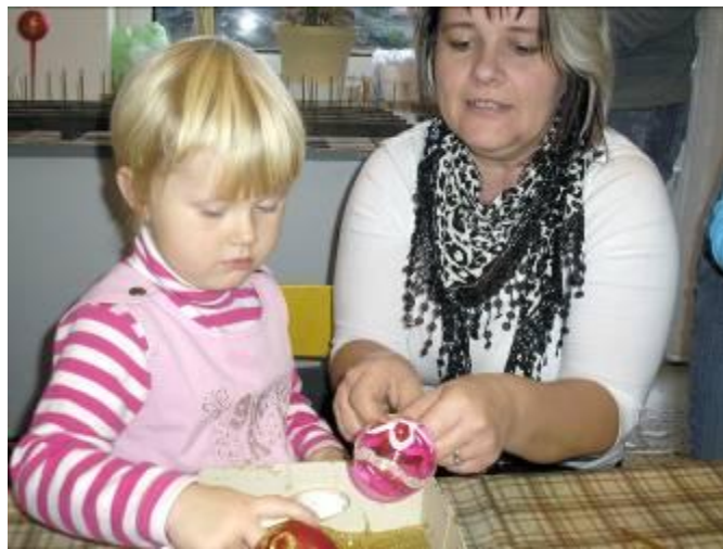
Vánoční dílna s rodiči