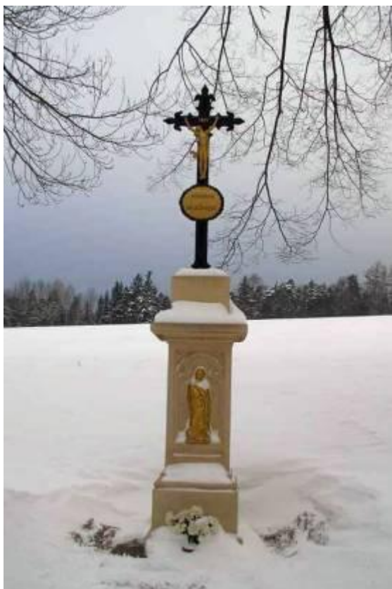
Kříž v poli u Zrnětína

Při svých cestách po naší obci, jejím bližším či vzdálenějším okolí narazíme velmi často