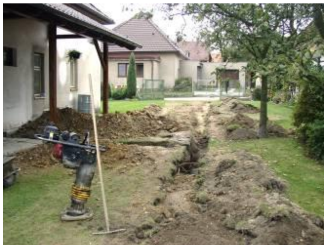
Oprava vodovodního řadu a přípojek podél školy a v zahradě u Kovářových