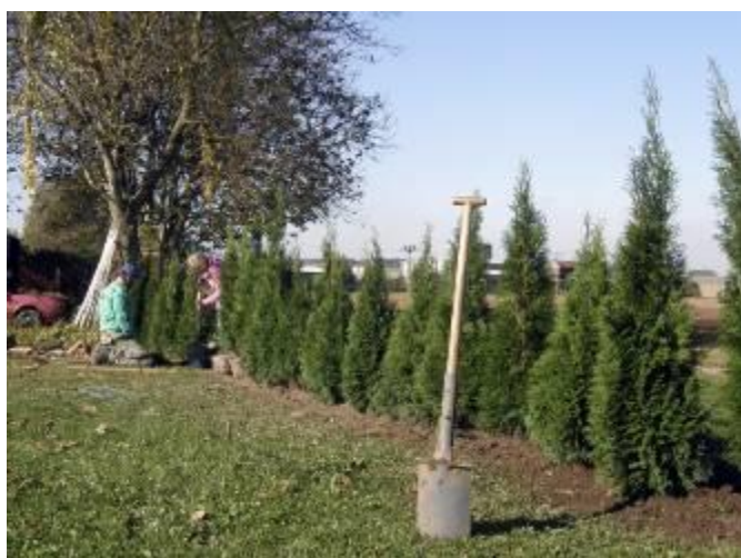
Výsadba živého plotu za DPS