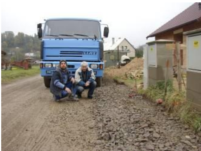
Vyměření cesty a obrubníků v terénu