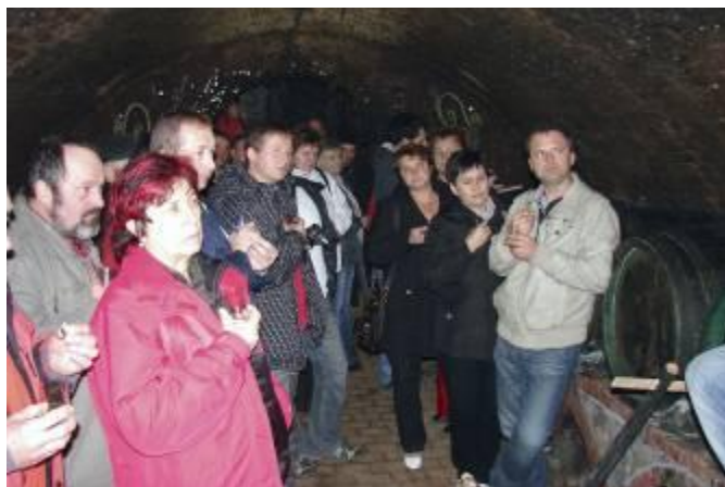
Ochutnávka bílých vín