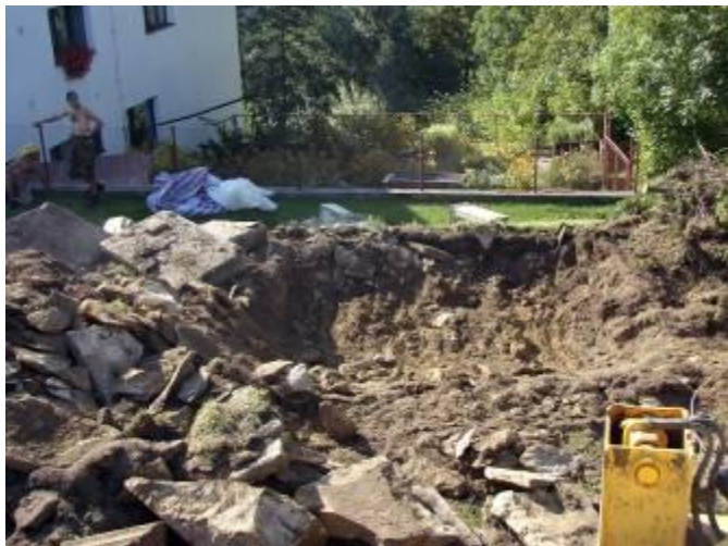
Vybagrovaný základ pod křížek