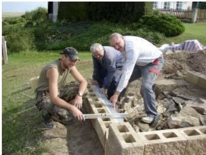
Zhotovení betonové desky