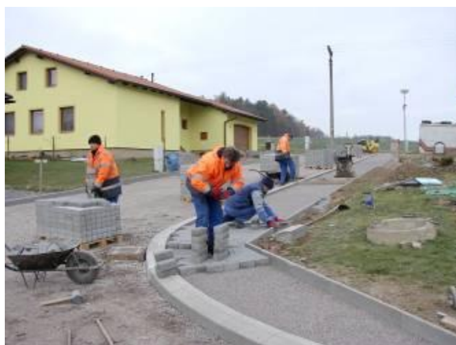
Položení zámkové dlažby do pojízdného chodníku

položení zámkové dlažby, prostorové a výškové uložení uličních vpustí, zřízení kanalizačních vpustí, položení štěrkodrtě, živичné směsi a mnoho dalších věcí.