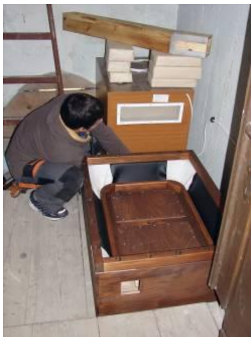
Montáž tichoběžného ventilátoru a plovákového měchu