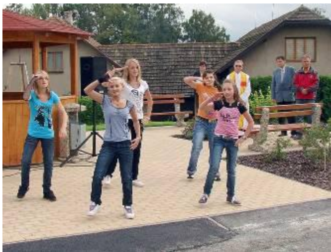
Vystoupení skupiny HENDIES