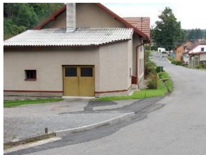
Upravený odtok dešťové vody u Hegrových