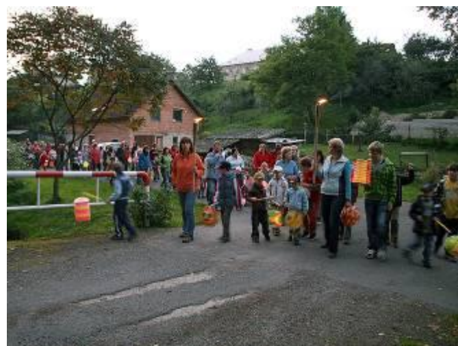
Průvod s rozsvícenými lampiónky