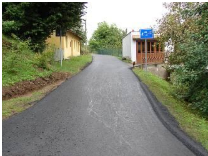
Původní a nový stav cesty k Flachovým