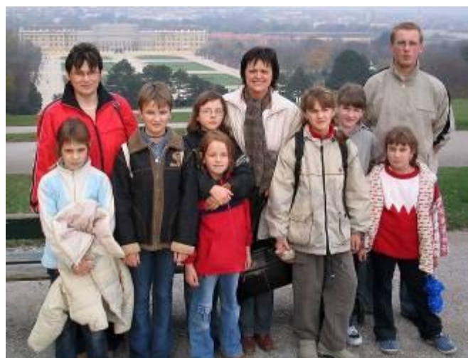
Vídeň – 2004