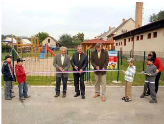
Slavnostní otevření dětského hřiště