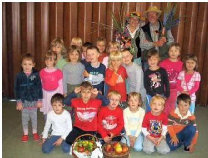
„Babička a dědeček“ ve školce