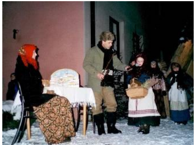
Zpívání u betléma - 2001