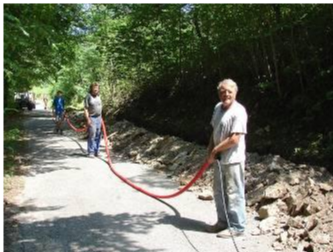
Pokládání kabelu na Malé Straně