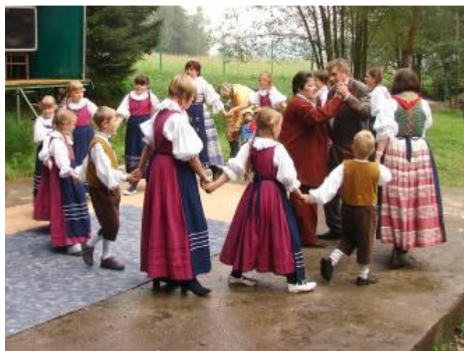
Kolo pro paní starostku