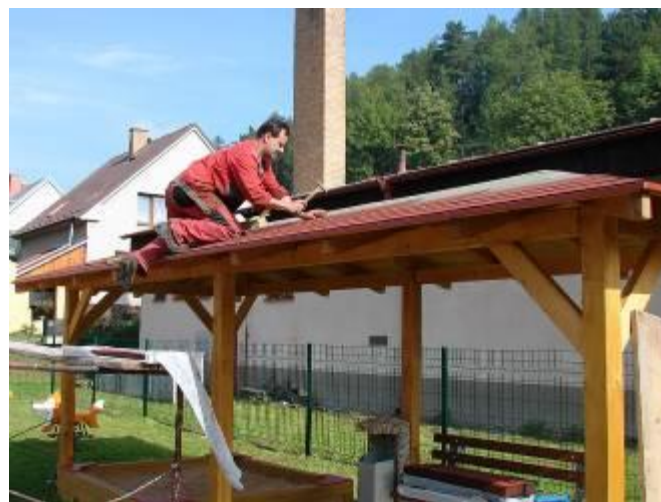
Betonování oplocení a pokládání střešní krytiny