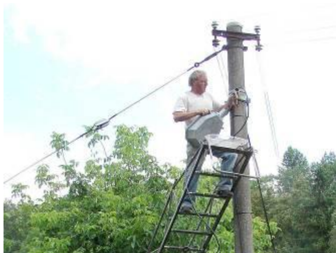
Oprava světla u Kovářových