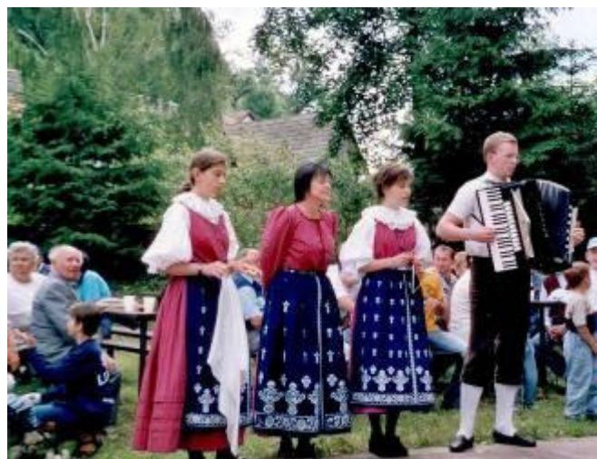
Setkání rodáků – 2004