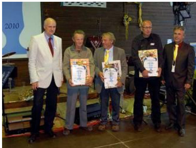
Předání odměn vítězům