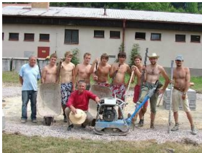
Brigádníci při stavbě dětského hřiště