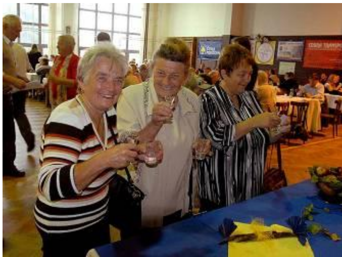
I našim babičkám chutnala slivovička