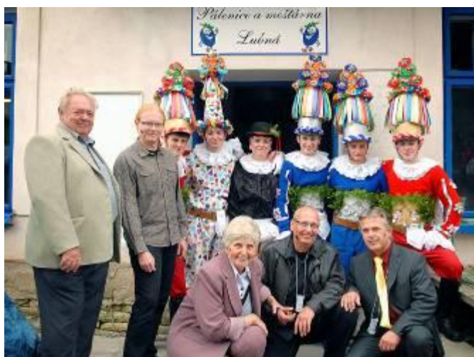
Masopustní maskary před Pálenící