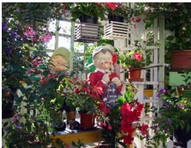
Postavičky, které dostali manželé Pohorští k výročí svatby