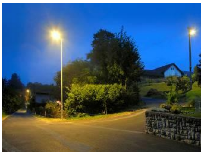
Osvětlená silnice k mostu