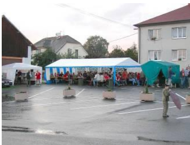
Posezení před bytovkou