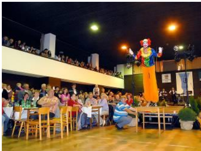
Překvapení pořadatelů APO – vystoupení klauna