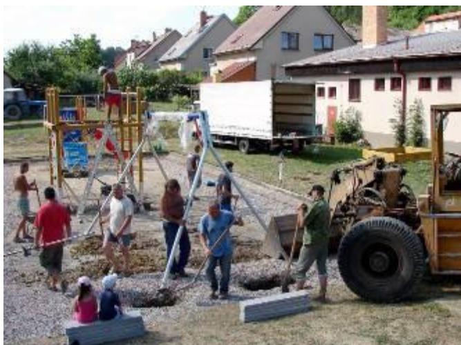
Montáž věže a kovové houpačky