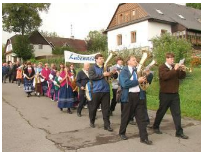
Lubeňáček v průvodu obcí

Lubeňáček na Setkání rodáků – Studnice u Hlinska 4. 9. 2010