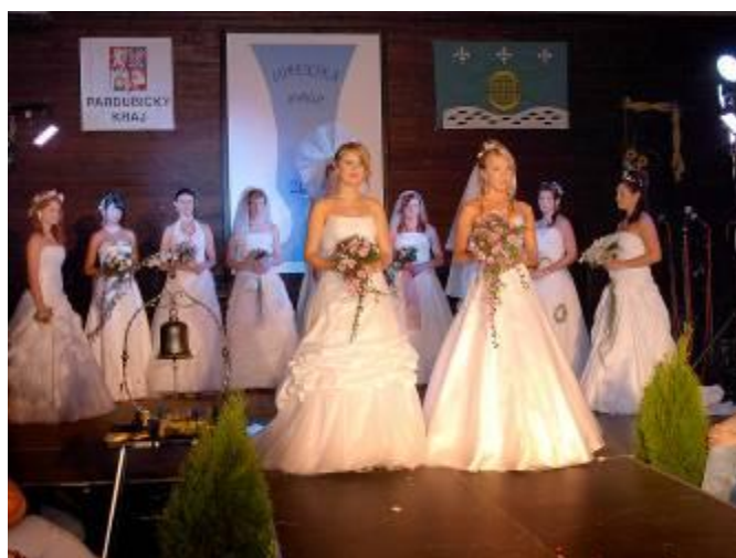
Přehlídka svatebních šatů a defilé všech zúčastněných