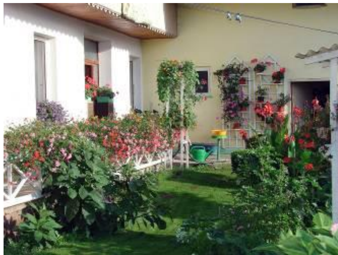
Pohled na rozkvetlé květiny