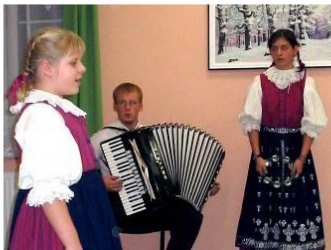
Mikuláš v DPS – 2004