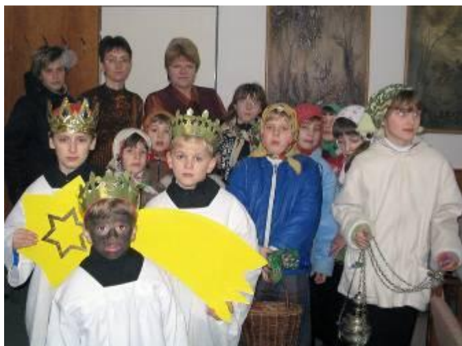
Tříkrálová obchůzka – 2002