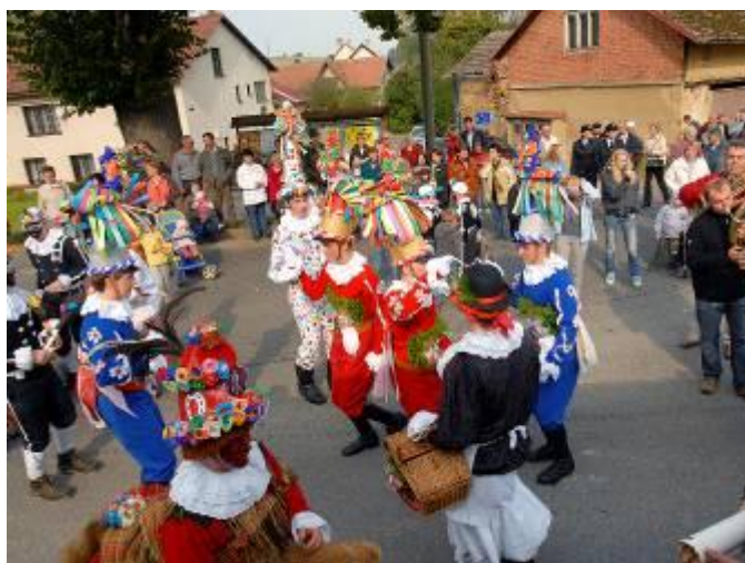
Taneček u „Myslivecké chalupy“