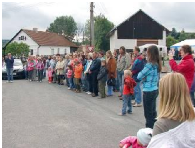
Slavnostní otevření prostranství u bytovky