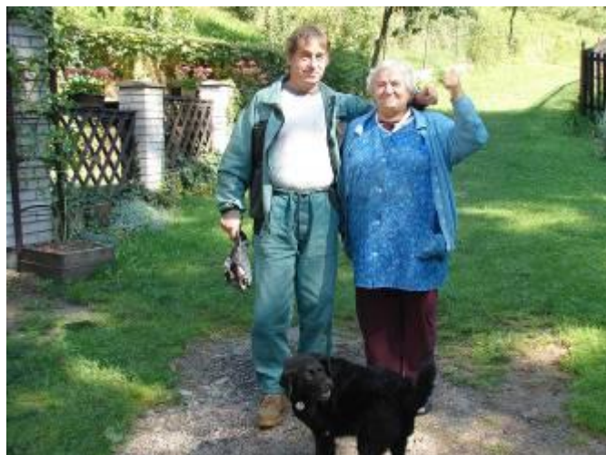
Hodnocení provedených prací našimi občany

Při této akci jsme současně upravili odtok dešťové vody u Hegrových. Jednalo se o svedení dešťové vody tekoucí z vinice do Lubenského potoka.