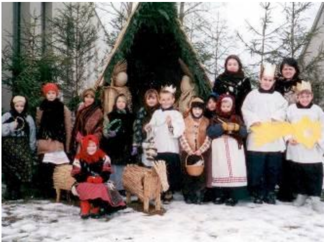
Tříkrálová obchůzka – 1. 1. 2000