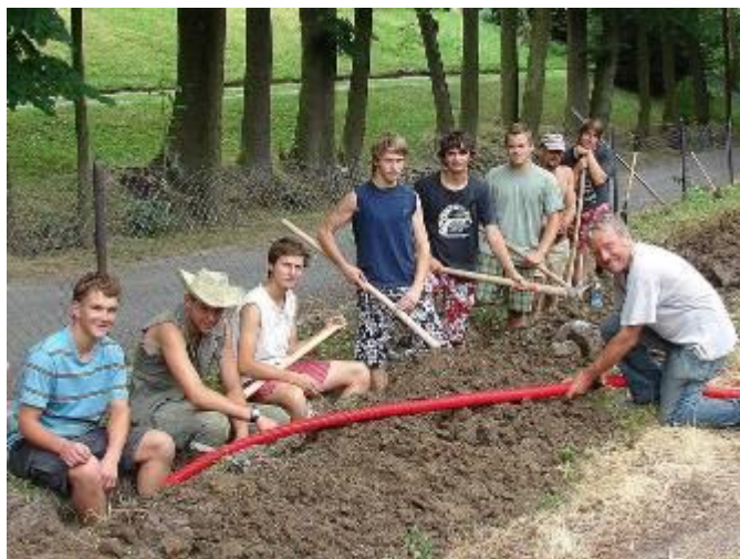
Oprava osvětlení v letním areálu