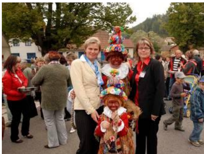
Pořadatelky s maskarami