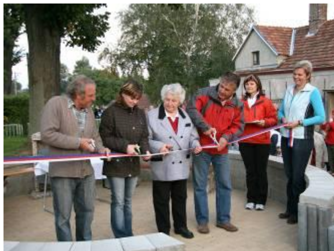
Slavnostní otevření odpočívadel u Bednářových a Břeňových