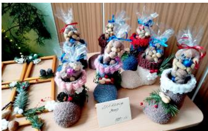
Ukázka výrobků – bota