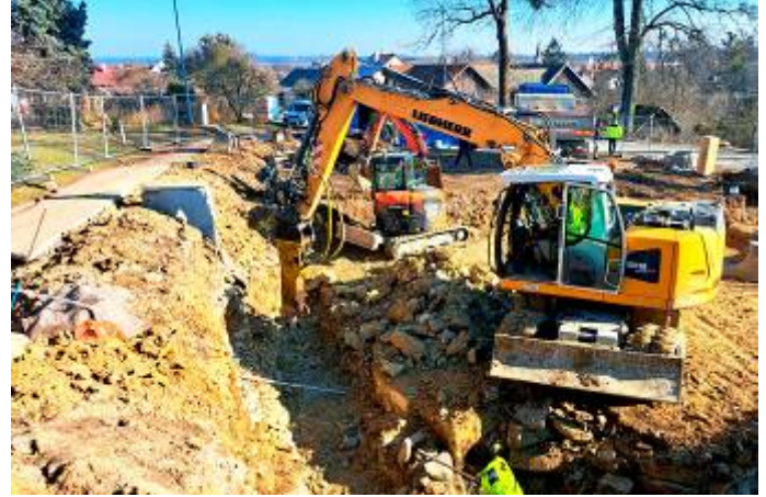
Hloubení základových pasů