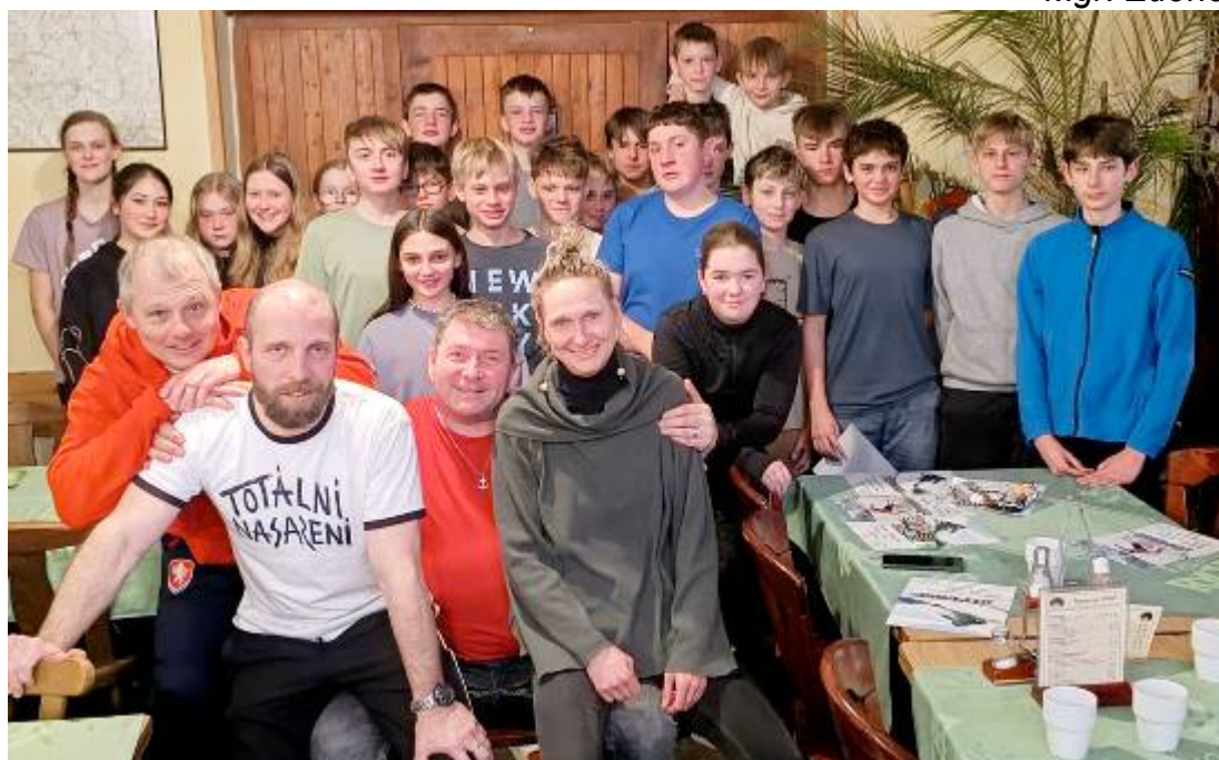
Lyžařský výcvikový kurz v Deštném v Orlických horách