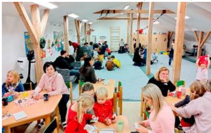
Kavárnička ve družině