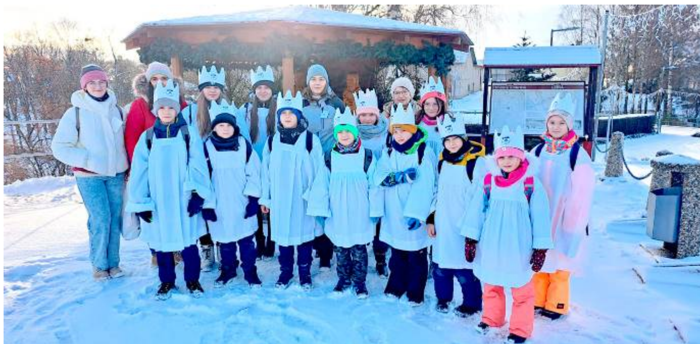
Společná fotografie koledníků Tříkrálové sbírky před obecním úřadem