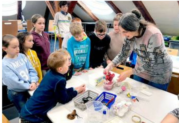
Návštěva Půdy v Poličce