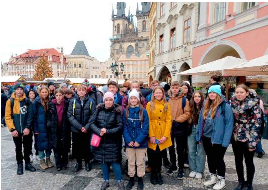
Na Staroměstském náměstí