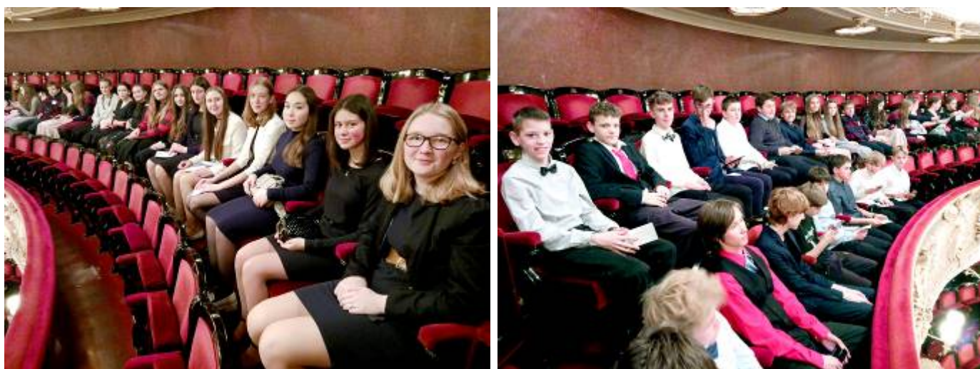
V Národním divadle