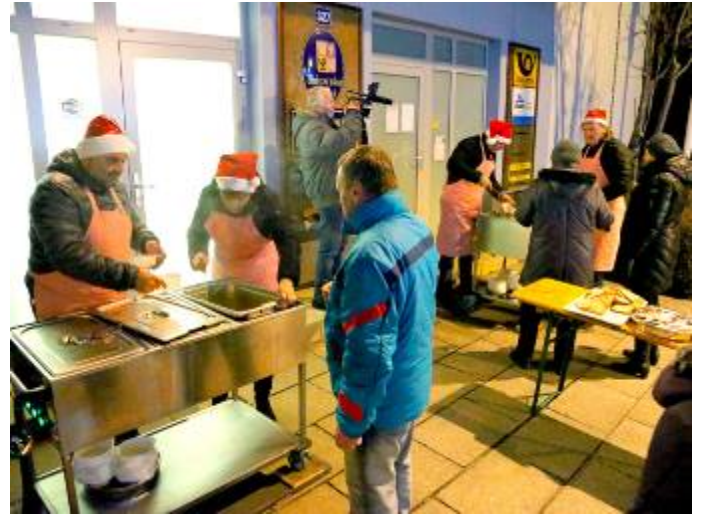
Zastupitelé obce při výdeji polévky