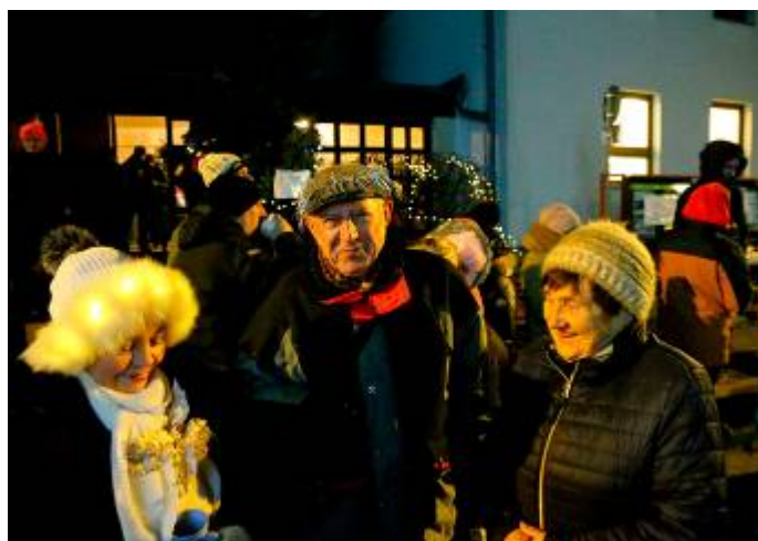
Silvestrovský ohňostroj před obecním úřadem