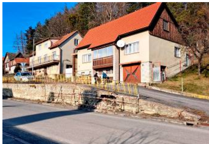
Současný stav poškozené zdi naproti prodejně COOP