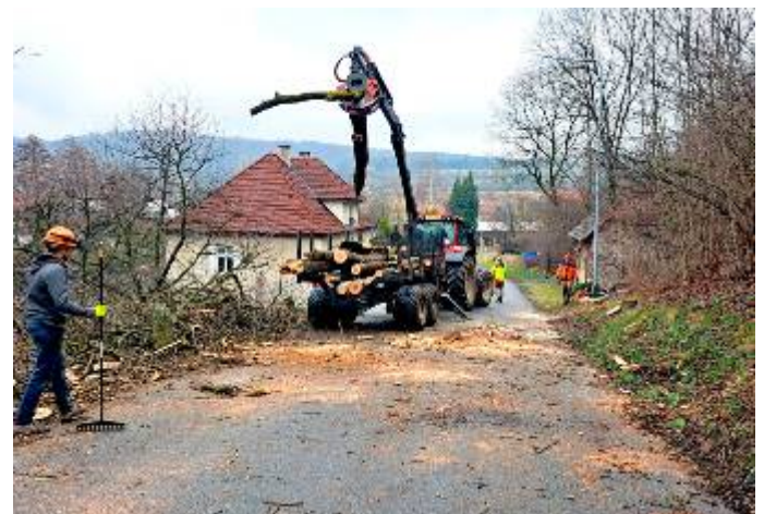
Shromažďování a odvoz dřevní hmoty