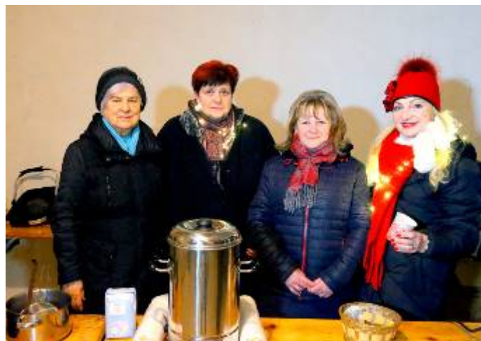
Svařák Lubenských žen