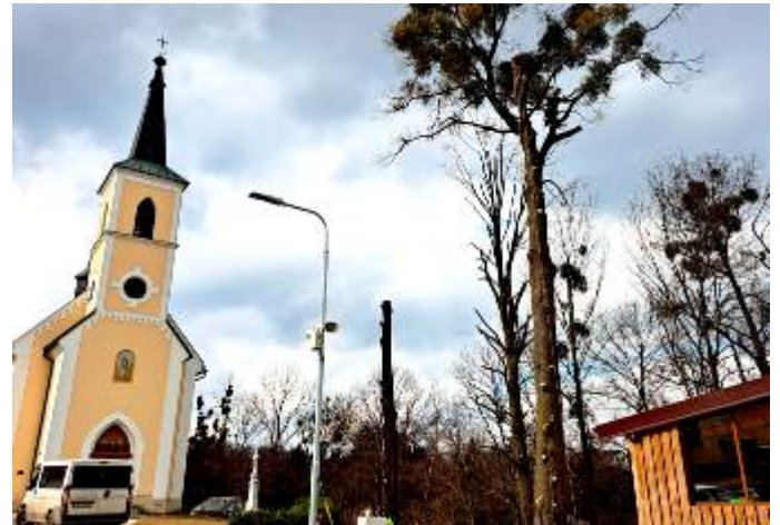
Kácení dřevin U Štátule a u kaple sv. Anny