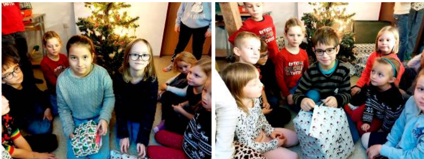
Ježíšek ve školní družině