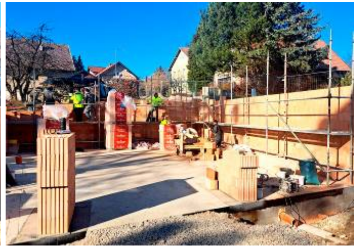
Stavba nosných konstrukcí objektu