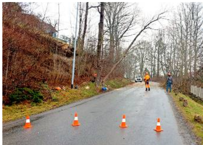
Kácení ve Vinici