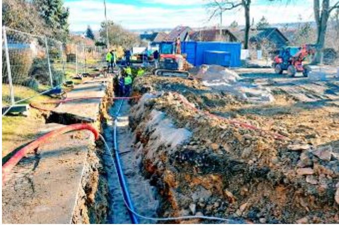
Výstavba vodovodního řadu

Na přiložených fotografiích si můžete prohlédnout postup stavebních prací.