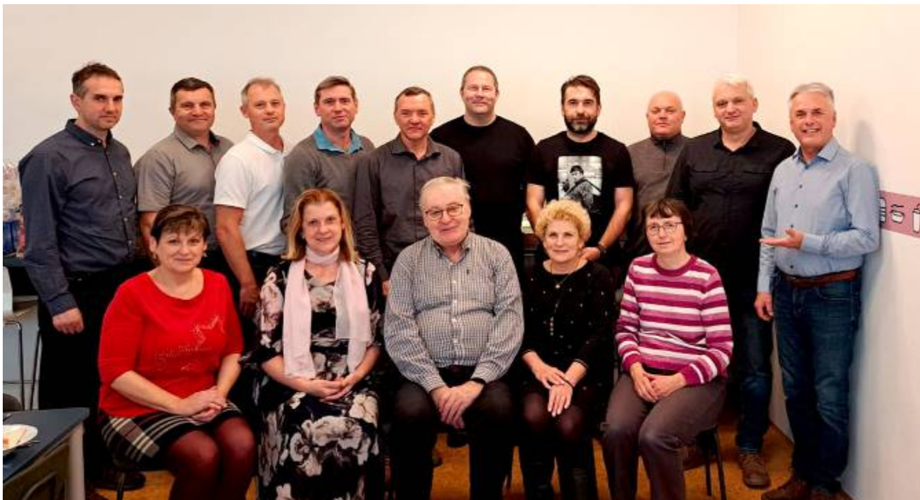
Společné setkání v základní škole v Lubné

Velké poděkování patří paní ředitelce, zaměstnancům školy a kuchařkám za vytvoření pohostinného prostředí, vynikající občerstvení a bezchybné organizační zajištění tohoto setkání. Bylo to krásné zastavení v předvánočním shonu a věříme, že v této milé tradici budeme pokračovat i v dalších letech.