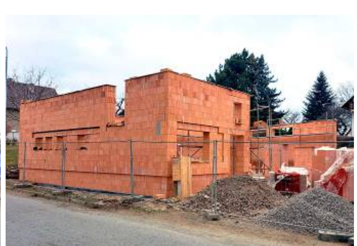
Zadní a čelní pohled na postup stavebních prací