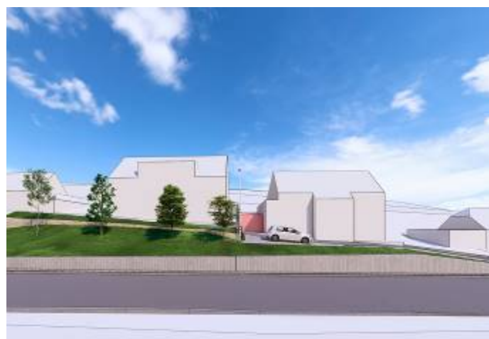
Vizualizace navrhovaného řešení opravy zdi

Během přípravné fáze bylo zjištěno, že část zdi leží na pozemku Správy a údržby silnic (SÚS) Pardubického kraje, což vyžadovalo odkoupení dotčeného pozemku. Tento majetkoprávní