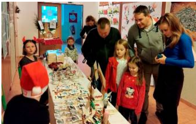
Spokojení návštěvníci z řad rodičů