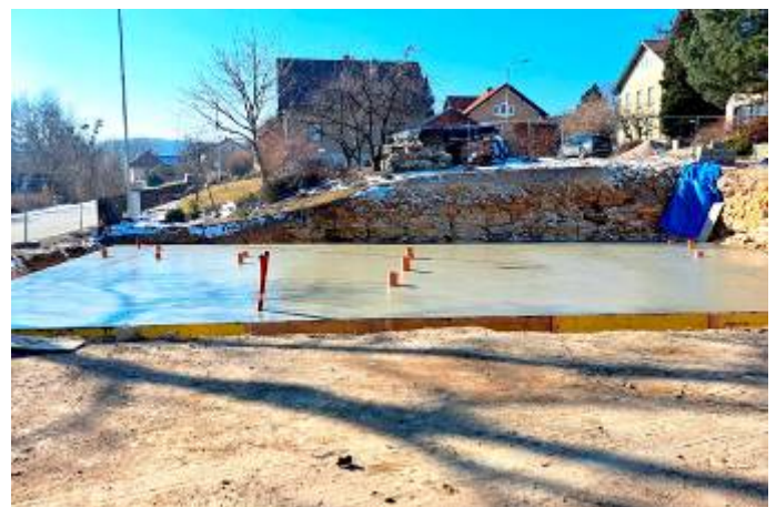
Zhotovení základové desky