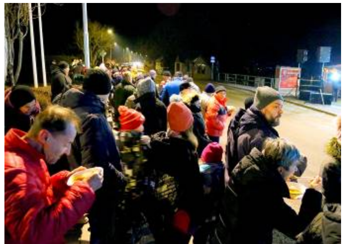
Silvestrovská polévka všem chutnala