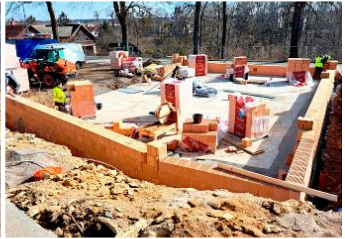
Výstavba obvodových zdí