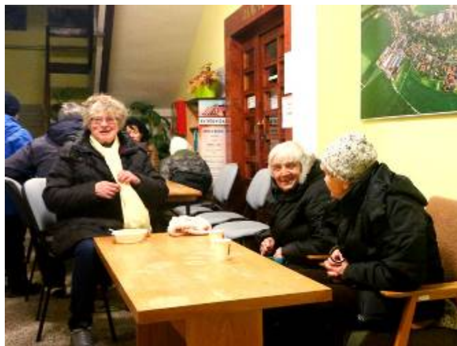
Připravené zázemí obecního úřadu pro návštěvníky silvestrovského ohňostroje