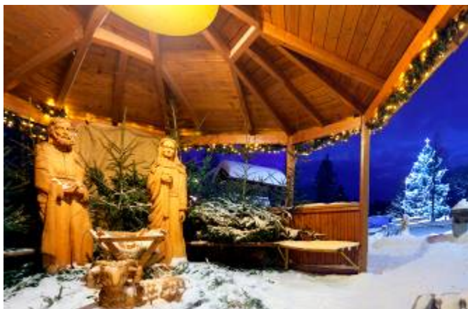
Betlém před obecním úřadem