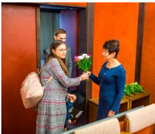
Přivítání rodičů a dětí v kině