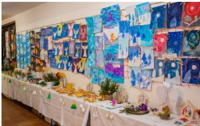
Výrobky dětí z mateřské a základní školy