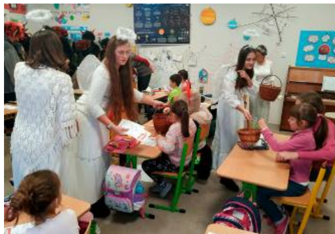
Návštěva Mikuláše a jeho družiny na prvním stupni