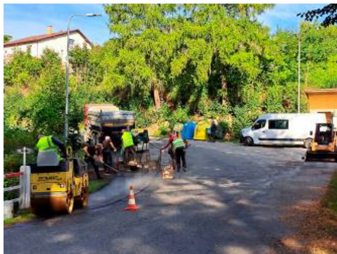
Oprava autobusové zastávky v dolní části obce u mostu