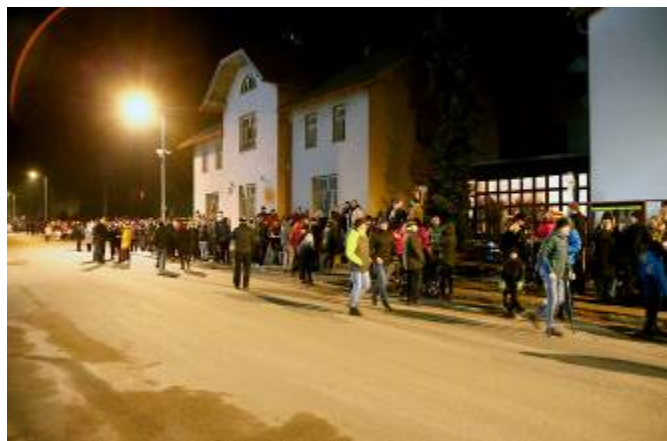
Silvestrovský ohňostroj přilákal velké množství návštěvníků