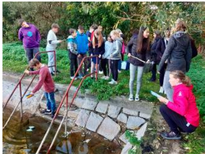
Měření průhlednosti a hloubky vody