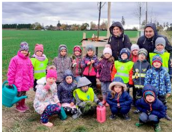
Na kněžství jsme zasadili strom