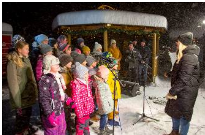
Vystoupení školního sboru Lubenika