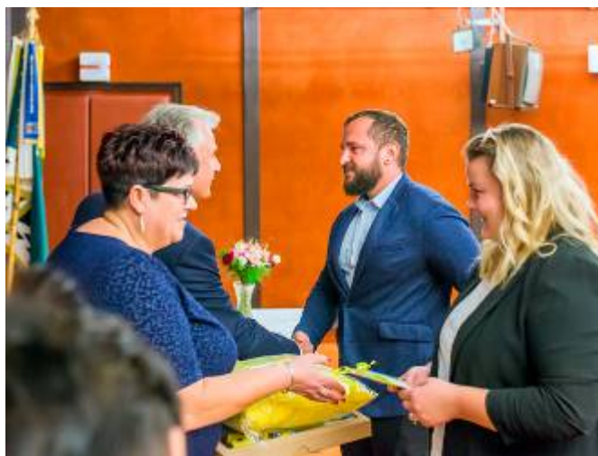
Předání drobných dámk rodičům