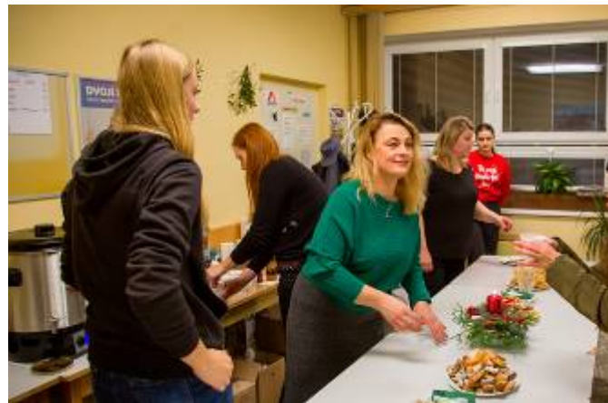
Občerstvení u lubenských hasičů