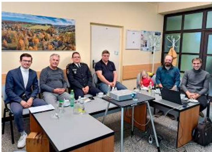
Účastníci jednání s ředitelem HZS PK