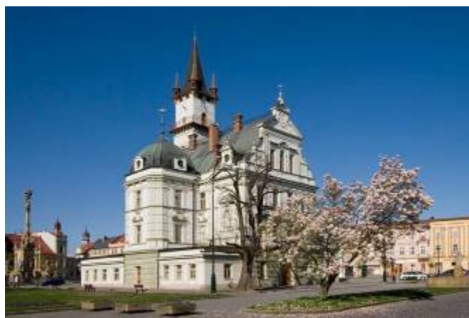
Uničov - trojlodní chrám Nanebevzetí Panny Marie

Také zavítáme do královského horního města Uničova, které roku 1213 založil moravský markrabě Vladislav Jindřich, bratr krále Přemysla Otakara I. Sídlo bylo opevněno kamennými hradbami, částečně zachovanými (půlkruhová bašta), se čtyřmi bránami, z nichž se zachovaly Medelská a Vodní. Půdorys města (městská památková zóna) je kruhový s náměstím a radnicí, která byla zničena Švédy a roku 1891 byla obnovena, má 45 metrů vysokou věž.