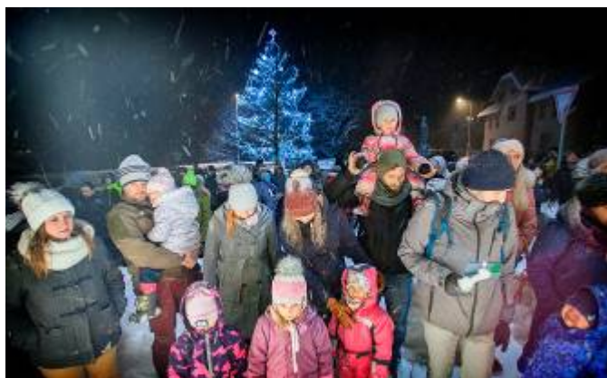
Rodiče a děti při rozsvícení vánočního stromu