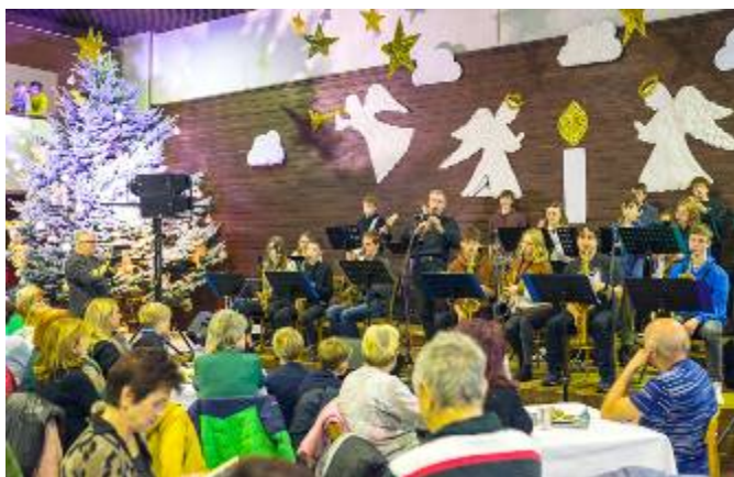
Big band při ZUŠ Litomyšl