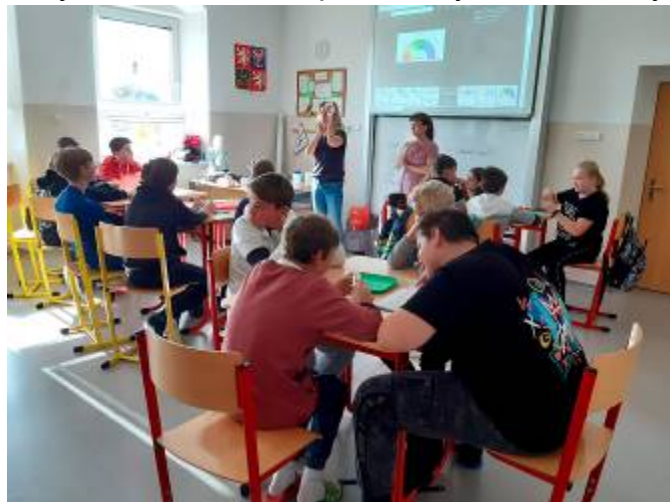
Měření pH vody

Praktická část probíhala u hasičské nádrže v Lubné a u rybníčku u palírny. Žáci se rozdělili do šesti skupin. Prováděli měření teploty a průhlednosti vody, hloubky nádrže, odebrali vzorky vody na měření sinic, pH, vzorky rostlin a malých živočichů, pozorovali život v nádržích.