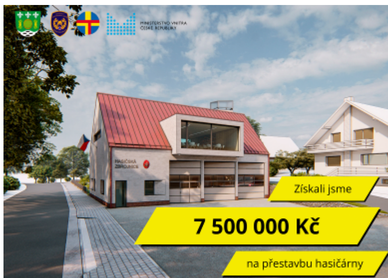
Vizualizace nové hasičárny