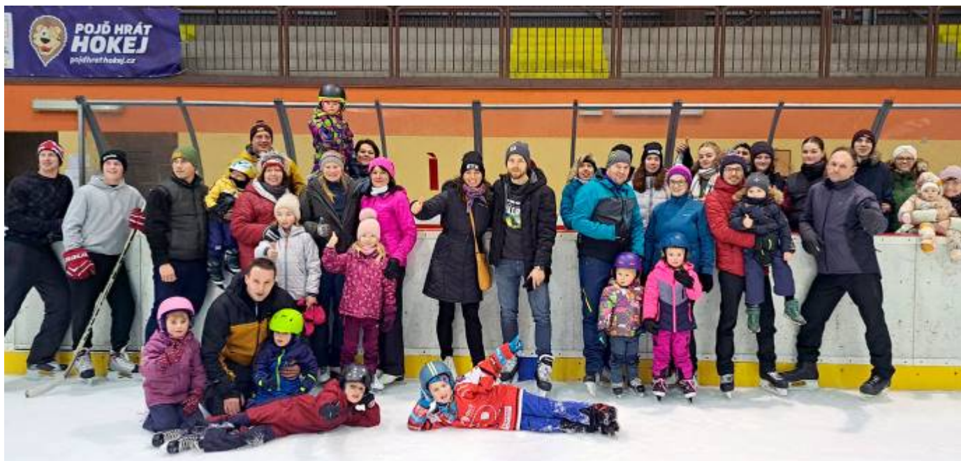
Společná fotografie s účastníky, kteří bruslili až do konce