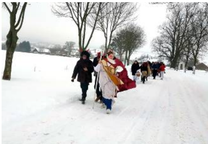
Cesta z Lubné do Sebranic