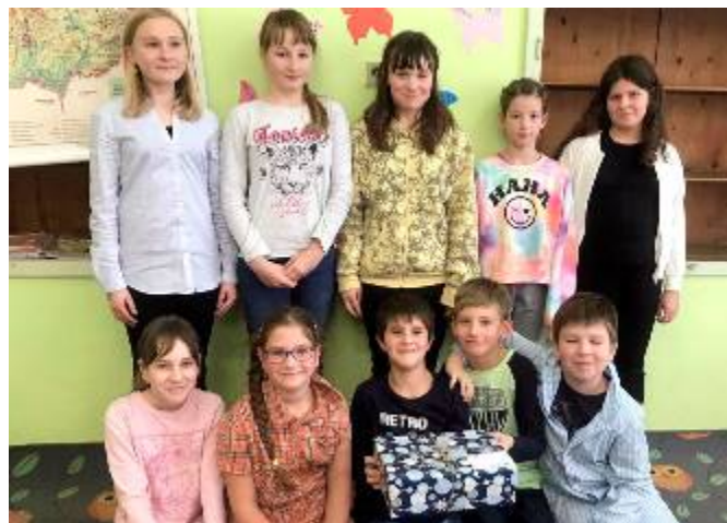
V 5. třídě už je dárek připravený