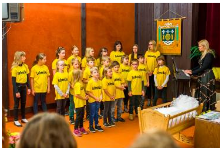
Vystoupení školního sboru Lubenika