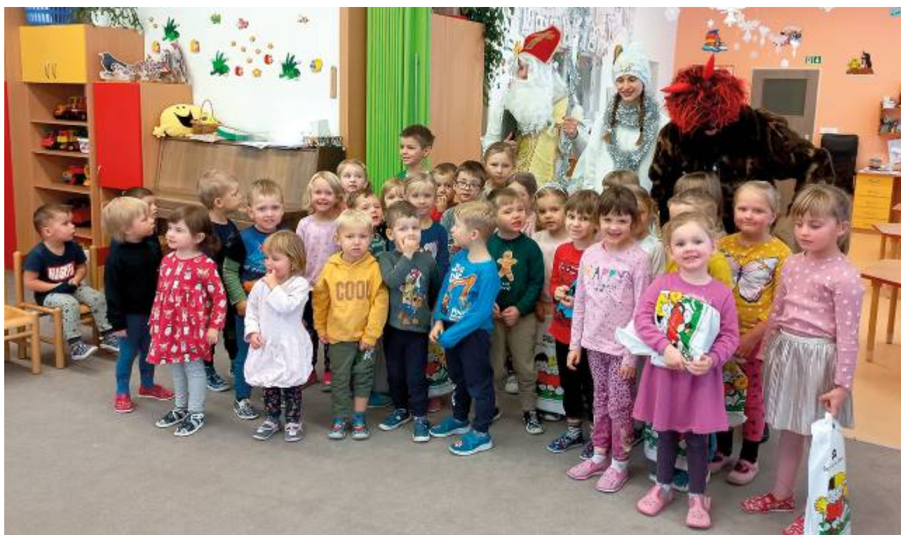
Mikulášská nadílka v mateřské škole