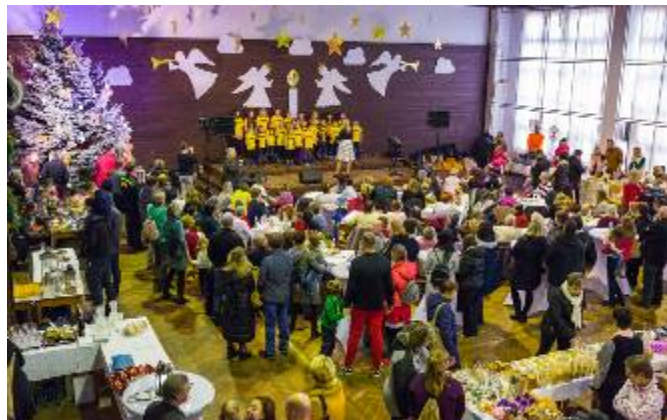
Spokojení návštěvníci vánoční výstavy