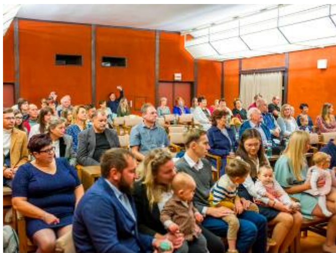
Pohled do zaplněného sálu

Vážení rodiče, přeji Vám, ať Vaše starost a odpovědnost ve výchově Vašich dětí je korunována neplacenou odměnou v podobě dětské lásky, radosti a úsměvu.