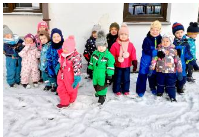
U mateřské školky nasněžilo 😊