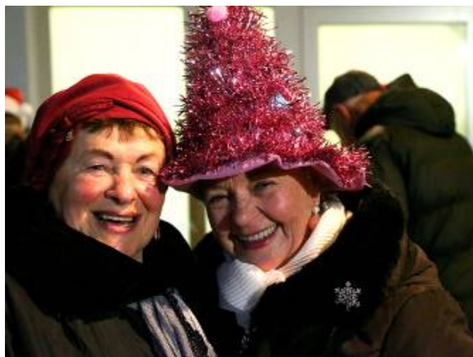
K dobré silvestrovské náladě se podával svařák lubenských žen