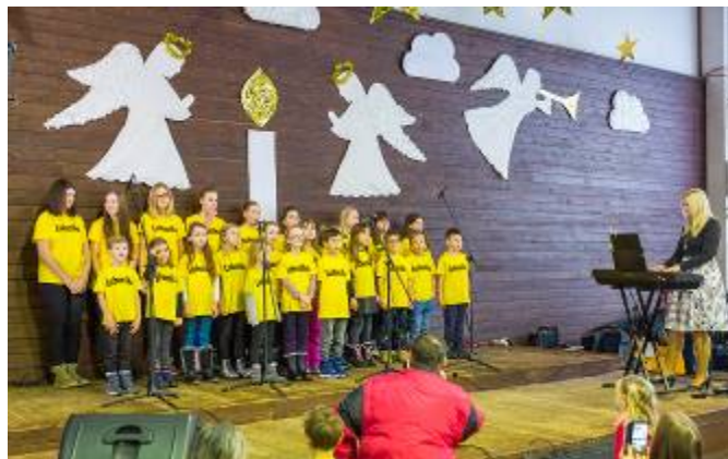
Vystoupení školního sboru Lubenika