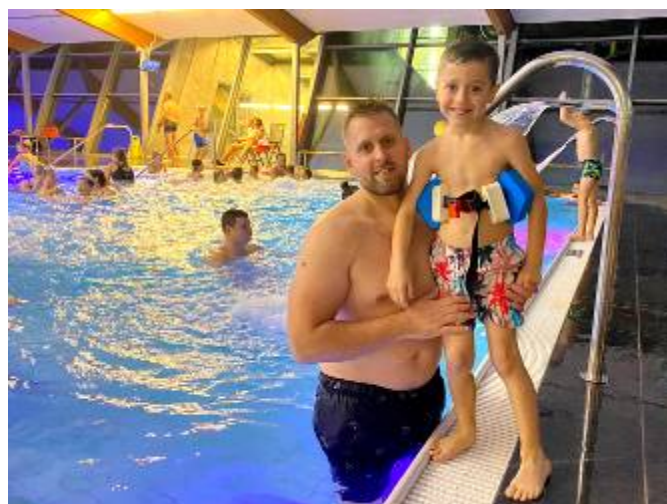
Spokojení návštěvníci litomyšlského bazénu