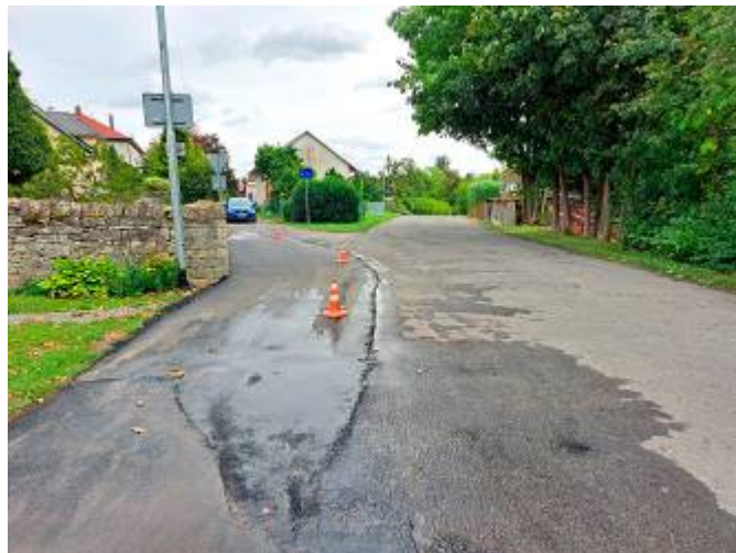
Oprava silnice u Matějkových a Andrlových