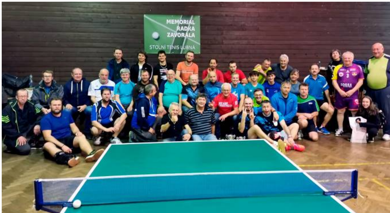
Turnaj ve stolním tenise pro neregistrované hráče