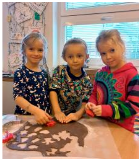
Vykrájování a zdobení perníčků