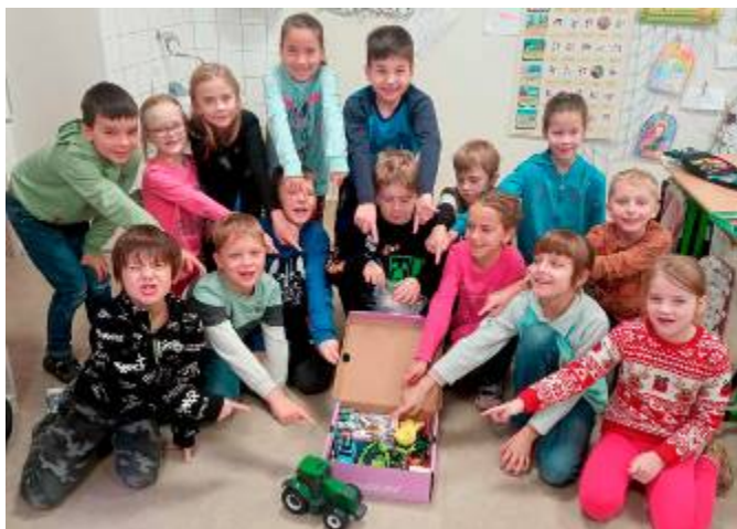
Žáci 2. třídy společně balí dárek