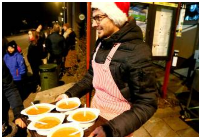
Zastupitelé obce při výdeji polévky

V neděli 31. prosince 2023 v 18 hodin před obecním úřadem se uskutečnil silvestrovský ohňostroj, který pro nás připravila firma Širokodolská s.r.o. a ozvučení zabezpečil M. Briol a P. Kovář. Celou show pro nás připravil J. Havel ve spolupráci s L. Doležalem a M. Jílkovou.