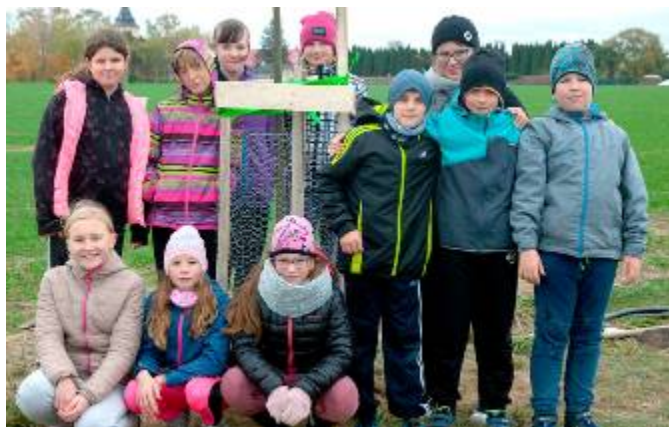
Sázení lipové aleje na hranici lubenského a sebranického katastru