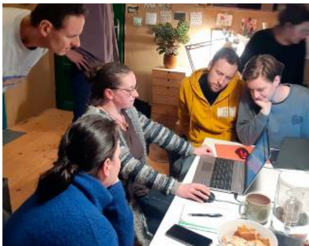
Pravidelné školení s Krajskými koordinátory projektu Model Živá krajina

přírody a drobných kulturních a historických památek, odhalování památníků, pamětních desek, jakož i organizování života spolkového.