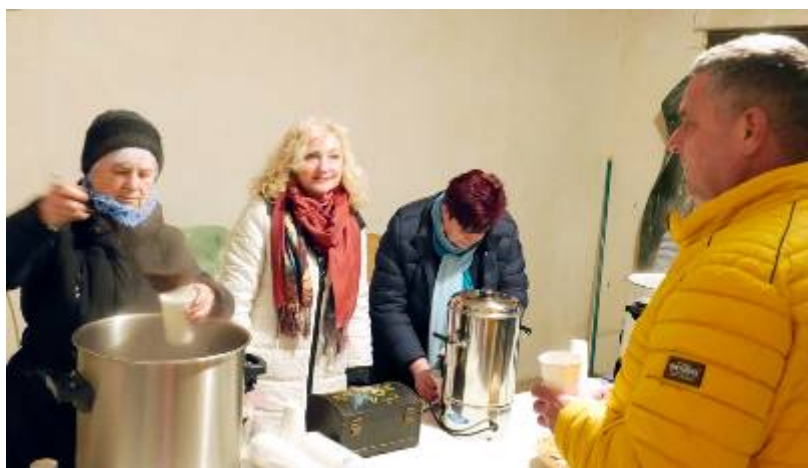
Starostova silvestrovská polévka a svařák Lubenských žen všem chutnaly