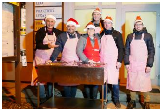
Zastupitelé obce při výdeji polévky