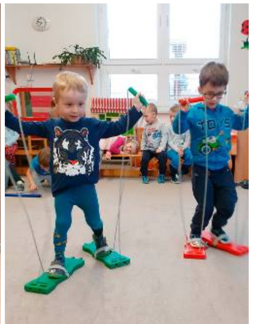
Karneval, recyklohraní a zimní sporty