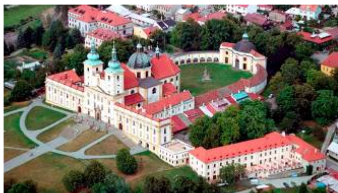
Dominikánský klášter Poutní místo Svatý kopeček