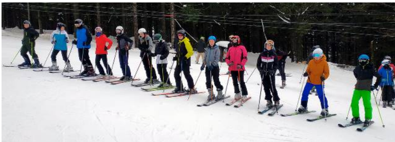
Lyžařský výcvik v Deštném v Orlických horách