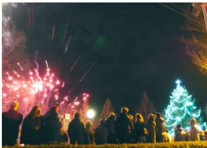
Silvestrovský ohňostroj před obecním úřadem