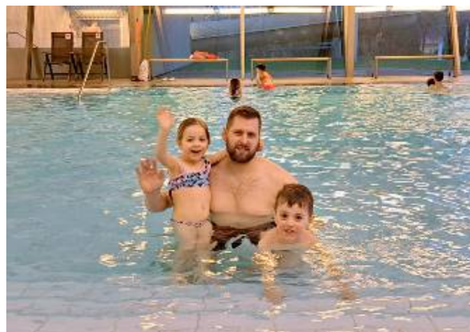
Pronájem krytého plaveckého bazénu v Litomyšli a spokojení účastníci