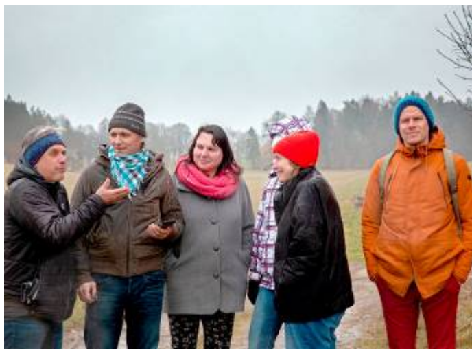
Starosta obce nám ukázal místa, která jsou za větších dešťů problematická

Svoje myšlenky a ideály prosadily spolky až do školních osnov obecných a měšťanských škol, jak se můžeme dočíst ve školním řádu z roku 1937: „Škola má podporovat snahy o zkrášlení domova, včetně podpory samotných okrašlovacích spolků a vkusnější úpravy domácností i veřejných míst.“ Svaz okrašlovací a ochranný vydával vlastní časopis Krása našeho domova , který od roku 2001 opět vychází.