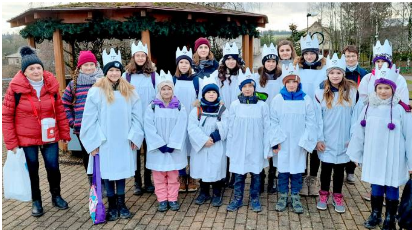
Společné foto koledníků a vedoucích na prostranství před obecním úřadem