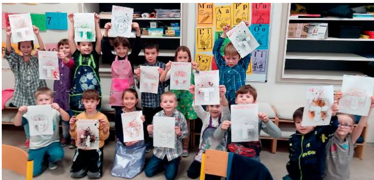
Projekt Domestos v 1. třídě