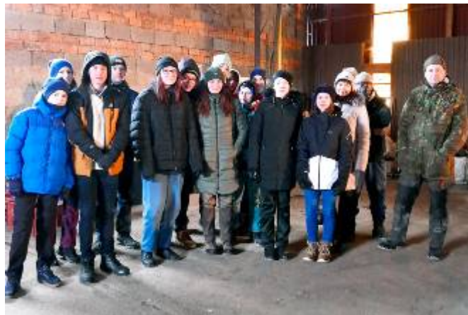
Žáci 9. třídy s paní učitelkou před obecním úřadem a ve sběrném místě