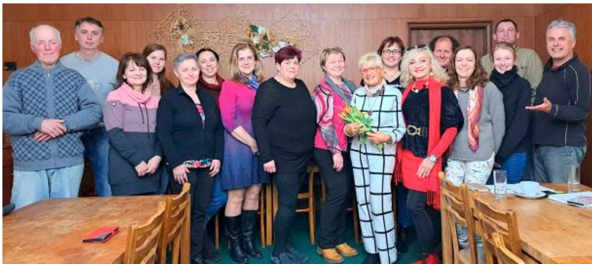
Společná fotografie účastníků přednášky