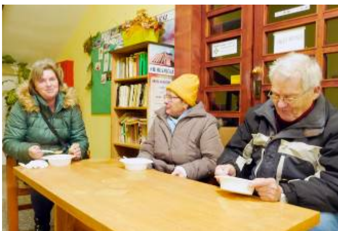
Zázemí na obecním úřadě