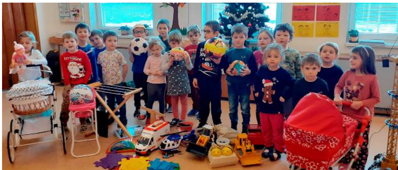
Vánoce v mateřské škole