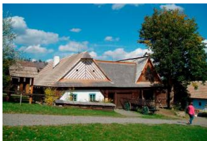
Veselý kopec - usedlost z Lezníku