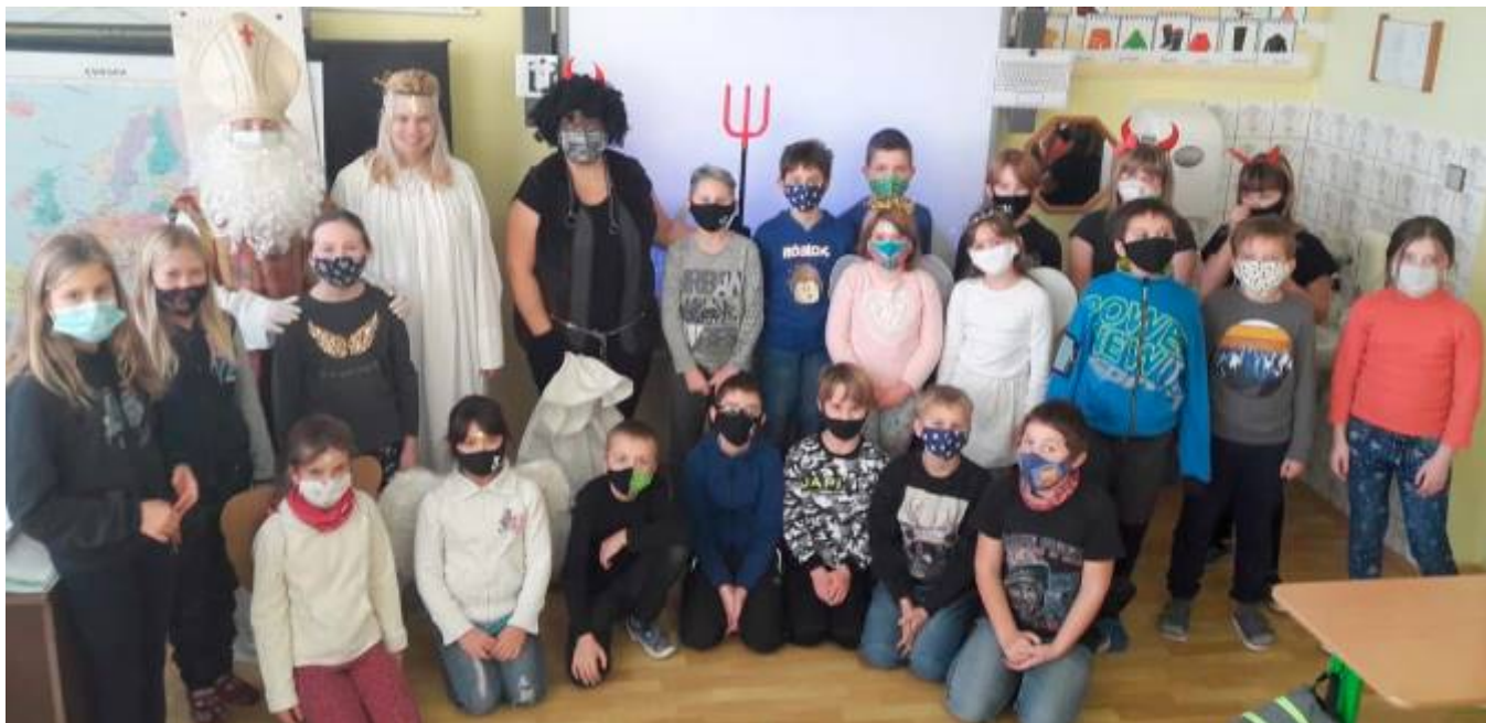
Mikuláš v základní škole