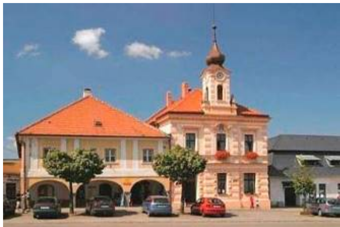
Golčův Jeníkov - radnice