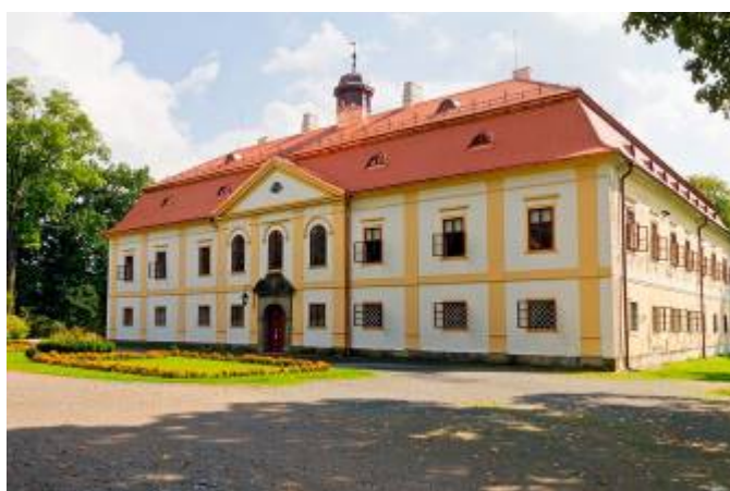
Zámek v Chotěboři