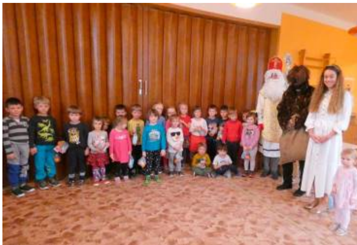
Mikuláš v mateřské škole