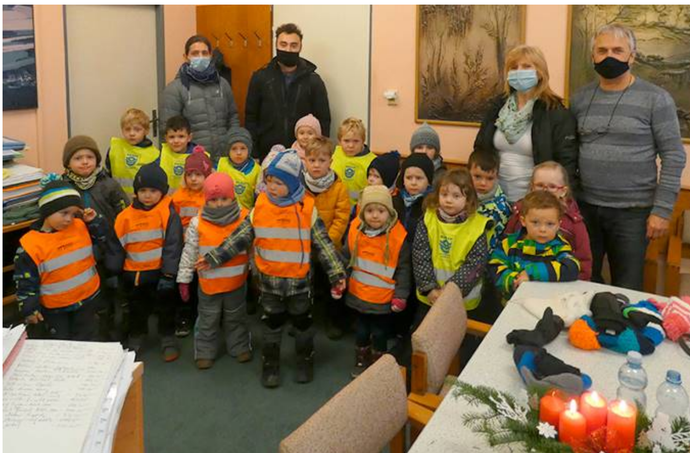
Vánoční koledování u pana starosty