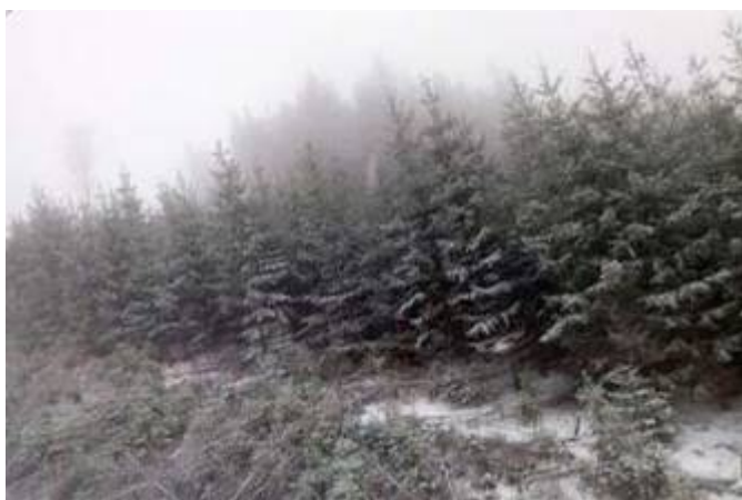
Fotografie z fotosoutěže na téma KRÁSA STROMŮ