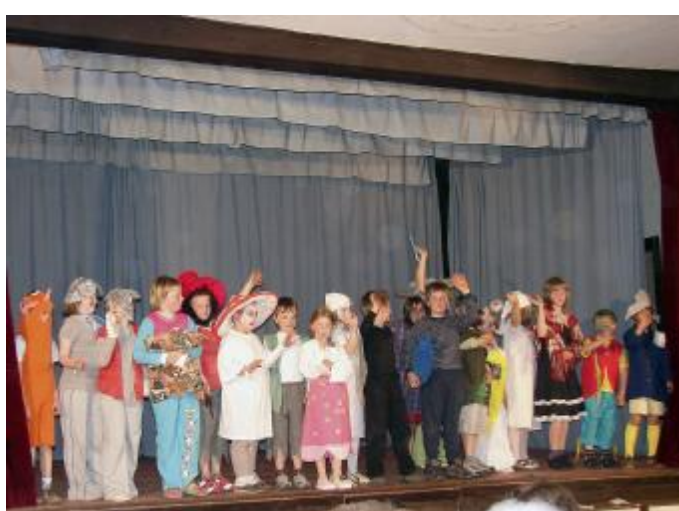
Děti ze sebranické družiny