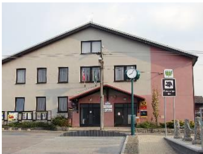
Zprovoznění 1. května 2009