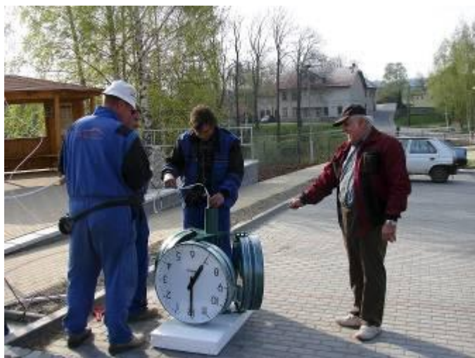
Trojstranné hodiny v detailu