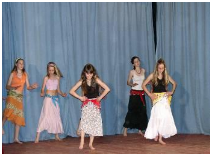
Ukázka břišních tanců v podání mladších a starších žákyň