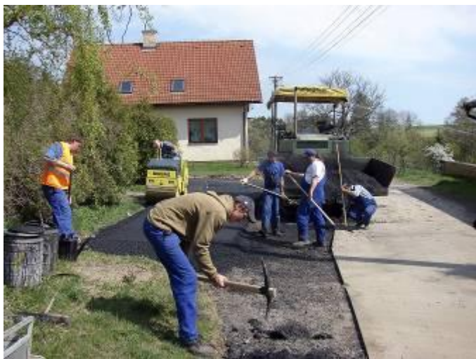
Pokládání živичné směsi