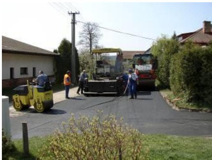
Válcování povrchu cesty