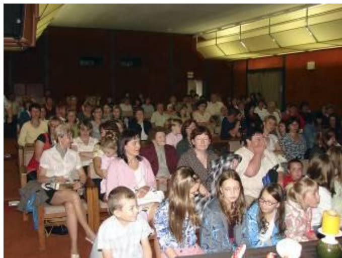
Pohled na zaplněný sál kina