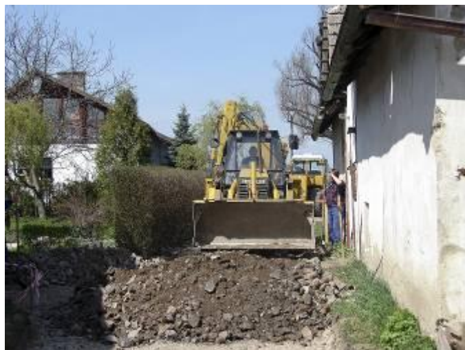
Navážení hrubého štěrku