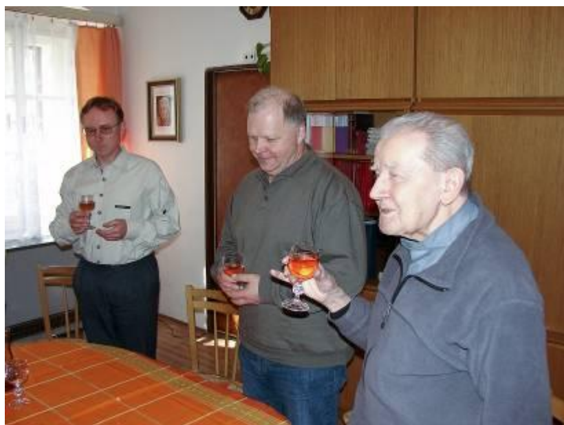
Slavnostní příchůtek při naší návštěvě na faře