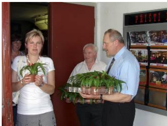
Předávání kytiček maminkám