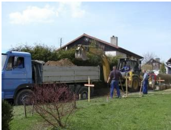
Úprava pro štěrkový kufr