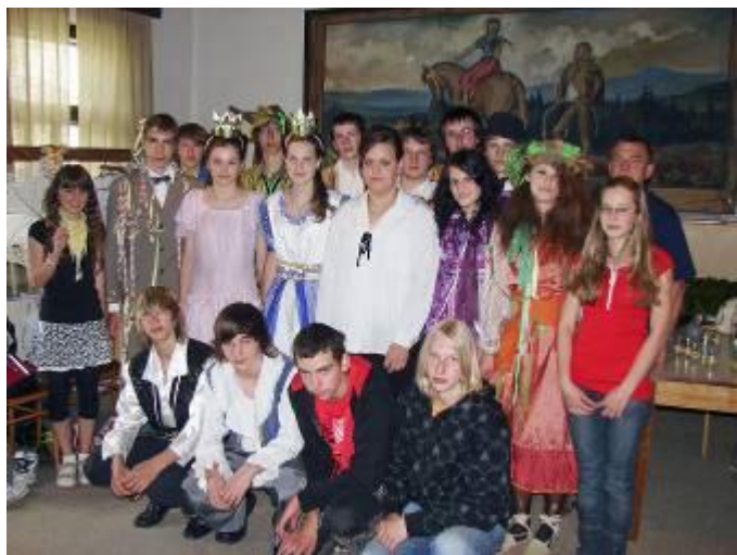
Žáci 9. třídy