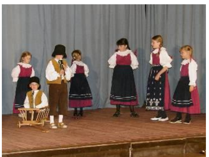
Vystoupení souboru Lubeňáček