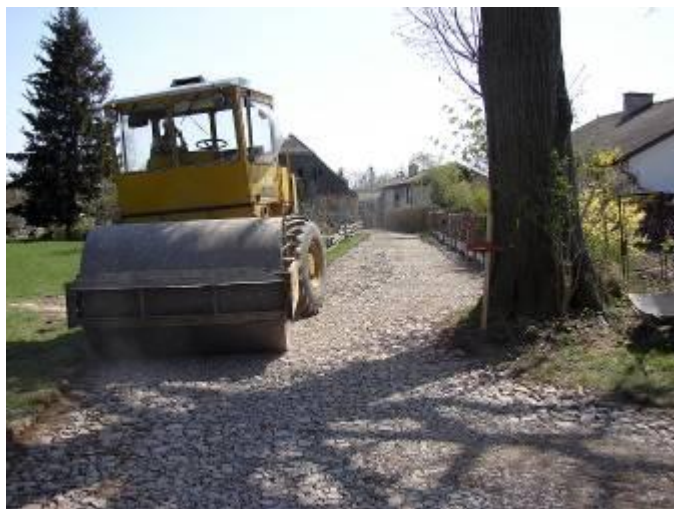
Hutnění štěrkového podkladu