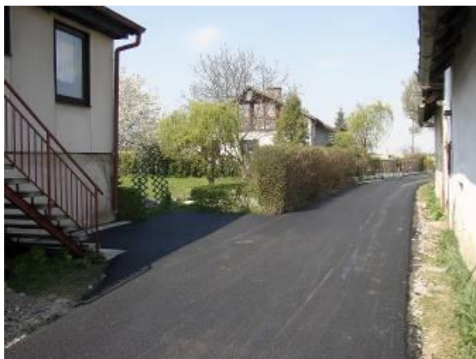
Nový stav komunikace