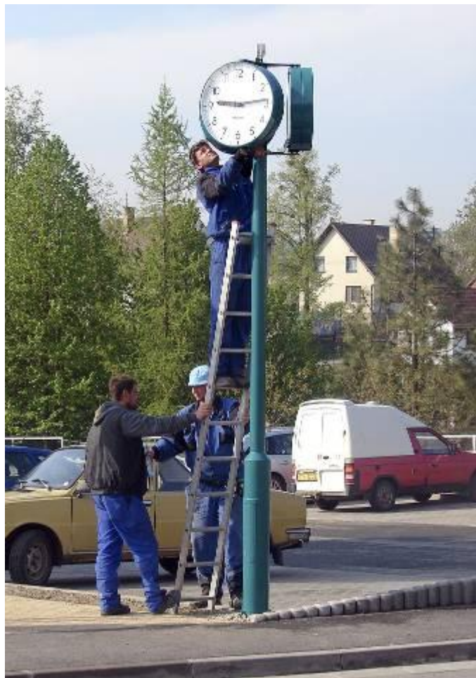
Kompletace hodin na sloupu