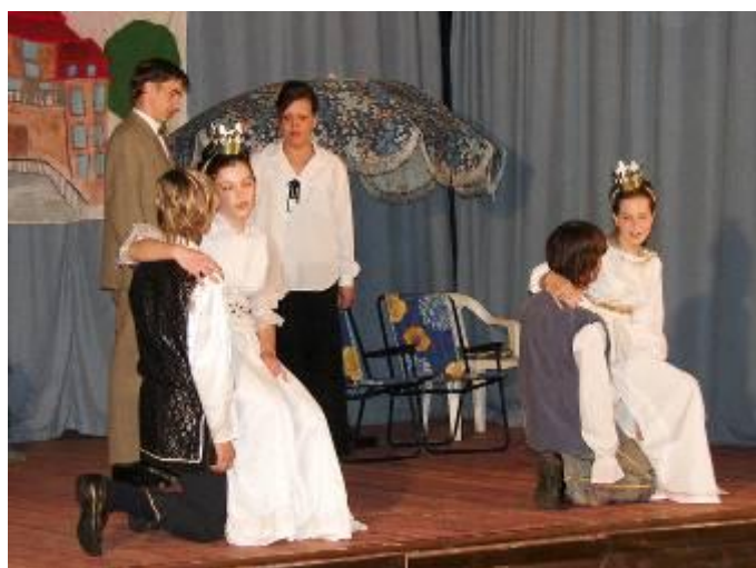
Divadelní představení Elixír a Halíbela