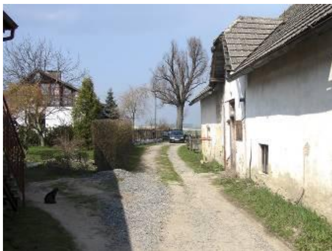
Původní stav komunikace

Zastupitelstvo obce na letošní rok vyčlenilo nemalé finanční prostředky na opravu místních komunikací v naší obci. V dubnu jsme provedli opravu komunikace na dolním konci. Jednalo se o založení štěrkového podkladu (tzv. kufru) pod cestu, rozšíření současné komunikace, zhotovení nájezdu směrem od Pavlišových a položení asfaltového povrchu. Při této akci si někteří naši občané nechali zhotovit (a uhradili) parkovací místa na svých soukromých pozemcích. Opravu komunikace provedla firma DS DELTA, s. r. o. Celkové náklady činily cca 500 000 Kč. Další naplánovanou akcí je oprava komunikace okolo Renzových směrem ke koupališti.