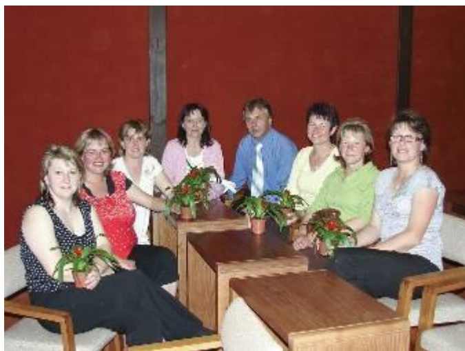
Naše maminky se starostou obce

„Všichni sedíme ve velkém divadle světa: cokoli se zde děje, týká se všech.“ „... jsme svobodné bytosti, jež v nekonečnu nekonečna samy sebe tvoří ...“