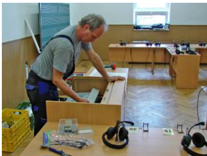
Instalace digitální jazykové učebny