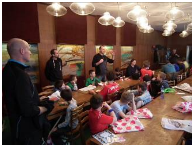
Občerstvovací zázemí pro účastníky turnaje