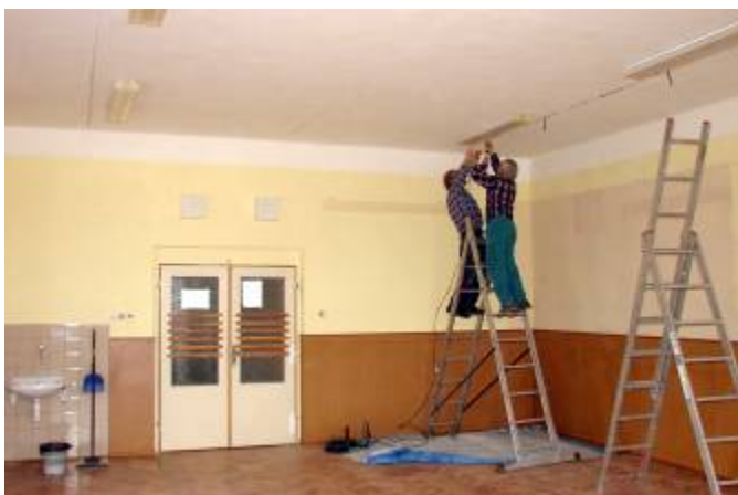
Instalace rozvodů pro LED osvětlení