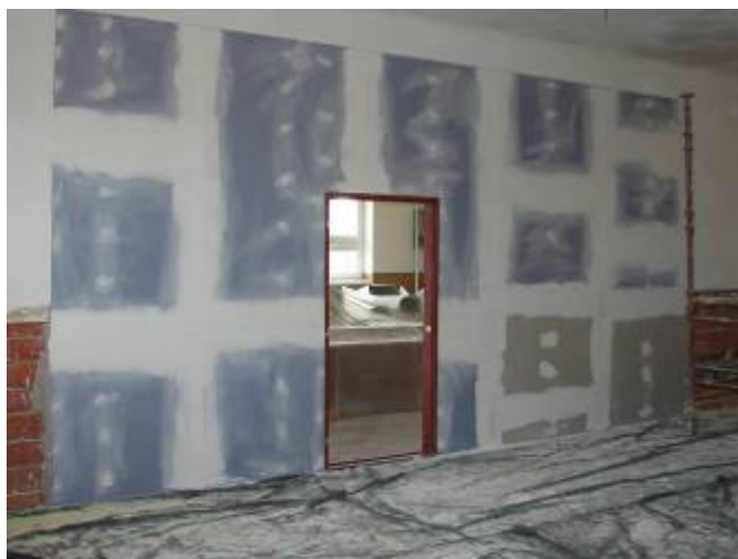
Přestavba jazykové učebny