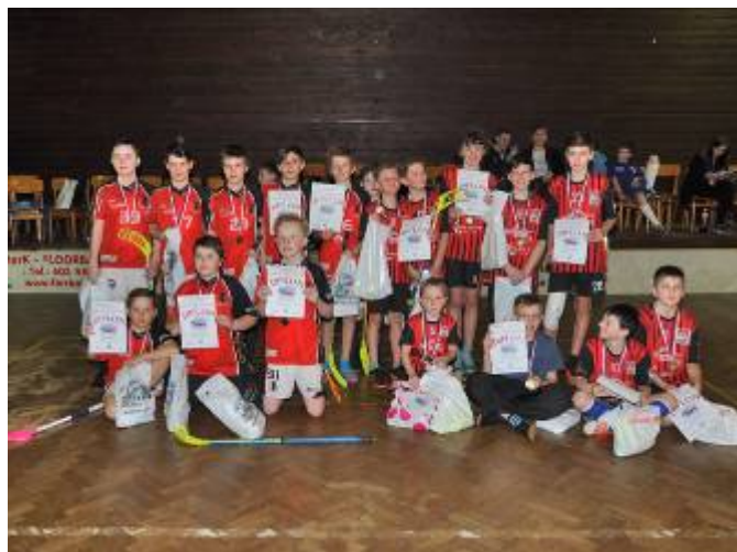
Mladší žáci - vítězné družstvo ze Skutče

V pátek turnaj tradičně zahájily týmy mladších a starších žáků, po kterých následovala