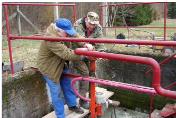
Oprava čerpadla na ČOV Lubná