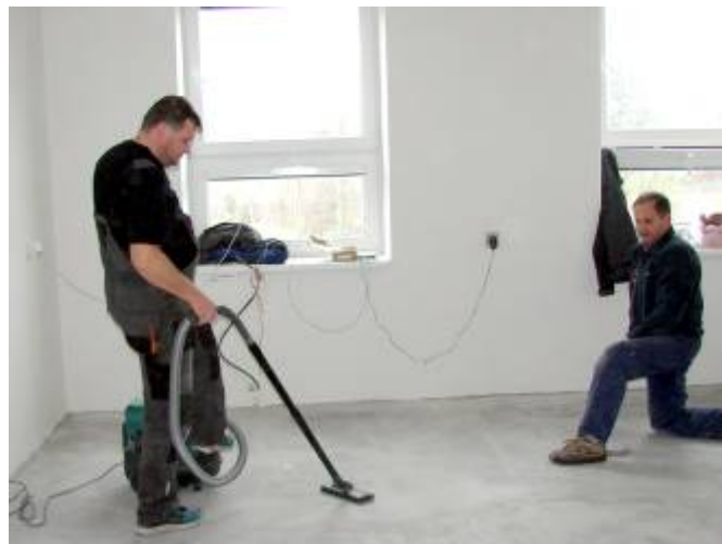
Stavební úpravy kadeřnictví