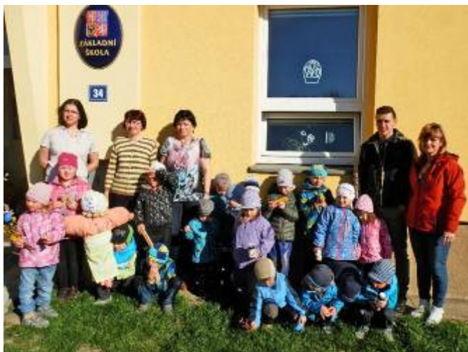
Vítání jara v základní škole