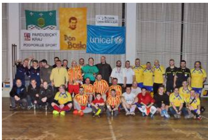
Společná fotka po ukončení turnaje veteránů