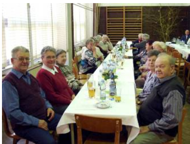
Dechová hudba Dolnovanka a lubenští senioři