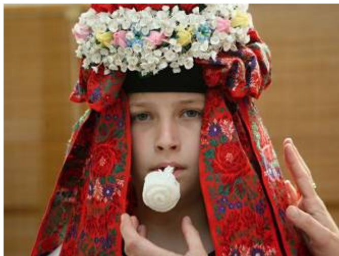
Jízda králů - čelo průvodu a král