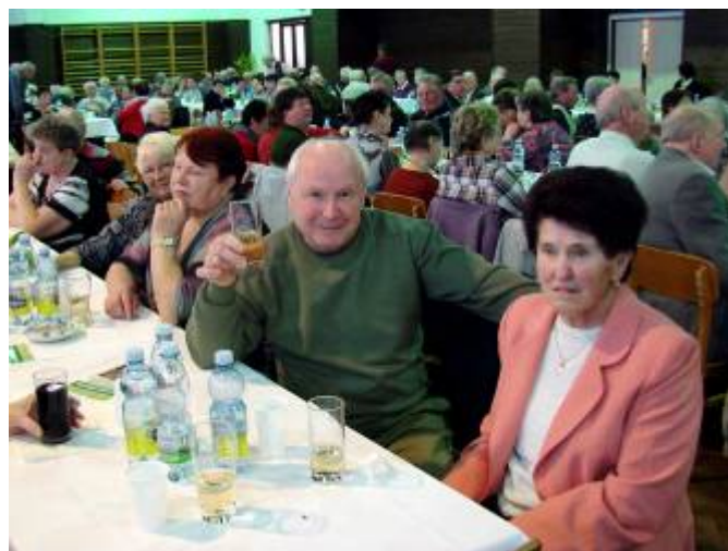
Pohled na zaplněný sál