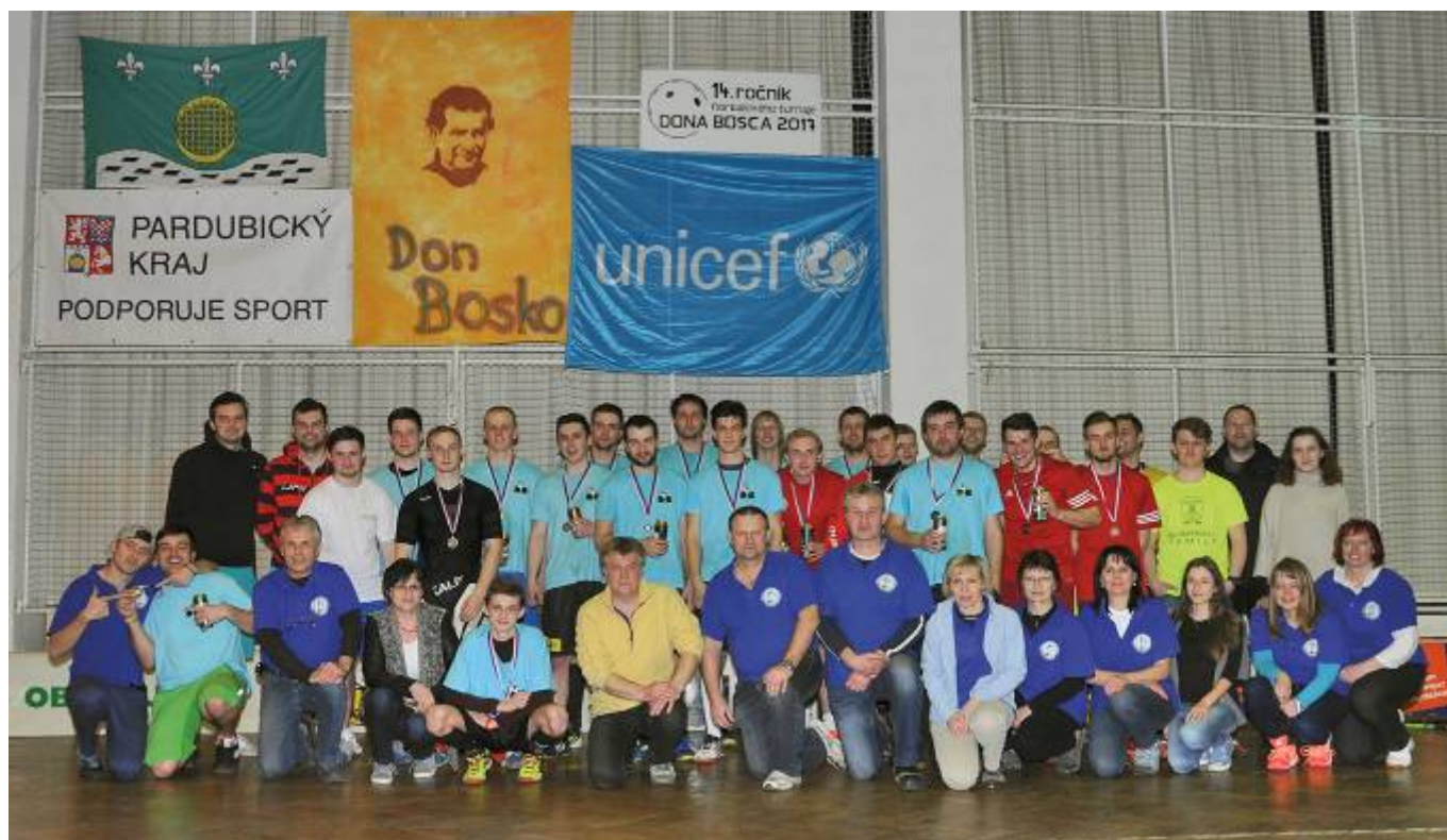
Pořadatelé a hráči při ukončení turnaje