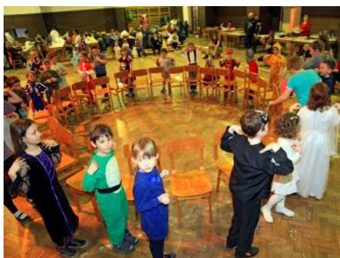
Dětský karneval na Skalce