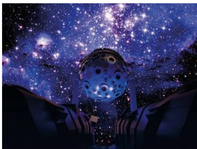
Planetárium - mechanická část a noční obloha