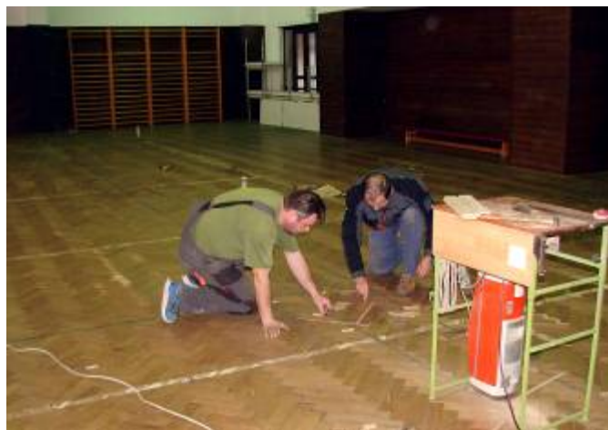
Oprava parket v objektu Skalka