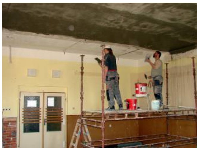
Oprava stropu a omítek