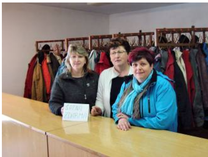
Naše milé šatnářky