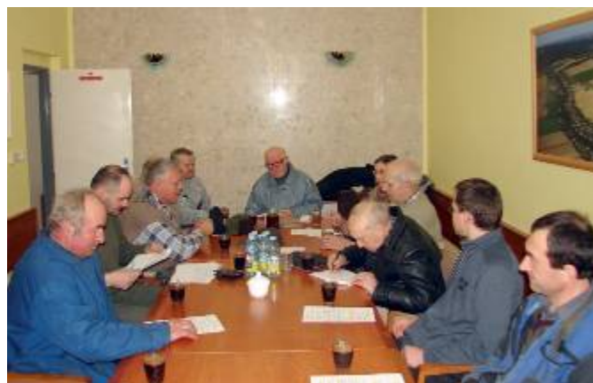
Členská schůze lubenských včelařů