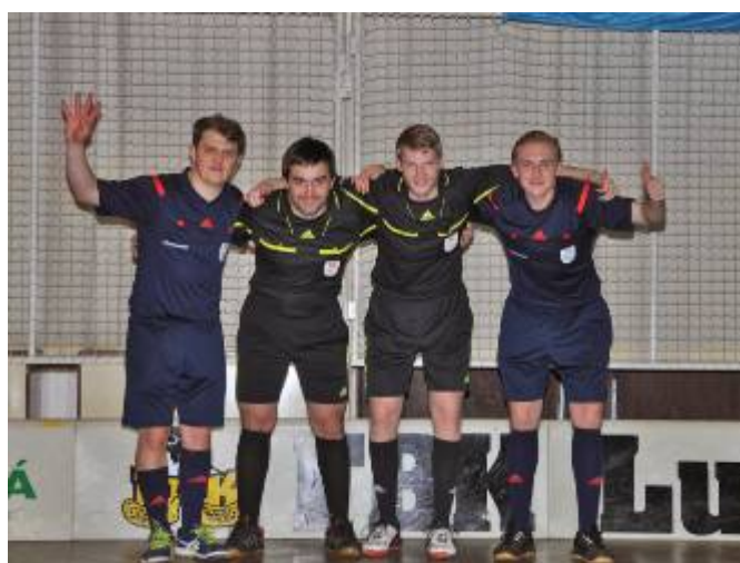
1. místo - starší žáci - YBK Okapáři Lubná a certifikovaní rozhodčí