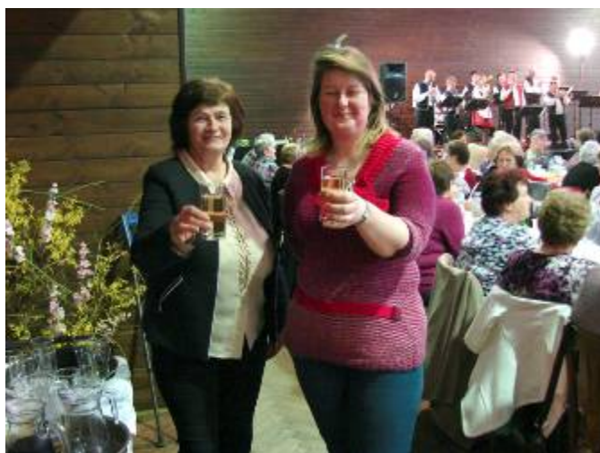
Lubenští zahrádkáři v akci