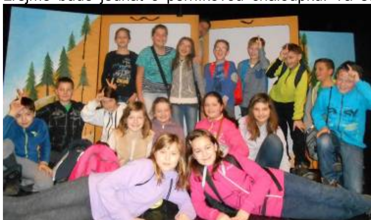
Žáci 5. třídy