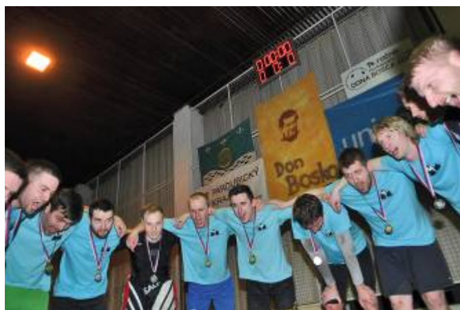
Vítězné družstvo mužů – Bílý balet Lubná