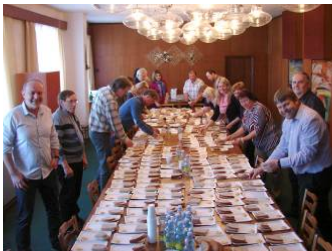
Starostové při přípravě občerstvení