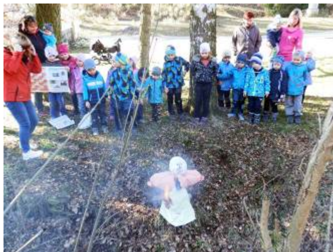
Pálení baby Zimnice