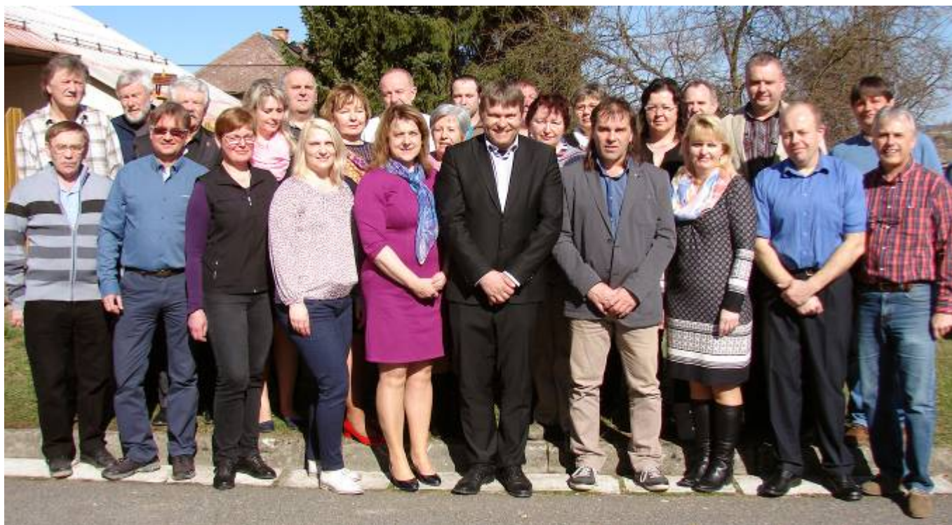
Zástupci z členských obcí Mikroregionu Desinka