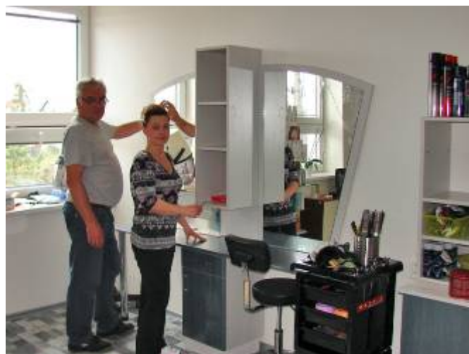
Manželé Chadimovi při stěhování nábytku